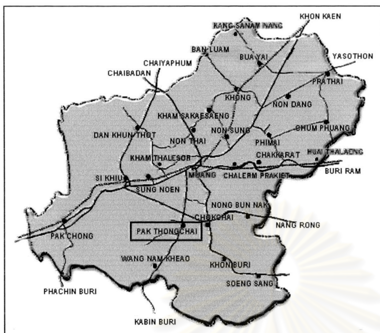
ภาพที่ 1.1 แผนที่อำเภอปกครองชัยจนครราชสีมา