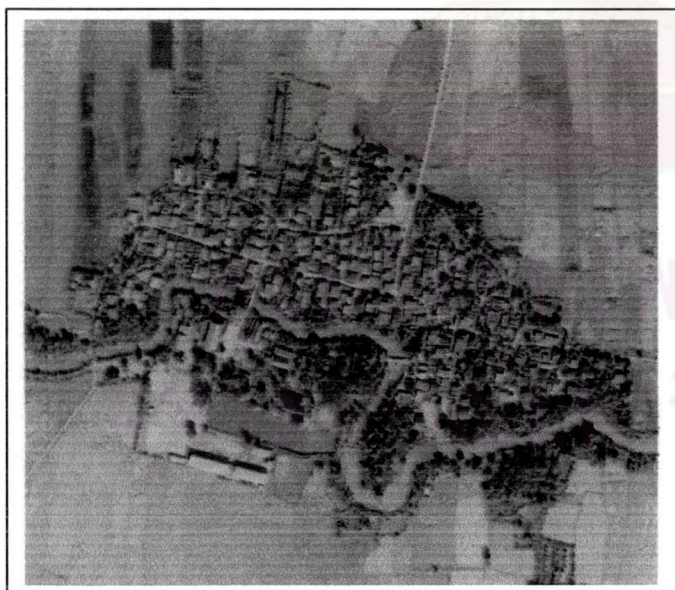
ภาพที่ 1.3 ถ่ายทางอากาศบ้านพระเพลิง ปี พ.ศ.2543

ภาพถ่ายทางอากาศปี พ.ศ. 2518(ภาพที่ 1.2) พบว่า บ้านพระเพลิง สอดคล้องกับการสัมภาษณ์และการสำรวจทางกายภาพ คือ ทางเข้าออกทางเดียว บ้านตั้งอยู่ใกล้กับวัด ติดริมน้ำ หรือที่สูง มีลักษณะเป็นป่าล้อมหมู่บ้าน บริเวณที่ราบลุ่มรอบๆ หมู่บ้านเป็นพื้นที่ทำการเกษตร และริมบ้านจะเป็นบริเวณป่าช้า อยู่ในระดับเดียวกัน