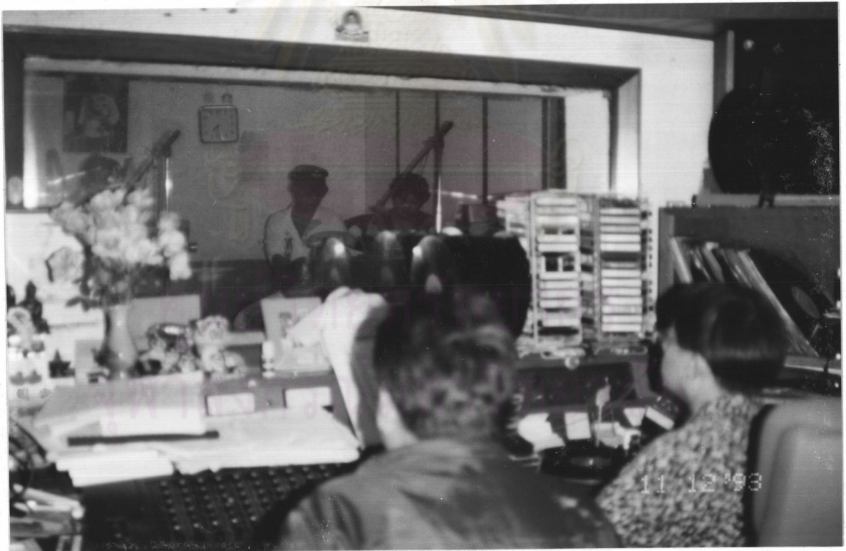
เจ้าหน้าที่ควบคุมการบันทึกเสียง ทำงานร่วมกับเจ้าหน้าที่ให้เพลงและเสียงประกอบ