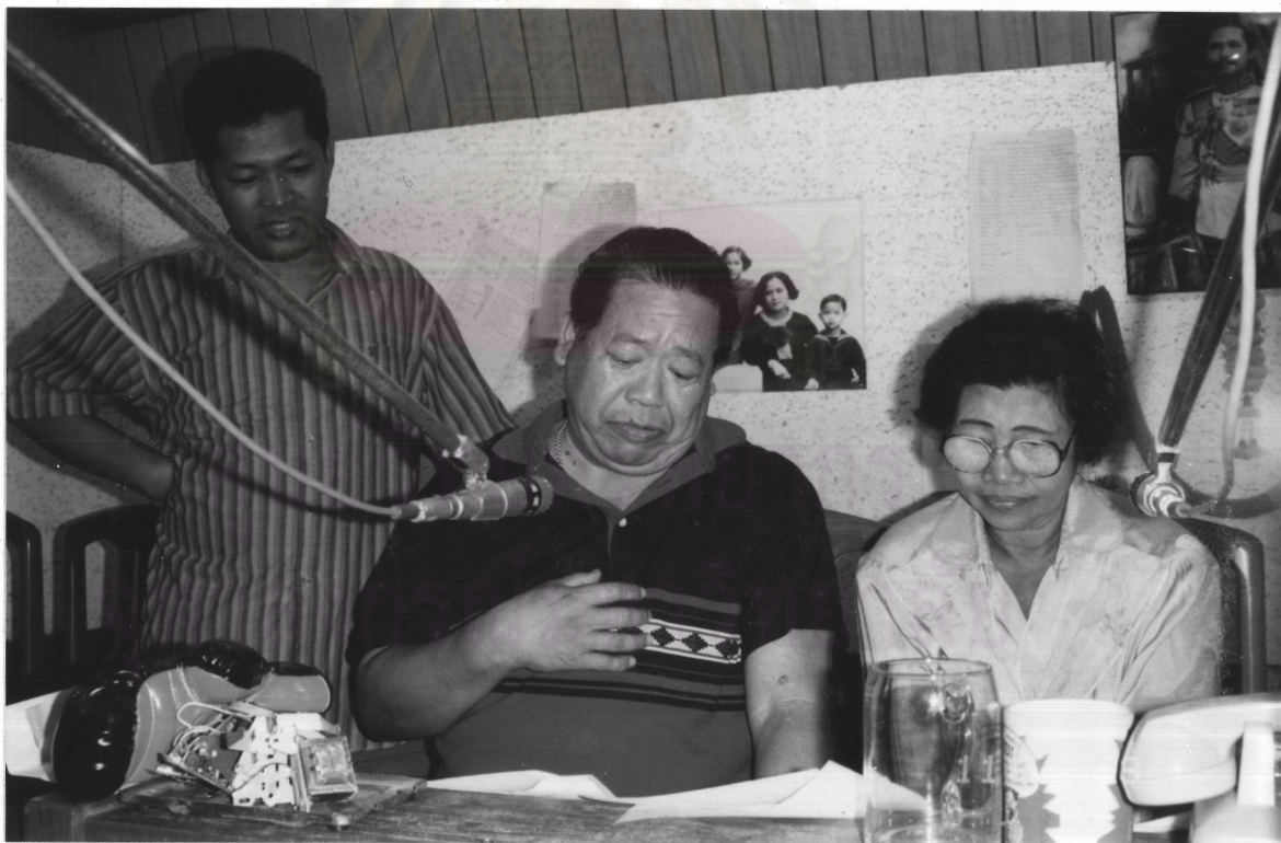
ผู้แสดงละครวิทยุ ๗๗๖ บ้านกักเสียง