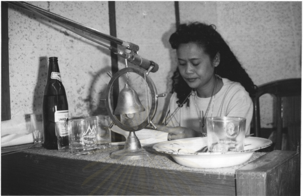
ผู้แสดงกับอุปกรณ์ที่ใช้ทำเสียงประกอบในละครวิทยุ