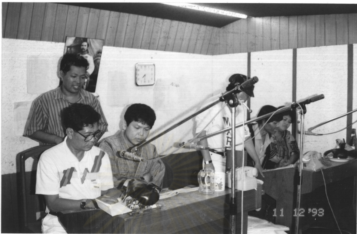
ผู้แสดงละครวิทยุ ๗๗๖ บ้านกักเสียง