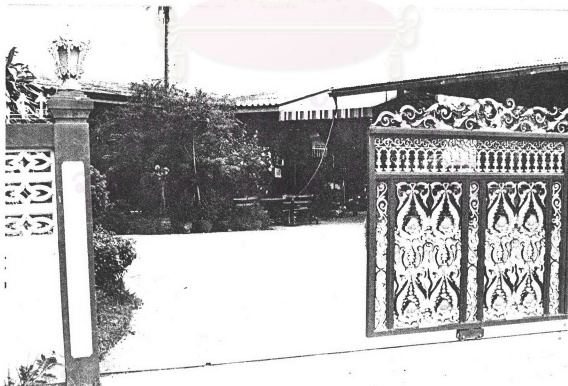
ภาพที่ 7 : แสดงบ้านของกำนันละออง ตรีสินธุ์