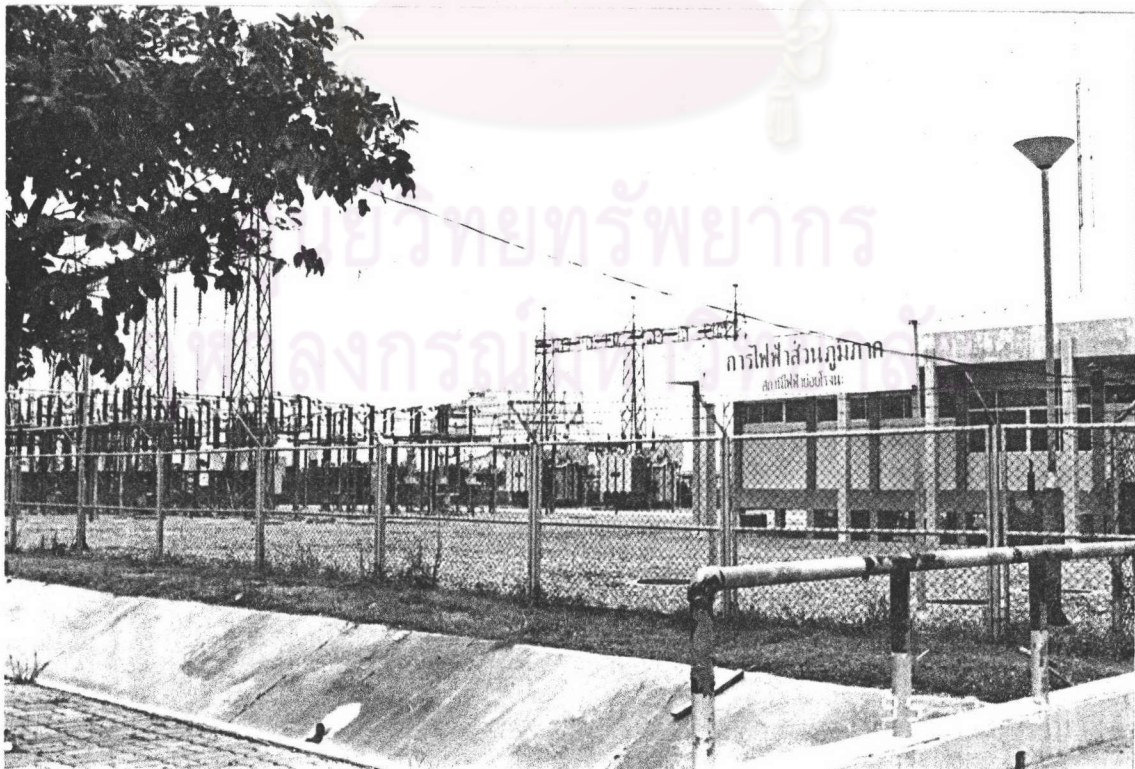
ภาพที่ 15 : แสดงสถานีไฟฟ้าย่อยโรจนะภายในเขตอุตสาหกรรม