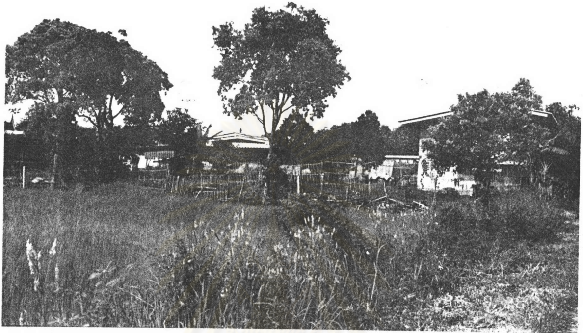
ภาพที่ 4 : แสดงลักษณะการตั้งบ้านเรือนภายในชุมชน