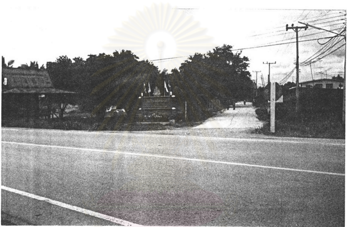
ภาพที่ 1 : ปากทางเข้าหมู่บ้าน