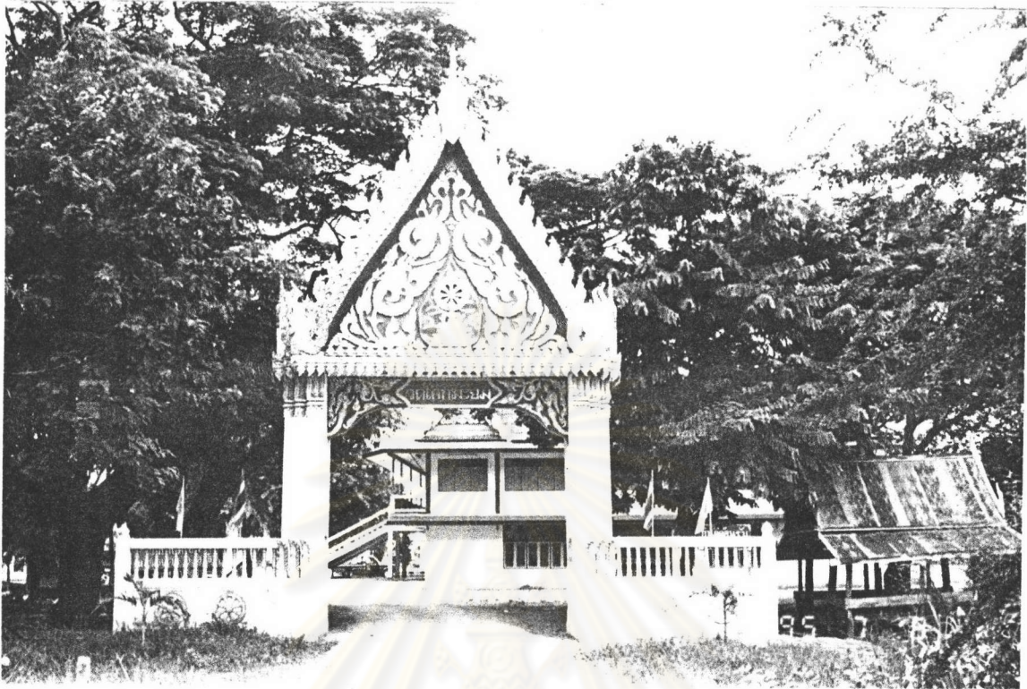
ภาพที่ 8 : แสดงวัดโคกมะยม