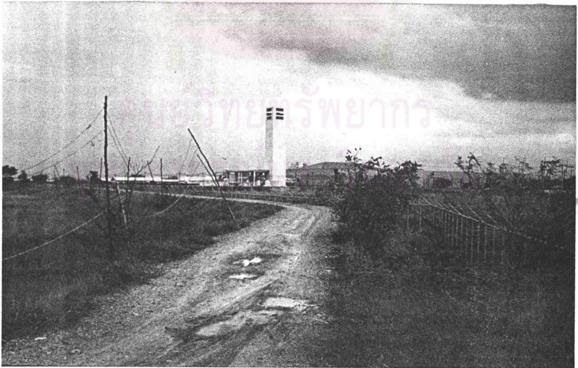
ภาพที่ 13 : แสดงเขตติดต่อระหว่างหมู่บ้านกับโรงงาน