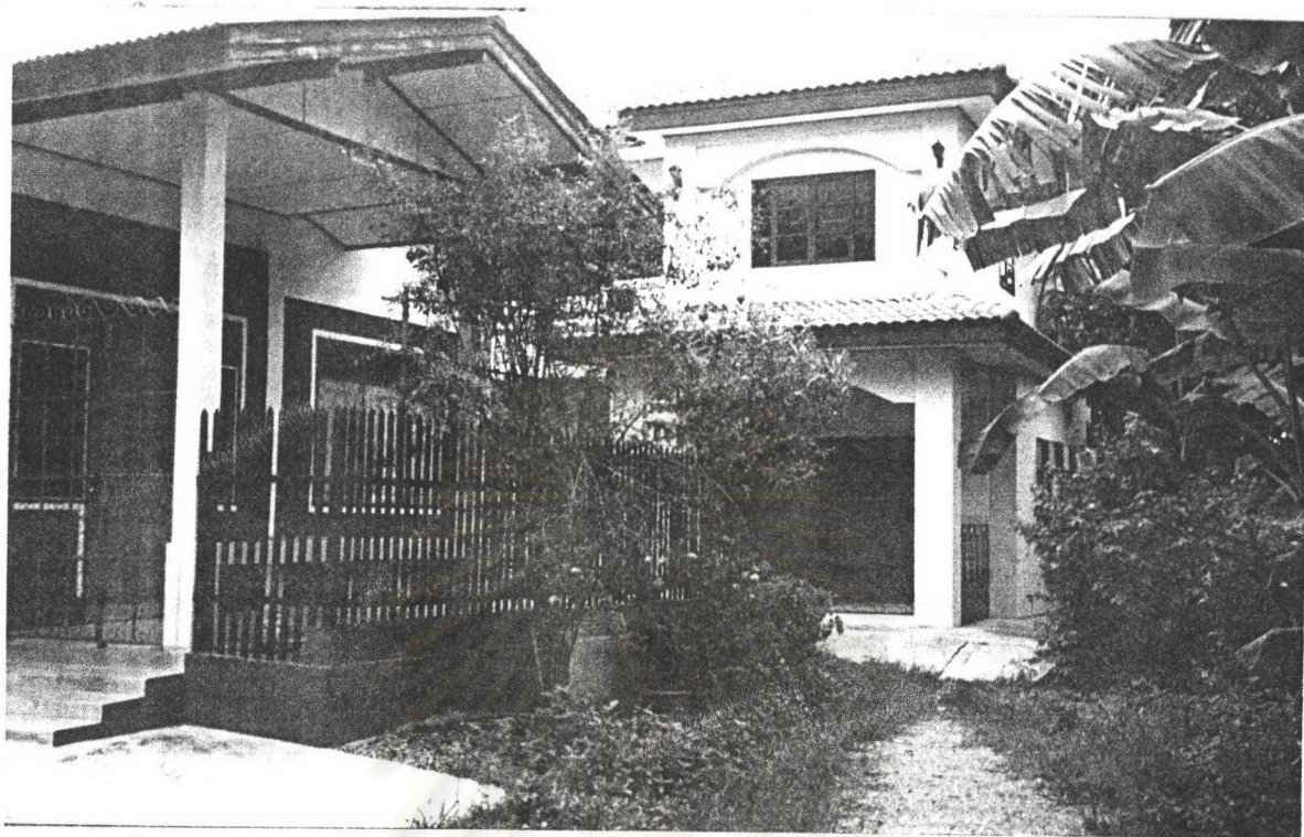
ภาพที่ 6 : แสดงสภาพบ้านเรือนภายในชุมชน