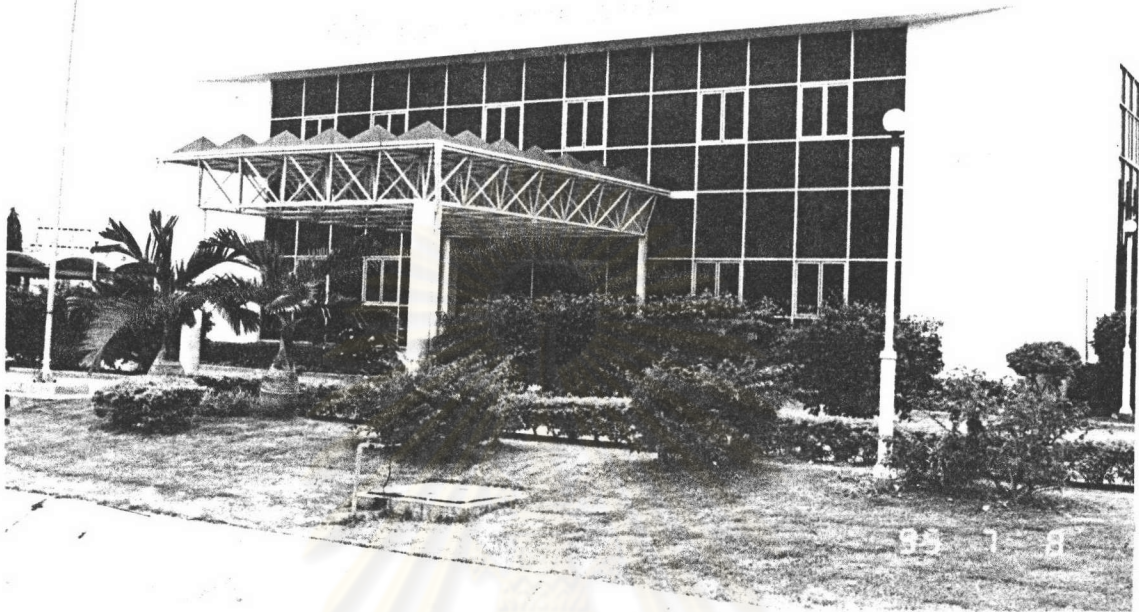
ภาพที่ 14 : แสดงที่ทำการสวนอุตสาหกรรมโรจนะ