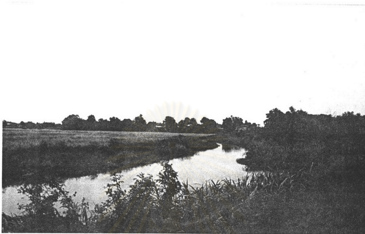
ภาพที่ 10 : แสดงคลอง โภกมะยม