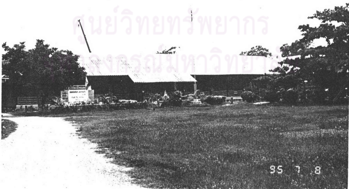
ภาพที่ 9 : แสดงโรงเรียนวัดโคกมะยม