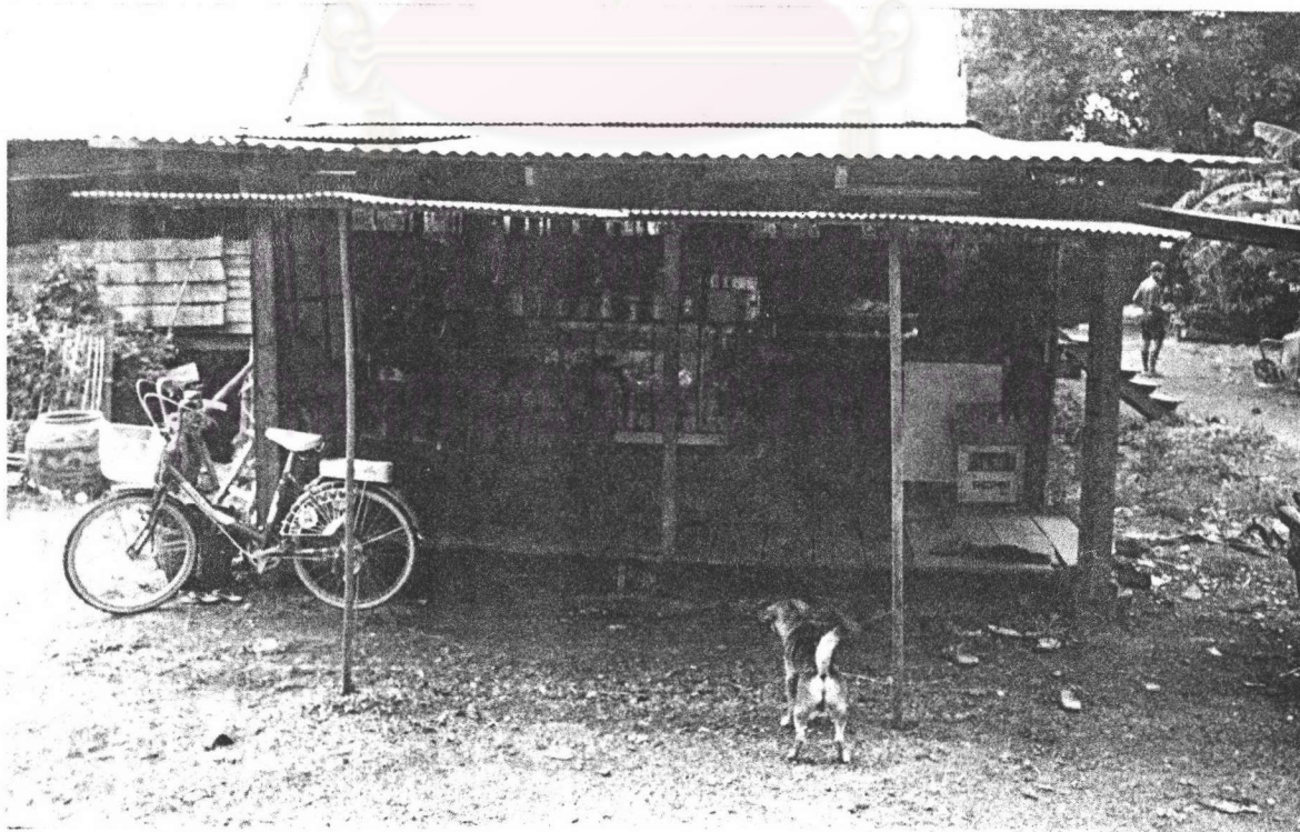
ภาพที่ 11 : แสดงร้านค้าภายในชุมชน