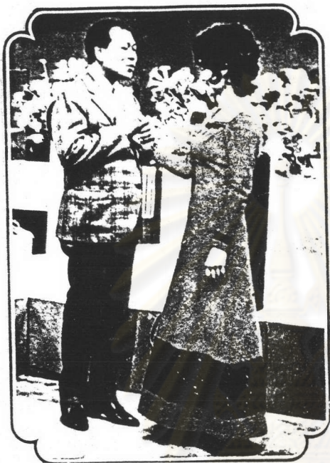
ตัวอย่างภาพที่ 7.1 การแต่งกายแบบสากลนิยมของศิลปินเพลงไทยสากลยุคแรก ๆ ที่ลอกเลียนแบบชุดสากลของทางชาติตะวันตก