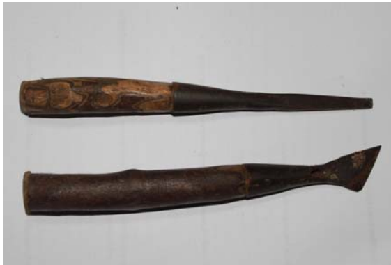
ภาพที่ 14 สิวปลายตัด สำหรับใช้แกะสลักไม้