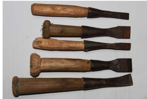
ภาพที่ 15 สิวปลายตัด สำหรับใช้แกะสลักไม้