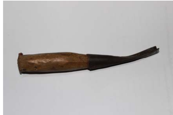
ภาพที่ 13 สิวรูปตัว V สำหรับใช้แกะสลักไม้