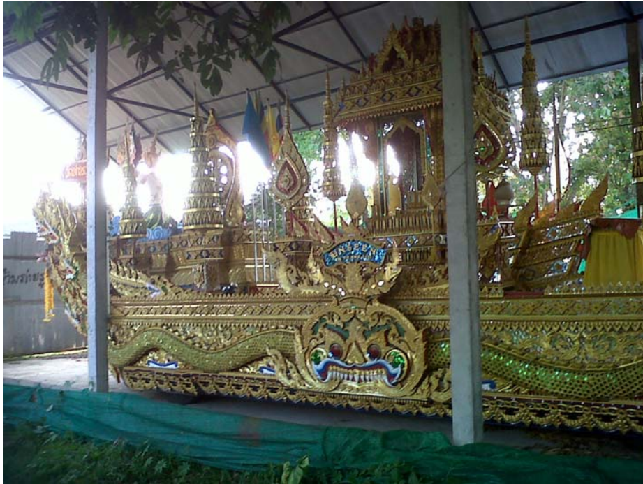
ภาพที่ 4 บุษบก สร้างไว้กลางลำเรือ สำหรับประดิษฐานพระพุทธรูป เรือพนมพระวัดท่าพญา อำเภอปะเหลียน จังหวัดตรัง