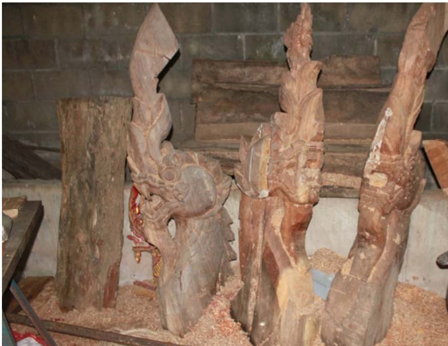
ภาพที่ 5 หัวพญานาคไม้แกะสลัก