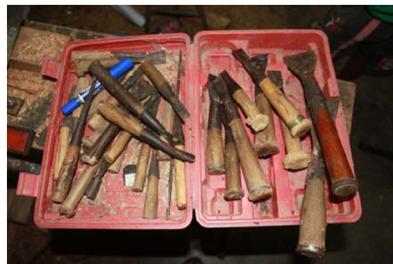
ภาพที่ 17 เครื่องมือแกะสลักไม้

หมายเหตุ : บันทึกภาพ ณ วันที่ 25 มีนาคม 2555