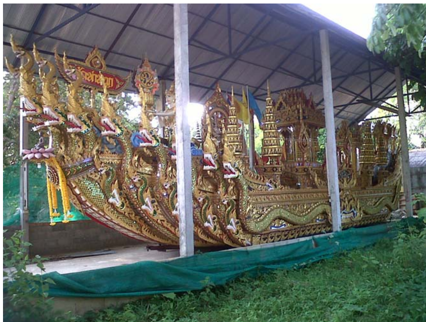
ภาพที่ 1 เรือพนมพระวัดท่าพญา อำเภอปะเหลียน จังหวัดตรัง

สามารถสรุปได้ว่า เรือพนมพระ คือ ขบวนรถที่ตกแต่งเป็นรูปเรือที่ตกแต่งอย่างวิจิตรสวยงามด้วยลวดลายไทยแบบต่างๆ ส่วนสำคัญที่สุดของเรือพนมพระ คือ บุษบก ใช้สำหรับประดิษฐานพระพุทธรูปปางอุ้มบาตร ประกอบในประเพณีชักพระในช่วงวันออกพรรษาของบางจังหวัดทางภาคใต้ของประเทศไทยเท่านั้น เช่น สงขลา นครศรีธรรมราช ตรัง และสุราษฎร์ธานี