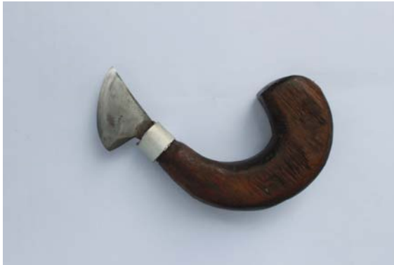
ภาพที่ 12 มีดขูด สำหรับใช้สำหรับฉลุ ลวดลายกระดาด