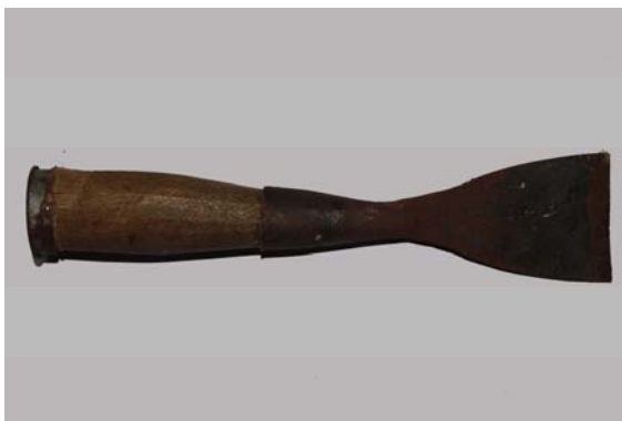
ภาพที่ 16 สิวปลายโค้ง สำหรับใช้แกะสลักไม้