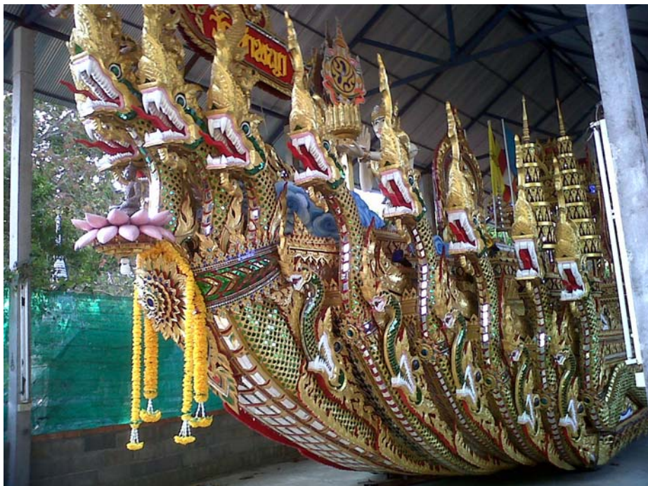
ภาพที่ 3 ส่วนหัวเรือ สร้างเป็นหัวพญานาค เรือพนมพระวัดท่าพญา อำเภอปะเหลียน จังหวัดตรัง