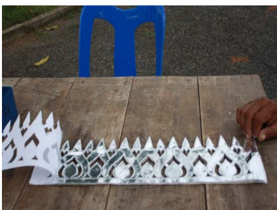
ภาพที่ 10 กระดาษเงินฉลุลวดลายสำเร็จ