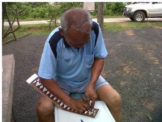
ภาพที่ 7 ตาเสนอ ศรีเรือง สำนิตการฉลุ ลวดลายกระดาษ