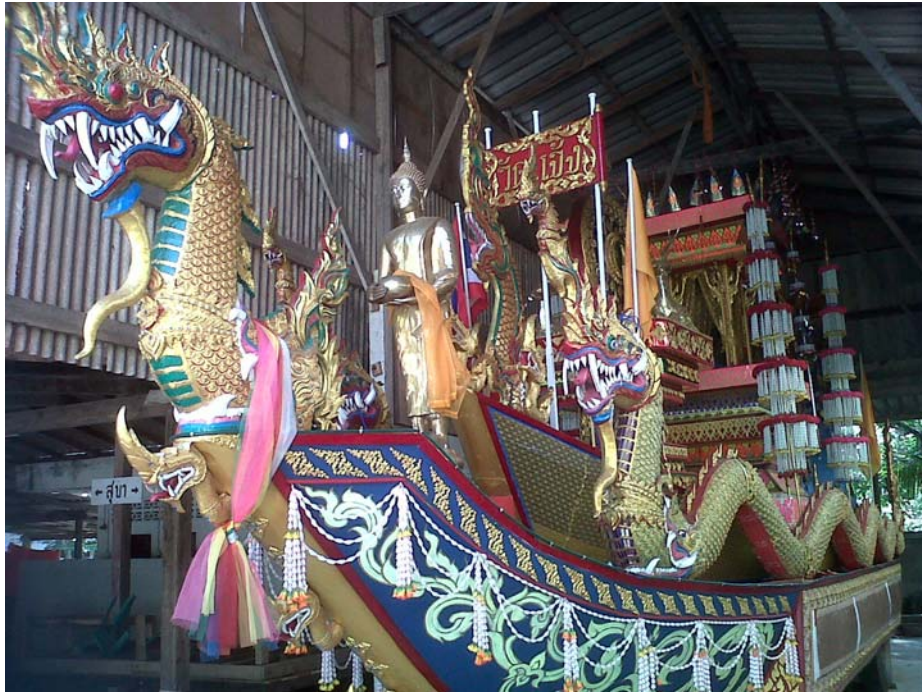
ภาพที่ 2 เรือพนมพระวัดแจ้ง อำเภอเมือง จังหวัดตรัง