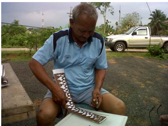
ภาพที่ 8 ตาเสนอ ศรีเรือง สำนิตการฉลุ ลวดลายกระดาษ