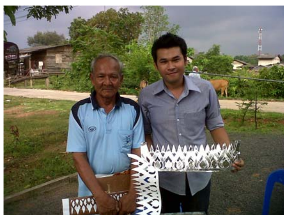
ภาพที่ 11 กระดาษเงินฉลุลวดลายสำเร็จ

หมายเหตุ : บันทึกภาพ ณ วันที่ 19 มีนาคม 2555