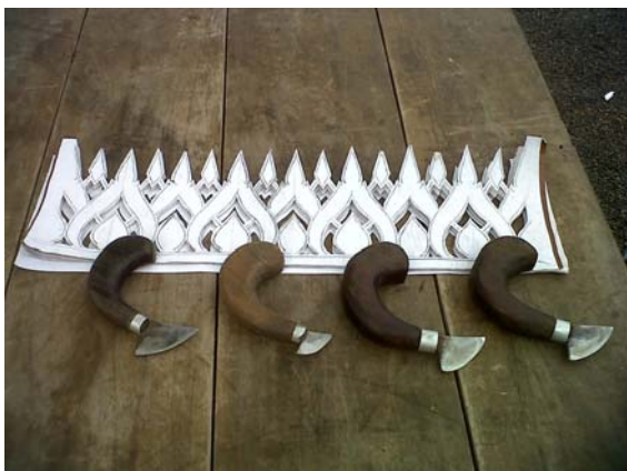
ภาพที่ 6 มีดขุดสำหรับฉลุลายกระดาษ และต้นแบบลวดลายกระดาษ