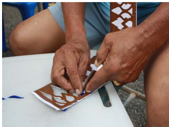
ภาพที่ 9 ตาเสนอ ศรีเรือง สำนิตการฉลุ ลวดลายกระดาษ