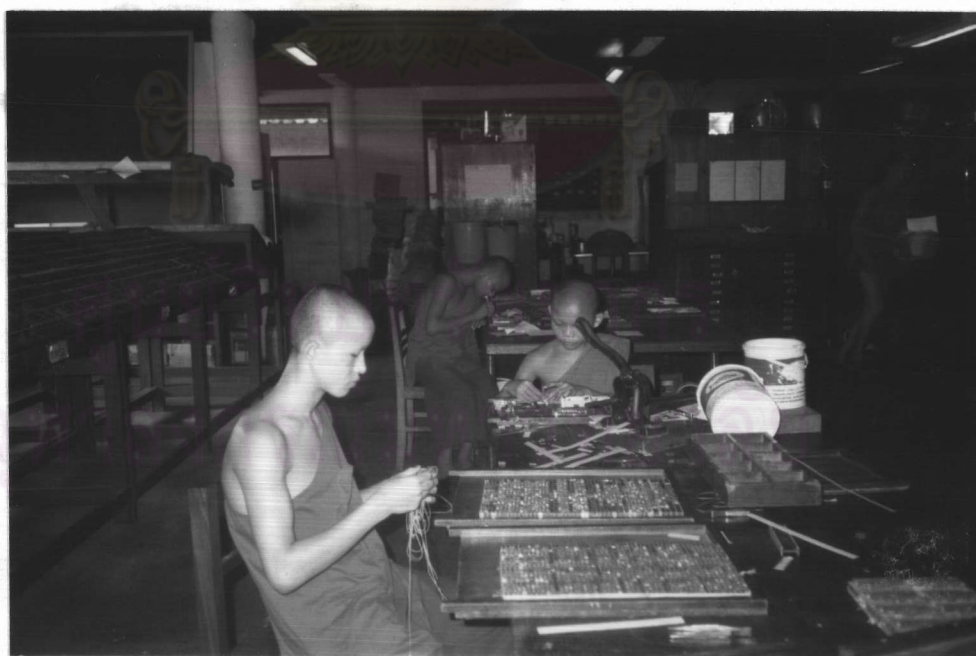
รูปภาพที่ 29 นักศึกษาขณะฝึกปฏิบัติงานในแผนกโรงนิรม์