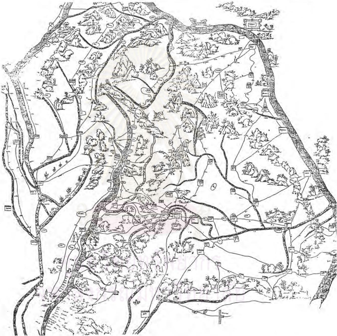
ภาพที่ 2 แผนที่ภาคตะวันออกเฉียงเหนือในสมัยรัชกาลพระบาทสมเด็จพระนั่งเกล้าเจ้าอยู่หัว

ที่มา Victor Kennedy, "An Indigenous Early Nineteenth Century Map of Central and Northeast Thailand," In Memorian Phya Anuman Rajadhon . Tej Bunnag and Michael Smithies ed. (Bangkok : Journal of The Siam Society, 1970), p 315-348.