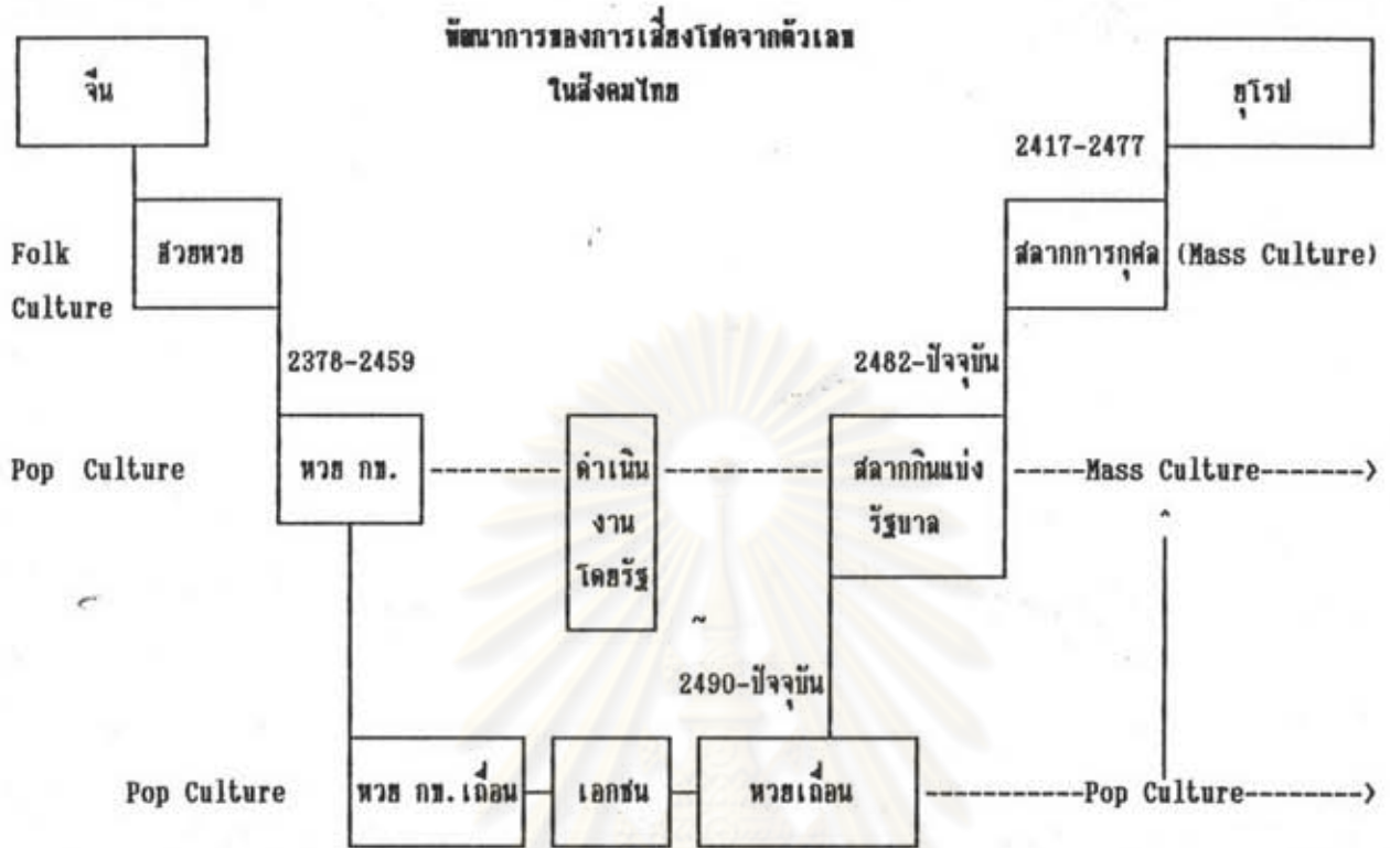
แผนภาพที่ 5 : พัฒนาการของการสื่อสารโศดจากตัวเลขในสังคมไทย