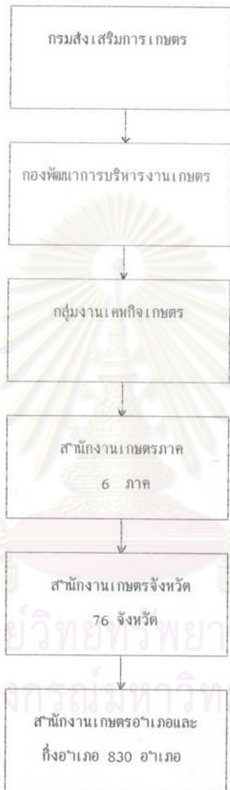
แผนผังที่ 2 แสดงโครงสร้างการดำเนินงานส่งเสริมเคหกิจเกษตร (กรมส่งเสริมการเกษตร, 2527)