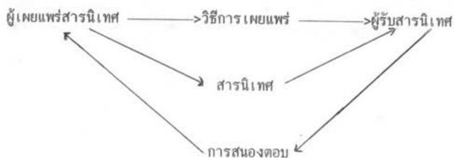
ภาพที่ 1 องค์ประกอบของการเผยแพร่สารนิเทศ (แมนมาส ซวลิต, 2532)