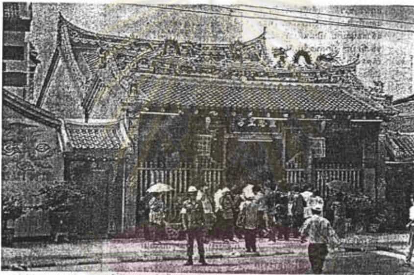
ศาลเจ้าแม่ลิ้มกอเหนี่ยว หรือ ศาลเจ้าแม่ลิ้มกอเหนี่ยว เป็นที่ยึดเหนี่ยวทางใจ ผู้คนในปัตตานี มีคำขวัญว่า ศาลเจ้าแม่ลิ้มกอเหนี่ยวศักดิ์สิทธิ์ของเจ้าแม่ ให้ปัตตานีอุดมสมบูรณ์