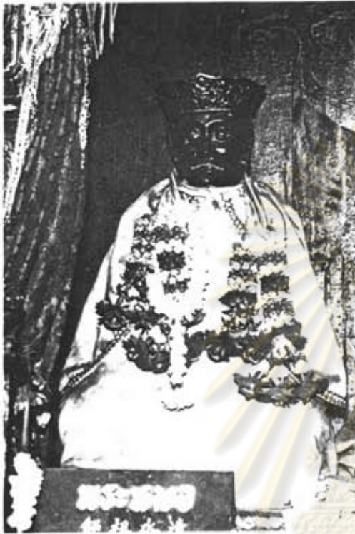
ภาพที่ 18 แสดงสภาพภายในศาลเจ้าเล่งจูเกียง องค์พระทอม เจ้าแม่ลิ้มกอเหนี่ยว