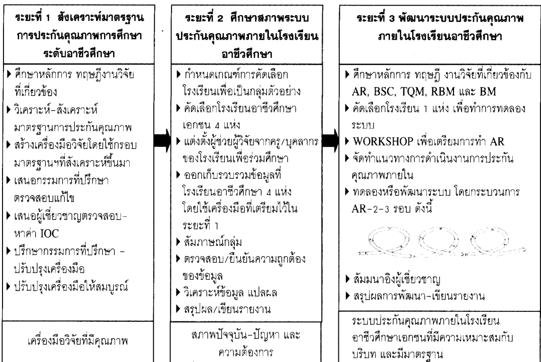
แผนภาพที่ 2 สรุปขั้นตอนการวิจัย ทั้ง 3 ระยะ

รายละเอียดการดำเนินงานทั้ง 3 ระยะ สามารถสรุปได้ดังแผนภาพที่ 2 ดังต่อไปนี้