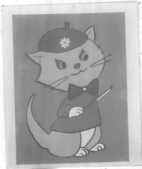
ภาพประดิษฐ์ คาสลิน