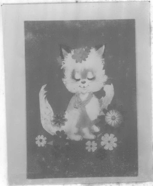
ภาพประดิษฐ์ 115641 21