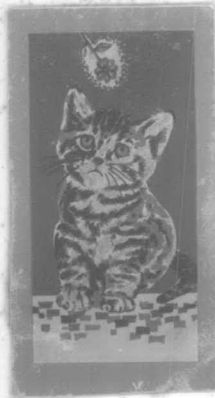
ภาพเหมือนจริง 115641