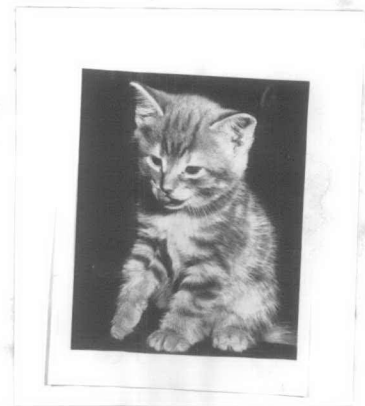
ตัวอย่างภาพที่ใช้ในการทดลองประเภทสีขาวดำ