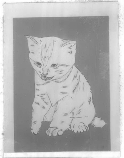
ภาพเหมือนจริง คาสลิน