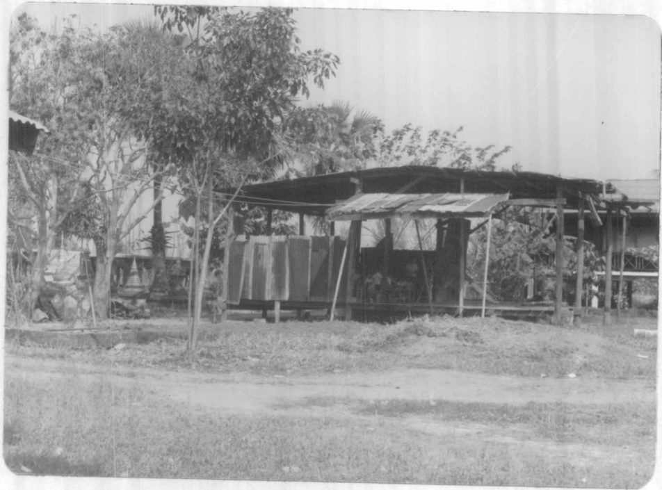
ศูนย์พัฒนาเด็กเล็กวัดเกิดการอุดม ตำบลคลองสาม อำเภอลำปางหลวง จังหวัดปทุมธานี