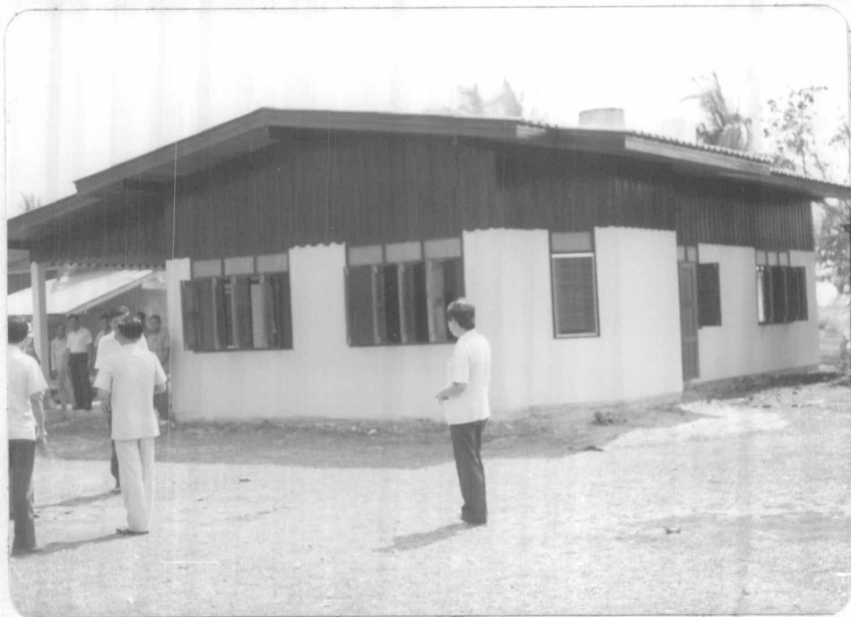
ศูนย์พัฒนาเด็กเล็ก วัดเกิดการอุดม แห่งใหม่ ซึ่งจะเปิดดำเนินการแทน ศูนย์ฯ เก่า (หน้า ๑๐๘) ตั้งแต่ปีการศึกษา ๒๕๒๕ เป็นต้นไป