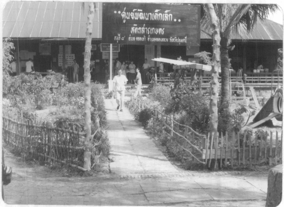
เด็ก ๆ กำลังออกกำลังกายกันอย่างสนุกสนานในบริเวณสนามเด็กเล่น ศูนย์พัฒนาเด็กเล็ก วัดหัตถสารเกษตร ตำบลคลองห้า อำเภอลองหลวง จังหวัด ปทุมธานี