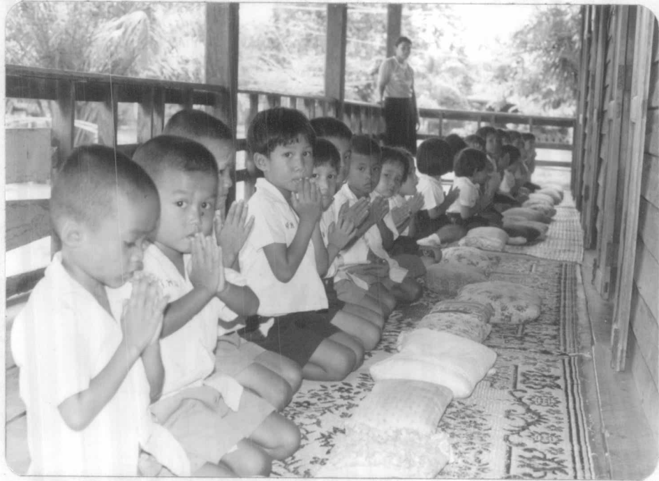
ผู้ดูแลเด็กจะดูแลให้เด็ก ๆ สวดมนต์ และนอนพักผ่อนในช่วงบ่าย เวลา