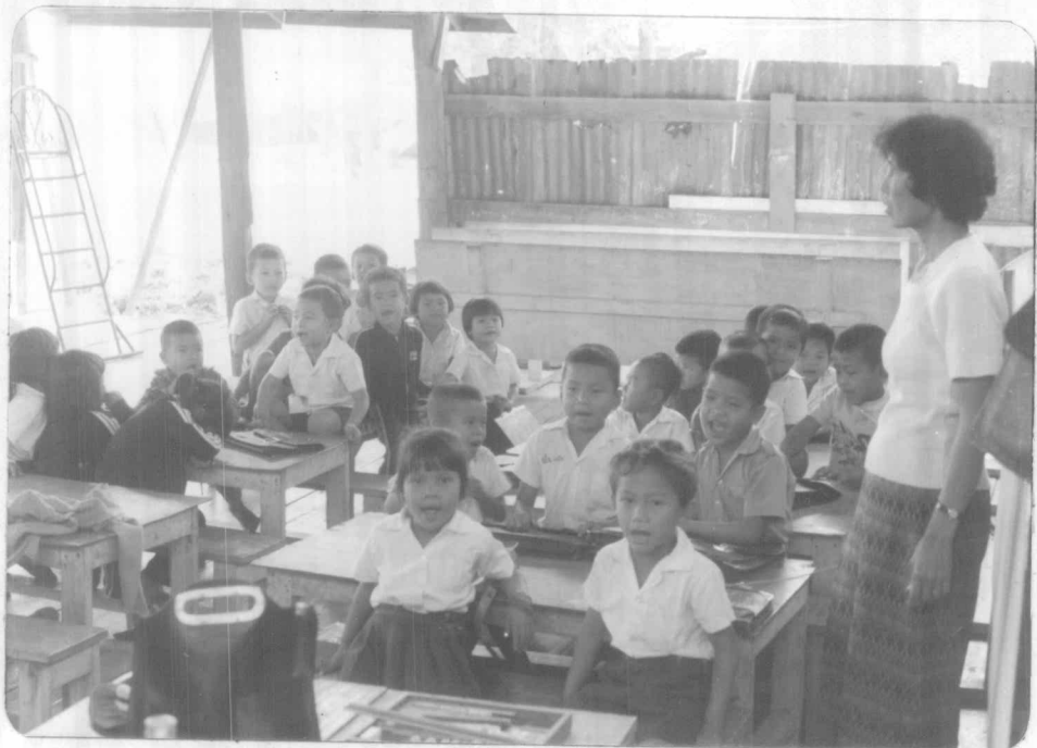
เด็ก ๆ ในศูนย์พัฒนาเด็กเล็กวัดเกิดการอุดม กำลังเตรียมตัวกลับบ้าน สตรีในภาพคือ ผู้ดูแลเด็ก