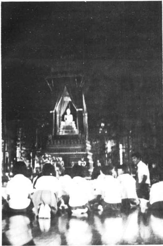
นักเรียนกำลังนมัสการพระพุทธสิหิงส์ ณ พระที่นั่งพุทไธสวรรย์