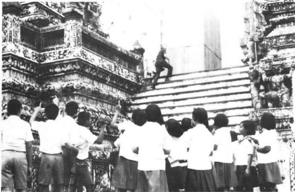
นักเรียนกำลังชมความงามของพระปรางค์วัดอรุณ