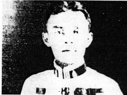
รูปที่ 2 ภาพเครื่องแต่งกายชุดมหาดเล็ก

ปีนป่าขึ้นไปบนองค์พระปฐมเจดีย์ มุดลอดออกมาตรงฐานเหนือคอรระมัง สมเด็จพระบรมฯ ทรงส่งกลองทอศพระเนตร เป็นที่ชอบพระทัย ตรัสเรียกเด็ก 2 คนนี้ว่า ลิงขาว ลิงดำ โดยอุ้นคือลิงดำ และจิตรคือลิงขาว ซึ่งต่อมาทั้งลิงขาวและลิงดำกลายเป็นนักดนตรีผู้มีฝีมือทั้งคู่ เมื่อวันที่ 23 ตุลาคม พ.ศ. 2453 สมเด็จพระบรมโอรสาธิราชฯ เสด็จเถลิงถวัลย์ราชสมบัติเป็นพระบาทสมเด็จพระปรเมนทรมหาอานันทมหิดล พระมยุฎเกล้าเจ้าอยู่หัว และได้ทรงโปรดเกล้าฯ ให้ตั้งกรมมหรสพโดยแบ่งส่วนราชการออกเป็นกรมต่าง ๆ คือ กรมบัญชาการ กรมช่างมหาดเล็ก กรมพิณพาทย์หลวง กรมโขนหลวง ทั้งนี้กรมพิณพาทย์หลวง มีทั้งเครื่องสายและปี่พาทย์ มีพระยาประสานดุริยศัพท์ (แปลก ประสานศัพท์) เป็นเจ้ากรม ต่อมาเมื่อพระราชประสงค์ให้ตั้งกองเครื่องสายฝรั่งหลวง หลวงไพเราะฯ จึงเป็นผู้หนึ่งที่ได้รับเลือกไปฝึกหัดไวโอลิน และเรียนอยู่ไม่นานเพียง 2 ปี ก็ได้เป็นมือไวโอลินมือหนึ่งของกองเครื่องสายฝรั่งหลวงในขณะนั้น จนเป็นที่พอพระราชหฤทัย แต่เนื่องจากพระบาทสมเด็จพระมงกุฎเกล้าเจ้าอยู่หัว และบรรดานักดนตรีผู้มีฝีมือ ต้องตามเสด็จทุกแห่ง เป็นเหตุให้ไม่สะดวกที่จะอยู่ที่กองเครื่องสายฝรั่งหลวงต่อไป จึงย้ายกลับมาประจำกรมพิณพาทย์หลวงดั้งเดิม โดยประจำอยู่ในวงข้าหลวงเดิม