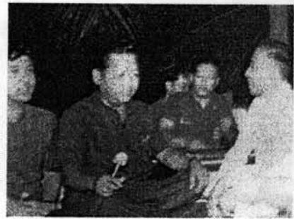
รูปที่ 17 ภาพขณะบรรเลงดนตรีกับเพื่อน