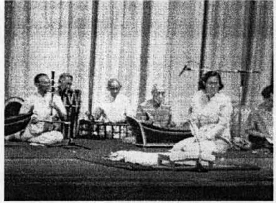
รูปที่ 18 ภาพการแสดงผลงานเดี่ยวซอด้วง หน้าพระที่นั่ง วันศิลปินแห่งชาติ 24 กุมภาพันธ์ 2533