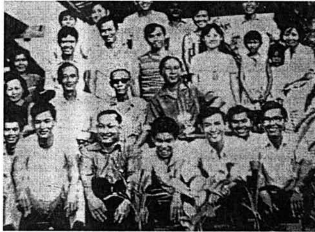
รูปที่ 7 ภาพครูหลวงไพเราะเสียงซอถ่ายรูปร่วมกับศิษย์ธรรมศาสตร์ พ.ศ. 2514

มีผู้กล่าวไว้ว่า “ ทางซอของพ่อหลวง ถือว่าเป็นทางซอที่ครองศิลปะสยามสังคม ” 16 ผู้วิจัยก็เห็นด้วยจากคำกล่าวข้างต้น เพราะทางซอของครูหลวงไพเราะนั้นไพเราะจับใจเมื่อได้ฟัง มีลีลาอันแสน อ่อนหวานพลิ้วไหวเมื่อได้บรรเลง รวมทั้งบรรดาศิลปินต่าง ๆ ก็นำมาบรรเลงอยู่เสมอ จนเป็นที่รู้จักกันในวงการดนตรีว่า ทางซอของพ่อหลวงไม่เป็นรองใคร และไม่มีใครที่ไม่รู้จักหลวงไพเราะเสียงซอ จึงส่งผลให้บรรดานักดนตรี ครู อาจารย์ ศิลปินทั้งหลาย ยกย่องให้ท่านเป็น “ ศิลปินต้นแบบ ”