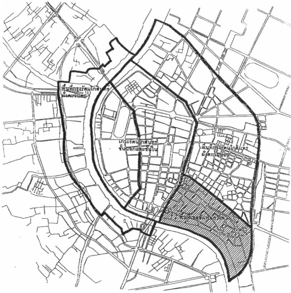
ภาพที่ 2.2 แสดงพื้นที่บริเวณย่านชุมชนเขตสัมพันธวงศ์