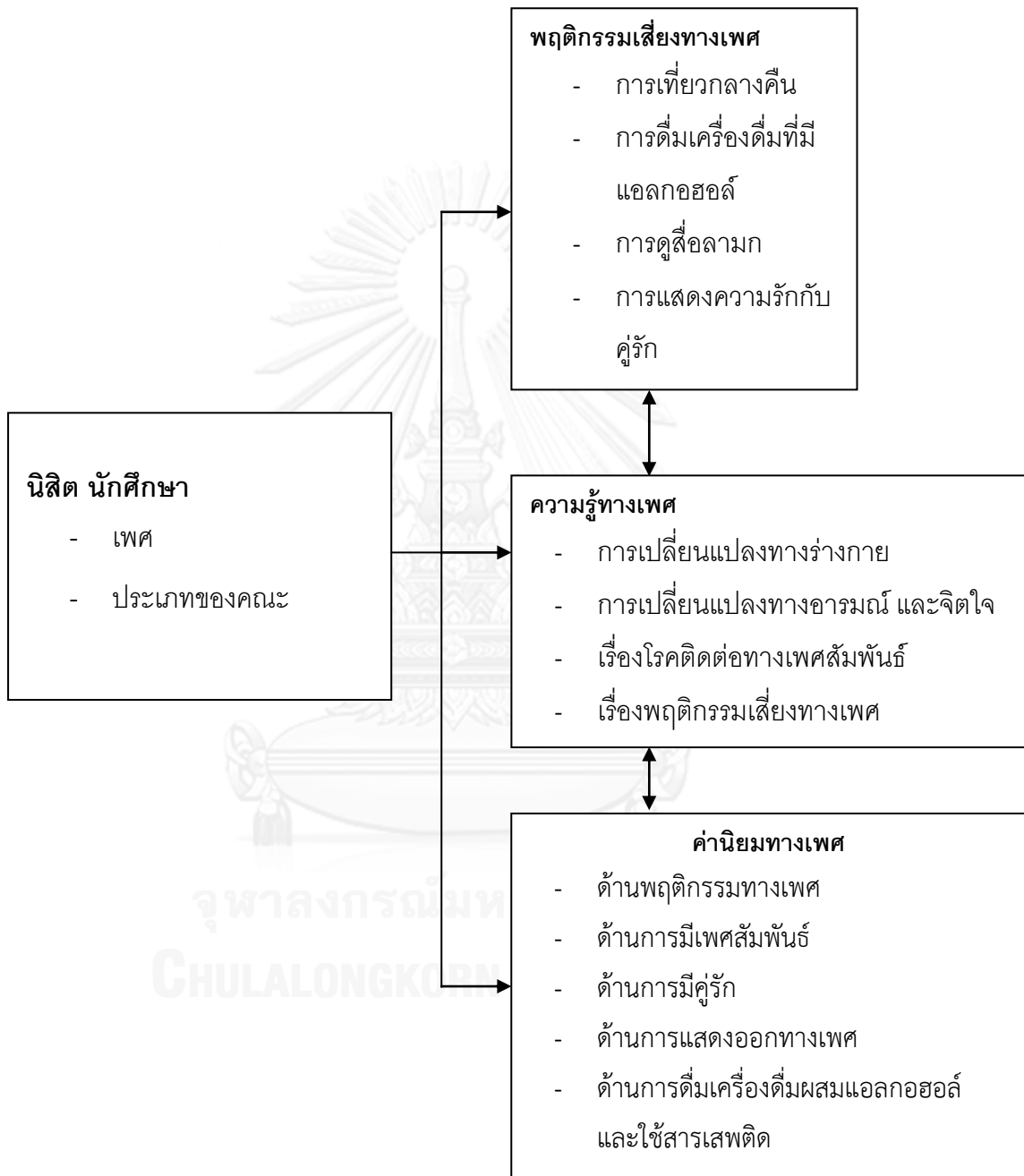
แผนภาพที่ 1 กรอบแนวคิดในการวิจัย