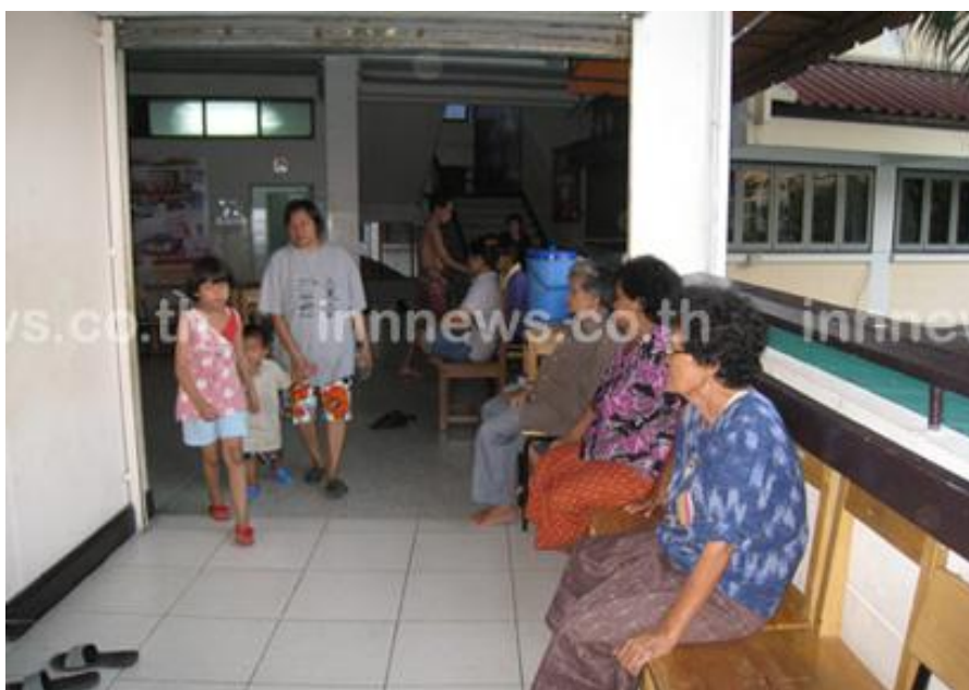
ภาพที่ 19 ศูนย์พักพิงผู้ประสบอุทกภัยที่โรงเรียนปากเกร็ด (ไอเอ็นเอ็น 27 ตุลาคม 2554)

เองทางเครือข่ายโรงเรียนที่กล่าวมาได้ให้ความอนุเคราะห์พื้นที่ ด้วยการให้ใช้อาคารโรงเรียนเป็น ศูนย์พักพิง โดยมีคณะครู อาจารย์ และอาสาสมัครต่างๆ เข้ามาทำอาหารและกิจกรรมนันทนาการ เพื่อเสริมสร้างสุขภาพกายและจิตที่ดีให้แก่ประชาชนที่ลี้ภัยมาจากน้ำท่วม เพื่อให้พวกเขาได้มีที่พักที่ปลอดภัยและมีสุขภาพจิตที่ดีขึ้น