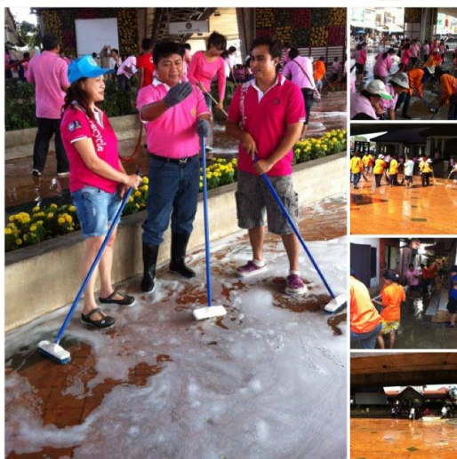
ภาพที่ 24 ภาคประชาสังคมในพื้นที่ร่วมกับเจ้าหน้าที่เทศบาลนครปากเกร็ด ออกทำความสะอาดพื้นที่หลังน้ำท่วม (เทศบาลนครปากเกร็ด 5 ธันวาคม 2554)

จากภาพข้างต้น สะท้อนให้เห็นถึงการมีส่วนร่วมและการทำหน้าที่ของภาคประชาสังคมในพื้นที่อย่างเต็มที่ ซึ่งไม่ใช่เรื่องง่ายและจำเป็นต้องใช้เวลานาน แต่ด้วยความมีจิตอาสาและการยึดผลประโยชน์ส่วนรวมเป็นที่ตั้งอย่างต่อเนื่องแม้กระทั่งน้ำจะลดลงไปแล้วก็ตาม ส่งผลให้ประชาชนในท้องถิ่นที่อดที่จะแสดงความรู้สึกชื่นชมนั้นออกมาไม่ได้