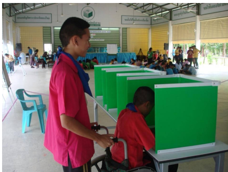
ภาพที่ 6 การเลือกตั้งคณะกรรมการสภาเด็กและเยาวชน เทศบาลนครปากเกร็ด ณ โรงเรียนศรีสังวาลย์ (เทศบาลนครปากเกร็ด 23 สิงหาคม 2556)

ทั้งเด็กและเยาวชนร่วมกิจกรรมและให้ความสนใจเป็นจำนวนมาก นอกจากนี้ เครือข่ายสภาเด็กและเยาวชน เทศบาลนครปากเกร็ด ยังถือเป็นแหล่งการเรียนรู้หลักการประชาธิปไตยที่สำคัญอีกด้วย เนื่องจากการฝึกให้เด็กและเยาวชนรับฟังความคิดเห็นกันในที่ประชุม ให้เข้ามามีส่วนรวมในกิจกรรมต่างๆ ทุกขั้นตอน และให้สิทธิและโอกาสเด็กและเยาวชนทุกคนอย่างเท่าเทียมกัน