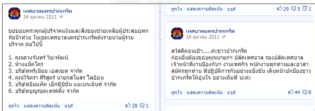
ภาพที่ 14 ภาพจาก Facebook เทศบาลนครปากเกร็ดกล่าวขอบคุณ

สำหรับในส่วนองงานที่เป็นลักษณะของการแจ้งเหตุ ในช่วงแรกพบกับปัญหาหรืออุปสรรค ที่สำคัญ คือ ปัญหาในการตัดสินใจดำเนินการ กล่าวคือ บางครั้งด้วยความที่เป็นสถานการณ์ฉุกเฉิน จึงไม่สามารถควบคุมปัจจัยต่างๆให้เกิดความแน่นอนได้ อีกทั้ง ยังจำเป็นต้องใช้การตัดสินใจที่เร่งด่วน เพราะฉะนั้น จึงทำเกิดบางกรณีที่เกิดพลาดขึ้น เช่น การหาวิธีการแจ้งเตือนประชาชนเรื่องภัยน้ำท่วม ด้วยการจุดพลุ 5 สี ที่ทางเทศบาลนครปากเกร็ดคิดขึ้น ท้ายที่สุดเมื่อนำมาหารือกับภาคประชาสังคม ในพื้นที่ พบว่า อาจไม่มีความเหมาะสม และมีความเสี่ยงสูงในการนำมาซึ่งความแตกตื่น เพราะการจุดพลุนั้นไม่สามารถแจ้งหรือบอกข่าวสารที่ละเอียดได้มากพอ ทางเทศบาลนครปากเกร็ด จึงออกมายอมรับว่าเป็นการตัดสินใจที่ผิดพลาดและได้หาทางแก้ไขโดยหันมาใช้วิธีการส่งข้อความ (SMS) แจ้งเตือนแทน ซึ่งผลที่ได้ก็ประสบความสำเร็จอยู่ในเกณฑ์ที่ดีมาก ภาคประชาสังคมในพื้นที่ก็ พอใจ ดังที่จะอธิบายอย่างละเอียดต่อไปนี้