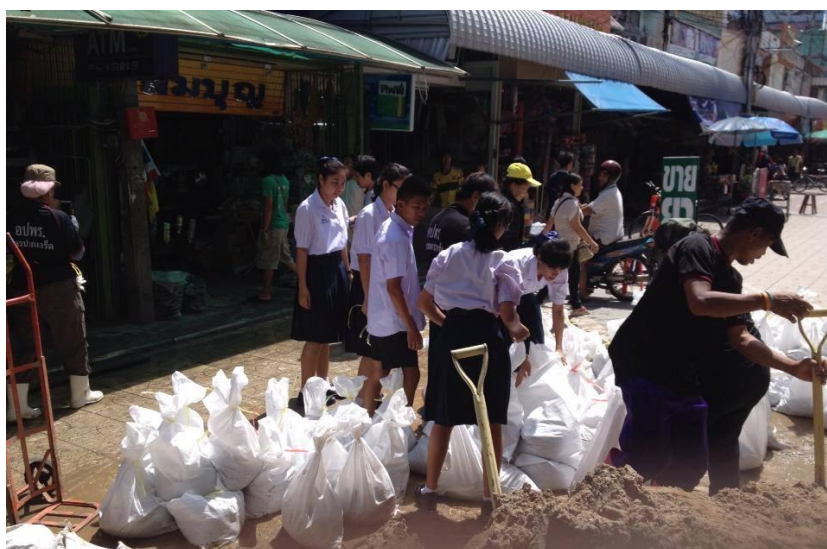
ภาพที่ 22 การทำงานร่วมกันของเครือข่ายเด็กและเยาวชน กับอาสาสมัครป้องกันภัยฝ่ายพลเรือน (อปพร.) ในพื้นที่เทศบาลนครปากเกร็ด (สากล 8 ตุลาคม 2556)

จะเห็นได้ว่า แม้พวกเขาเหล่านี้ยังเป็นเด็กและเยาวชนจึงอาจไม่สามารถช่วยในด้านของกำลังทรัพย์ได้ แต่พวกเขาก็สามารถช่วยกำลังแรงและกำลังใจได้ ซึ่งการช่วยเหลือของเด็กและเยาวชนกลุ่มนี้ ไม่ได้มีแค่ในช่วงน้ำท่วม พ.ศ. 2554 เท่านั้น แต่ยังมีสืบเนื่องถึงทุกวันนี้ กล่าวคือ เมื่อภัยมาเยือนท้องถิ่น พวกเขาเหล่านี้ก็พร้อมที่จะมาช่วยเหลือนด้วยจิตอาสา