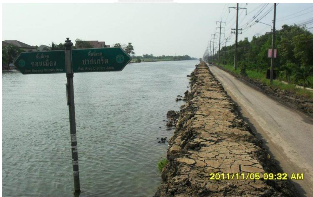
ภาพที่ 29 คันกันน้ำริมคลองประปาในเขตพื้นที่ปากเกร็ด

สถานการณ์ที่ 3 น้ำล้นทะเลจากคลองประปา สำหรับในส่วนของแนวคลองประปานั้น ทางเทศบาลนครปากเกร็ดไม่ได้กั้นอะไรเลย เนื่องจากทางเทศบาลนครปากเกร็ดไม่คาดคิดว่าการประปานครหลวงนั้นจะยอมปล่อยให้ น้ำล้นทะเลลักเข้ามาในคลอง เพราะน้ำในคลองนี้ถูกใช้ในการอุปโภคและบริโภคของประชาชน แต่ผลปรากฏว่าไม่เป็นไปตามนั้น เนื่องจากน้ำได้ล้นทะเลลักเข้ามาตรงรอยต่อของคลองประปาในช่วงตั้งแต่รังสิตเรื่อยมาจนถึงคลองประปา ดังนั้น วิธีการที่ทางภาคประชาสังคมในพื้นที่เทศบาลนครปากเกร็ดจะทำได้ คือ การป้องกัน ด้วยเหตุนี้ จึงเกิดความพยายามสร้างแนวคันดินกันน้ำขึ้น เพื่อไม่ให้น้ำไหลทะเลลักเข้ามา และไหลไปตามแนวน้ำไหลของคลองประปา ซึ่งพอกัน น้ำก็ไม่สามารถไหลเข้ามาที่อำเภopakเกร็ดได้ แต่ไม่ได้หมายความว่าน้ำนั้นจะตีกลับไปยังทางฝั่งดอนเมือง เพราะจากสถานการณ์จริงๆ นั้นน้ำได้ไหลไปทางดอนเมืองอยู่แล้ว แม้น้ำจะมาทางนี้เพิ่มขึ้นก็ไม่ได้ช่วยทำให้ระดับน้ำในดอนเมืองลดลง และตามทิศทางน้ำ น้ำจะไหลตามทางน้ำมากกว่าที่จะไหลเข้าทั้งทางดอนเมืองและทางปากเกร็ด