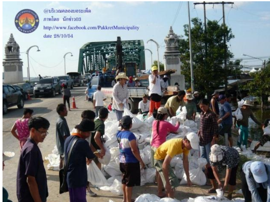
ภาพที่ 27 ประชาสังคมนตรีในพื้นที่ร่วมกันแก้ไขและป้องกันน้ำท่วม (กลางวัน) (เทศบาลนครปากเกร็ด 28 ตุลาคม 2554)