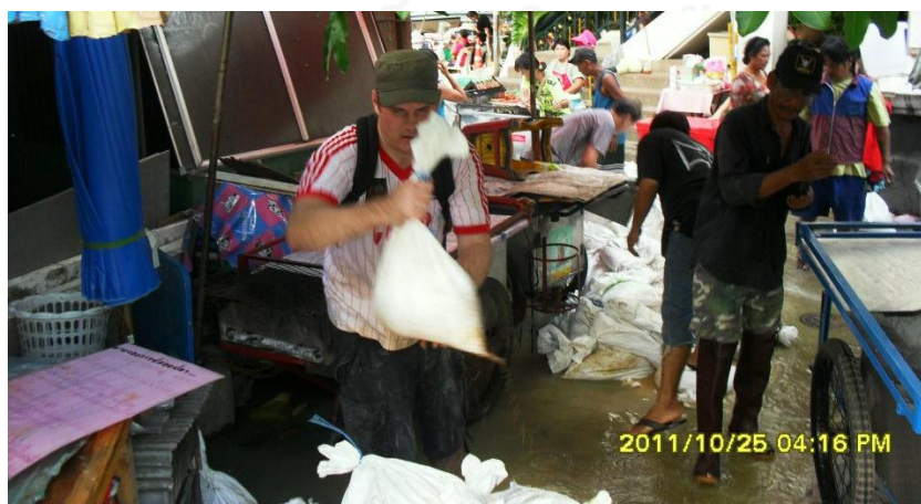
ภาพที่ 17 ชาวต่างชาติมาช่วยวางแนวกระสอบทรายกั้นน้ำบริเวณทำน้ำปากเกร็ด (งานป้องกันและบรรเทาสาธารณภัย เทศบาลนครปากเกร็ด 12 พฤศจิกายน 2554)