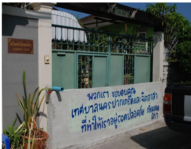
ภาพที่ 23 การแสดงความขอบคุณภาคประชาสังคมในพื้นที่ลงบนกำแพงกั้นน้ำหน้าบ้าน (เพชรดา เวชศรี 16 พฤศจิกายน 2554)

จากภาพข้างต้น สะท้อนให้เห็นถึงการมีส่วนร่วมและการทำหน้าที่ของภาคประชาสังคมในพื้นที่อย่างเต็มที่ ซึ่งไม่ใช่เรื่องง่ายและจำเป็นต้องใช้เวลานาน แต่ด้วยความมีจิตอาสาและการยึดผลประโยชน์ส่วนรวมเป็นที่ตั้งอย่างต่อเนื่องแม้กระทั่งน้ำจะลดลงไปแล้วก็ตาม ส่งผลให้ประชาชนในท้องถิ่นที่อดที่จะแสดงความรู้สึกชื่นชมนั้นออกมาไม่ได้