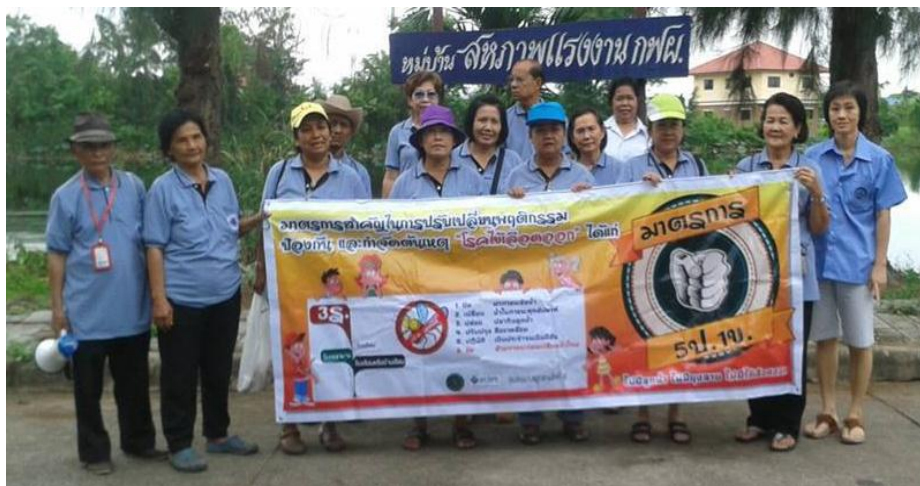
ภาพที่ 4 อาสาสมัครสาธารณสุขประจำหมู่บ้าน (อสม.) ชุมชนบางพุดสามัคคี 9 ลงพื้นที่รณรงค์ โรคไข้เลือดออก ณ หมู่บ้านสหภาพแรงงานการไฟฟ้าฝ่ายผลิตแห่งประเทศไทย (กฟผ.) (Sirat Yeerunsiri 2556)

สรุปได้ว่า หากอาสาสมัครสาธารณสุขประจำหมู่บ้าน (อสม.) ในพื้นที่ที่มีความเข้มแข็ง และมีการดำเนินงานอย่างมีประสิทธิภาพ ก็จะสามารถพัฒนาไปสู่การมีความยืดหยุ่นในการบริหารจัดการได้ กล่าวคือ สามารถปรับเปลี่ยนบทบาทหน้าที่ของตนจากการตั้งรับในพื้นที่มาเป็นหน่วยเคลื่อนที่เร็วหรือปฏิบัติการในเชิงรุกมากขึ้น และการไม่ยึดติดกับเครือข่าย สามารถทำงานร่วมกันข้ามเครือข่ายได้ก็จะนำมาสู่ความรวดเร็วในการปฏิบัติการ ยิ่งไปกว่านั้น การเน้นผลการดำเนินงานที่มีประสิทธิผล คือ ทำได้จริง เห็นเป็นรูปธรรม ก็จะนำมาซึ่งความสำเร็จในการแก้ปัญหา ส่งผลให้เกิดความต้องการเข้าร่วมเป็นสมาชิกมากขึ้น อันจะส่งผลดีต่อเครือข่าย โดยจะทำให้เครือข่ายมีพลังและสติปัญญาเพิ่มมากขึ้นในการบริหารงาน การต่อรอง และการแก้ไขจัดการปัญหาต่างๆ ตามไปด้วย