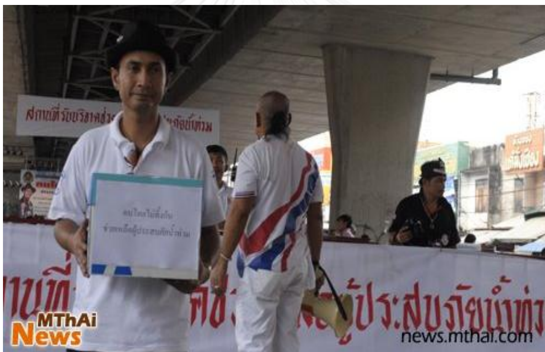
ภาพที่ 20 การขอรับบริจาคสิ่งของหรือทรัพย์สินเพื่อนำไปช่วยเหลือผู้ประสบภัยน้ำท่วม บริเวณใต้สะพานพระราม 4 อำเภอปากเกร็ด จังหวัดนนทบุรี

สำหรับภารกิจนี้ เครือข่ายภาคประชาสังคมในพื้นที่และจิตอาสาจะทำงานร่วมกับ กองสวัสดิการสังคม เทศบาลนครปากเกร็ด เพื่อดึงชุมชน วัด และประชาชน เข้ามามีส่วนร่วม ในการเป็นอาสาสมัครหรือเครือข่ายภาคประชาสังคมในการแก้ไขปัญหาน้ำท่วม กล่าวคือ เมื่อเกิด วิกฤตการณ์ที่สำคัญ เครือข่ายจิตอาสาต้องพร้อมที่จะปรับบทบาทหน้าที่เพื่อเข้ามามีส่วนร่วม ในการแก้ปัญหา เช่น กรณีของน้ำท่วม พ.ศ. 2554 เครือข่ายจิตอาสาในชุมชนถือว่าเป็นกลุ่มที่มี บทบาทสำคัญที่สุดในการปกป้อง ดูแล และแก้ไขปัญหาในชุมชนตนเอง โดยใช้วิธีการปรึกษาหารือ หาแนวทางการแก้ไขปัญหา ร่วมกันลงมือปฏิบัติ ทั้งลงแรงกรอกกระสอบทราย ทำคันกันน้ำ วิดน้ำ ฯลฯ ร่วมลงใจช่วยกัน สอบถามสารทุกข์ซึ่งกันและกัน มีน้ำในต่อกัน และร่วมลงเงินร่วมกันบริจาค ทรัพย์สินและสิ่งของให้แก่กัน เพื่อผลสุดท้ายคือความอยู่รอดของชุมชนตนและส่วนรวม