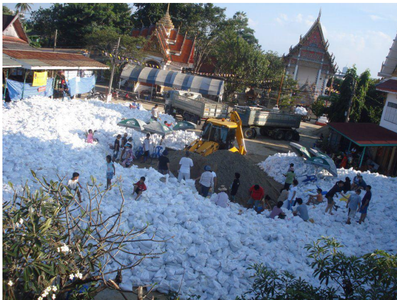
ภาพที่ 15 กระสอบทรายที่นำมาใช้ในพื้นที่เทศบาลนครปากเกร็ด

(งานป้องกันและบรรเทาสาธารณภัย เทศบาลนครปากเกร็ด 1 พฤศจิกายน 2554)