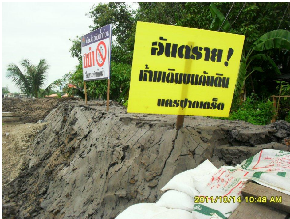
ภาพที่ 13 แผ่นป้ายเตือนภัยและขอความร่วมมือเพื่อป้องกันคันดิน (งานป้องกันและบรรเทาสาธารณภัย เทศบาลนครปากเกร็ด 14 ตุลาคม 2554)

ยิ่งไปกว่านั้น ทางภาคประชาสังคมในพื้นที่ซึ่งได้พยายามใช้ทุกอุปกรณ์ที่เป็นอุปกรณ์รับข้อมูลข่าวสารได้ เช่น วิทยุ โทรทัศน์ และอินเทอร์เน็ต ในการรับข้อมูลข่าวสาร และเมื่อรายการต่างๆ รายงานอะไรก็ตามที่เกี่ยวข้องกับเทศบาลนครปากเกร็ด ทางภาคประชาสังคมในพื้นที่ก็จะพยายามรับข้อมูลข่าวสารอย่างมีวิจารณญาณ ส่วนทางเทศบาลนครปากเกร็ดก็ต้องเตรียมตรวจสอบข้อมูลว่าที่สื่อและข่าวต่างๆ นำเสนอออกไปนั้นเป็นความจริงหรือไม่ ซึ่งในจุดนี้เครือข่ายภาคประชาสังคมในพื้นที่ร่วมกับทางเทศบาลนครปากเกร็ดจะต้องไปตรวจสอบสถานการณ์ตามข่าวที่นำเสนอ ณ พื้นที่จริง โดยจะมีการตรวจสอบไปยังที่ศูนย์ประชาสัมพันธ์ใหญ่ที่มีภาคประชาสังคมในพื้นที่คอยเฝ้าระวังสถานการณ์ร่วมกับทางเทศบาลนครปากเกร็ดและศูนย์ประชาสัมพันธ์ย่อยซึ่งจะมีหัวหน้าเฉพาะคอยทำหน้าที่บัญชาการอยู่ตามวัดต่างๆ เพื่อให้ศูนย์เหล่านี้รายงานสถานการณ์จริงกลับมา และนำข้อมูลนี้กลับไปบอกกับประชาชนอีกทอดหนึ่ง ซึ่งศูนย์ประชาสัมพันธ์ย่อยจะมี 3 จุด คือ วัดหงส์ทอง วัดสนามเหนือ และวัดช่องลม นอกจากนี้ ทางภาคประชาสังคมก็จะใช้เทคโนโลยีสมัยใหม่ เช่น โทรศัพท์มือถือ กล้องถ่ายรูป เครื่องบันทึกวีดีโอ ฯลฯ ถ่ายรูปและบันทึกวีดีโอสถานการณ์จริง และทำการลงข้อมูลในเครือข่ายทางสังคมออนไลน์หรือส่งต่อข้อมูลทางโปรแกรมสนทนาต่างๆ เพื่อส่งข่าวให้ประชาชนได้ทราบโดยทั่วกัน นอกจากนี้ ทางเทศบาลนครปากเกร็ดเองก็จะส่งเจ้าหน้าที่