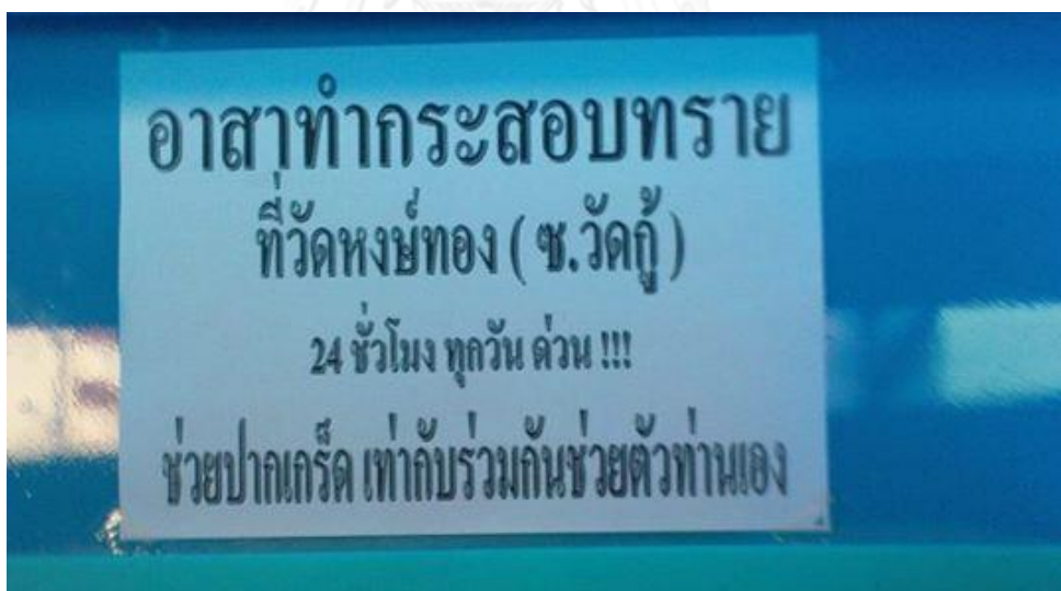
ภาพที่ 12 แผ่นป้ายประชาสัมพันธ์เพื่อหาอาสาสมัครรอกกระสอบทราย (งานป้องกันและบรรเทาสาธารณภัย เทศบาลนครปากเกร็ด 3 พฤศจิกายน 2554)