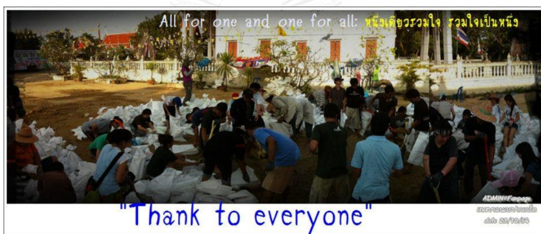
ภาพที่ 16 อาสาสมัครในพื้นที่เทศบาลนครปากเกร็ดกำลังช่วยกันกรอกกระสอบทราย (เทศบาลนครปากเกร็ด 2554)