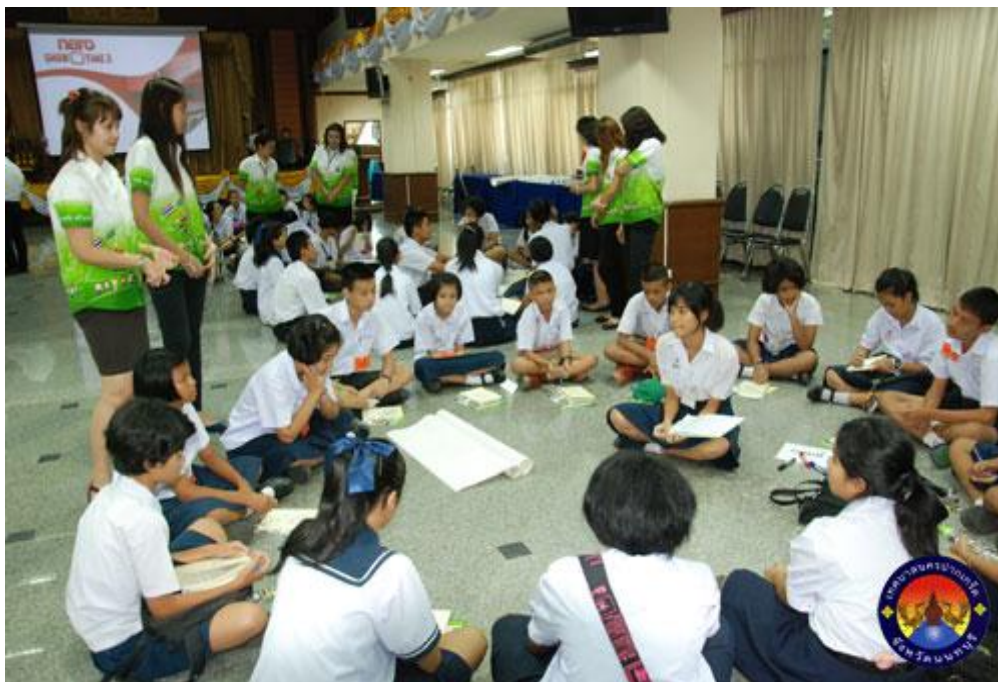
ภาพที่ 7 การจัดการประชุมสภาเด็กและเยาวชน

ที่ได้รับอิทธิพลมาจากรัฐธรรมนูญแห่งราชอาณาจักรไทย พุทธศักราช 2540 ที่เน้นการมีส่วนร่วมของประชาชน อีกด้วย (เทศบาลนครปากเกร็ด. 29 กรกฎาคม 2554)