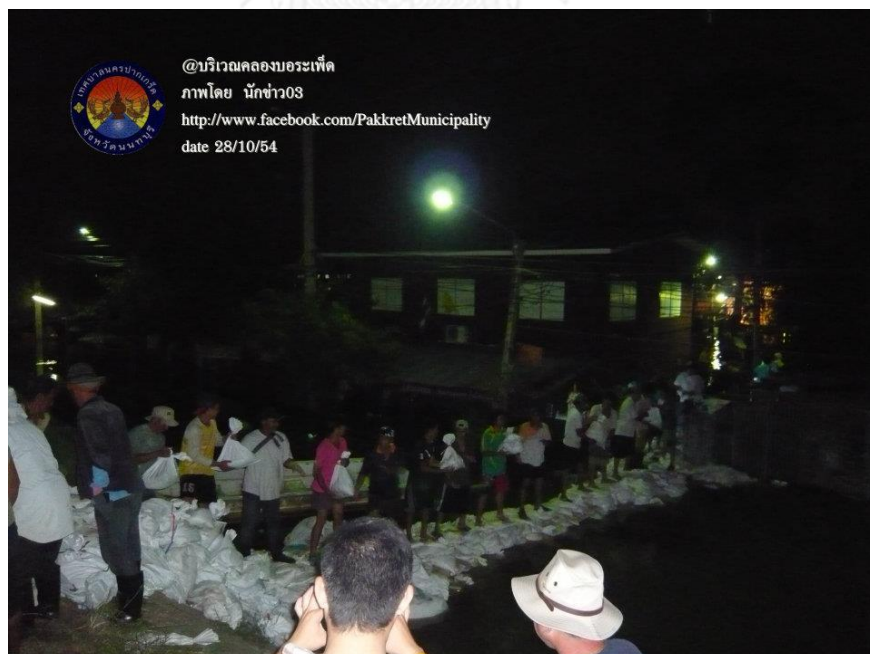
ภาพที่ 28 ประชาสังคมนตรีในพื้นที่ร่วมกันแก้ไขและป้องกันน้ำท่วม (กลางคืน) (เทศบาลนครปากเกร็ด 28 ตุลาคม 2554)