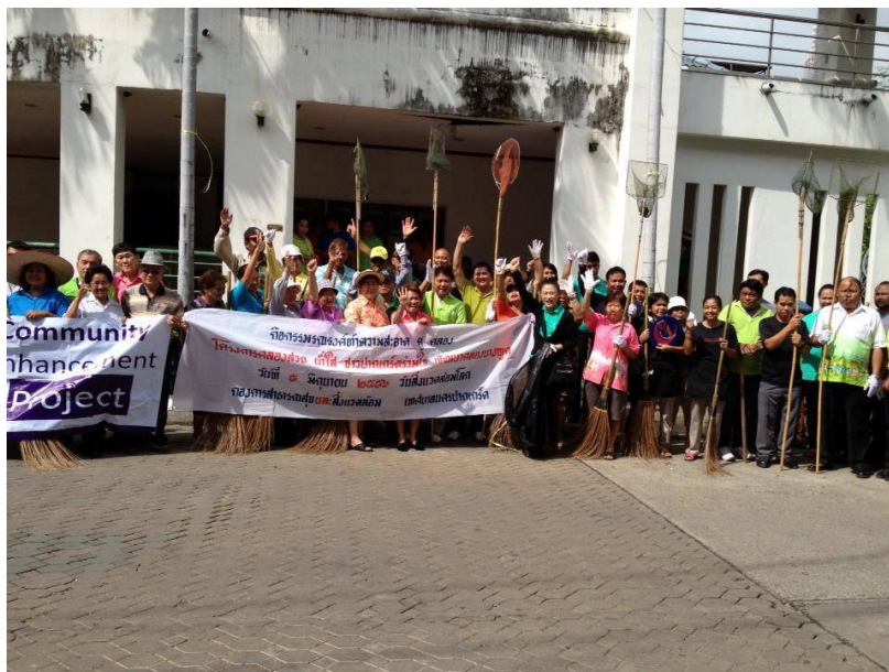
ภาพที่ 2 กิจกรรมการทำความสะอาดคูคลองในพื้นที่เทศบาลนครปากเกร็ด (เทศบาลนครปากเกร็ด 5 มิถุนายน 2556)

จากภาพเป็นกิจกรรมการทำความสะอาดคูคลองในพื้นที่เทศบาลนครปากเกร็ด เมื่อวันที่ 1 มิถุนายน พ.ศ. 2556 ที่ได้รับความร่วมมือจากประชาชนในชุมชนต่างๆ ในพื้นที่ และเจ้าหน้าที่รัฐ นำโดยกองสาธารณสุขและสิ่งแวดล้อม เทศบาลนครปากเกร็ด อันแสดงให้เห็นว่าภาคประชาสังคมในท้องถิ่นที่มีความเข้มแข็งเป็นอย่างมาก และมีความร่วมมือกันอย่างต่อเนื่องยาวนาน ไม่เพียงแต่จะเข้ามามีส่วนร่วมเฉพาะเวลาที่เกิดปัญหาในท้องถิ่นเท่านั้น หากแต่เป็นเรื่องที่สร้างประโยชน์ให้แก่ส่วนรวมในท้องถิ่นพวกเขาก็พร้อมที่จะให้ความร่วมมือเสมอ จนสามารถสร้างเครือข่ายที่มีจิตสาธารณะเป็นที่ตั้งได้เป็นผลสำเร็จ