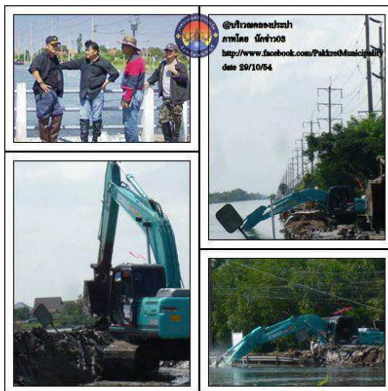
ภาพที่ 30 การทำแนวคันดินกั้นน้ำบริเวณริมคลองประปา