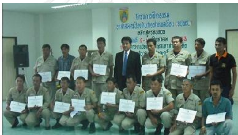
ภาพที่ 3 โครงการฝึกอบรมอาสาสมัครป้องกันภัยฝ่ายพลเรือน (อปพร.) (สำนักงาน ปก. จังหวัดนนทบุรี 26 มิถุนายน 2554)