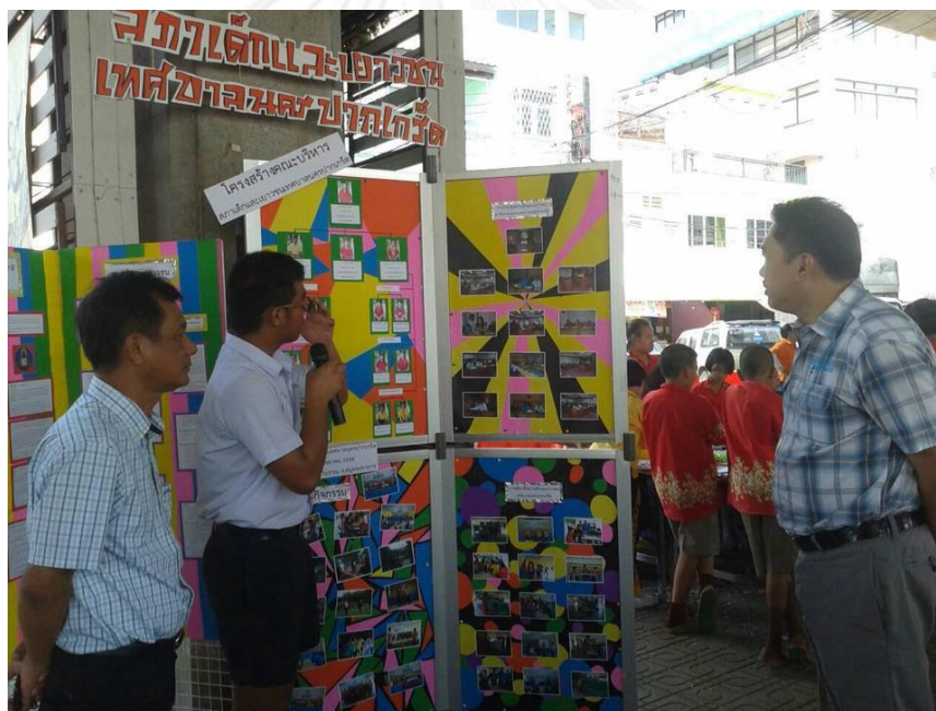
ภาพที่ 5 สภาเด็กและเยาวชน เทศบาลนครปากเกร็ด กับการจัดโครงการถนนเด็กเดิน

นอกจากนี้ ยังมีบทบาทของสภาเด็กและเยาวชนในพื้นที่อำเภอปากเกร็ดด้วย ซึ่งบทบาทหน้าที่จะเป็นไปตามมาตรา 24 เป็นหลัก แต่จะมีการเพิ่มเติมด้านการมีส่วนร่วมของเด็กและเยาวชนในการปกครองระบอบประชาธิปไตย การบริหารงานขององค์กรปกครองส่วนท้องถิ่น และการจัดการปัญหาสาธารณะที่เกิดขึ้นในท้องถิ่นด้วย ทั้งนี้ เพื่อให้เด็กและเยาวชนทราบถึงการดำเนินงานของภาคส่วนต่างๆ นำไปสู่การสร้างความรู้ความเข้าใจและจิตสำนึกรักในท้องถิ่น อันจะเป็นการกระตุ้นให้เกิดจิตอาสา และพัฒนามาเป็นเครือข่ายเด็กและเยาวชนอันเป็นส่วนหนึ่งของภาคประชาสังคมที่เข้มแข็งในพื้นที่ได้ในที่สุด ตัวอย่างการดำเนินงานของสภาเด็กและเยาวชนในพื้นที่อำเภอปากเกร็ดจะพบว่า เป็นการดำเนินงานร่วมกันระหว่างเด็กและเยาวชนในพื้นที่ร่วมกับองค์กรปกครองส่วนท้องถิ่น ซึ่งก็คือ เทศบาลนครปากเกร็ด