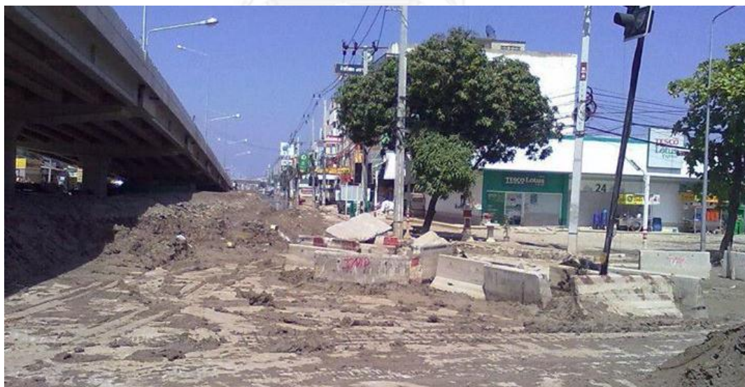
ภาพที่ 26 การช่วยเหลือกันของภาคประชาสังคมในพื้นที่และเทศบาลนครปากเกร็ด ทำให้น้ำแห้งลงอย่างรวดเร็ว (งานป้องกันและบรรเทาสาธารณภัย เทศบาลนครปากเกร็ด 26 ตุลาคม 2554)