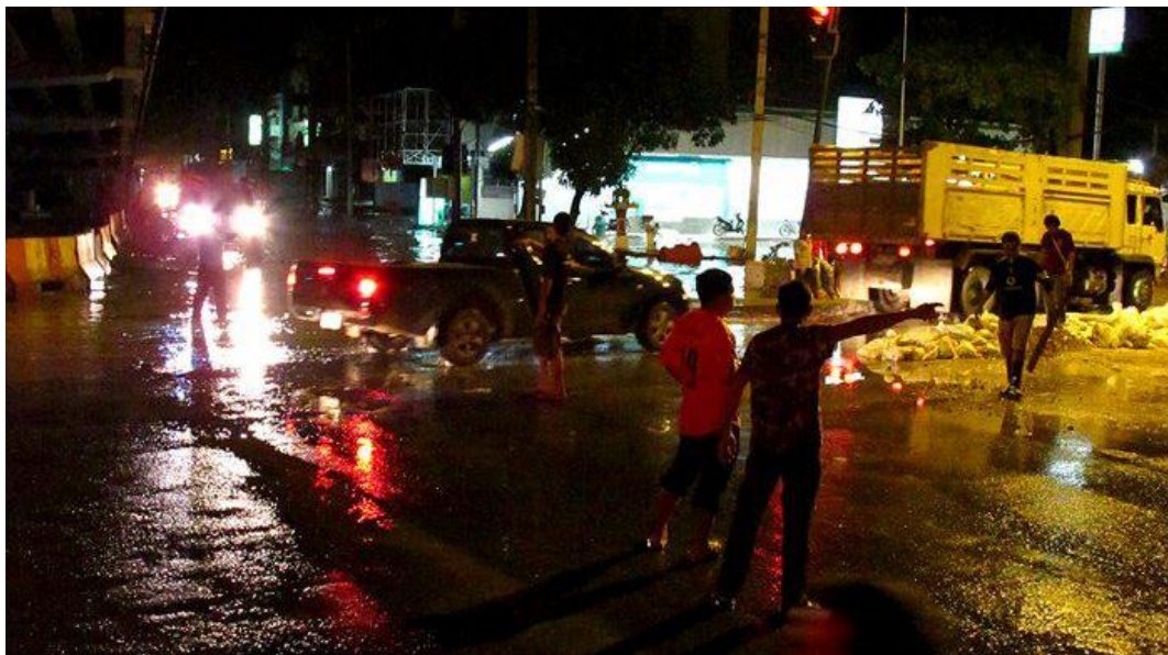
ภาพที่ 25 น้ำจากบริเวณสะพานนนทบุรีและโรงงานน้ำมันทิฟไหลเข้าสู่ แยกสวนสมเด็จพระศรีนครินทร์ (งานป้องกันและบรรเทาสาธารณภัย เทศบาลนครปากเกร็ด 26 ตุลาคม 2554)