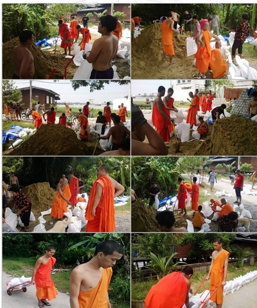
ภาพที่ 9 พระ สามเณร และชาวบ้านวัดหงส์ทองร่วมมือกันกรอกกระสอบทราย เพื่อเตรียมความพร้อมป้องกันน้ำท่วมในปี 2556

อย่างยิ่งที่เครือข่ายวัดและประชาชนในพื้นที่จะต้องให้ความร่วมมือกัน โดยวัดบางวัดนั้นอาจจะต้องเสียสละพื้นที่ของตนให้น้ำท่วมเพื่อป้องกันน้ำไหลเข้าสู่ชุมชนบริเวณใกล้เคียงกับวัด เช่น วัดกู่ บางวัดอาจจะต้องเสียสละกำลังร่างกายและทรัพยากรในวัดเพื่อช่วยเหลือคนในชุมชน เช่น วัดช่องลม ที่พระ สามเณร และผู้อาศัยวัดต้องออกมาร่วมมือกันลงแรงทำคันดินป้องกันน้ำท่วม และนำของที่ได้รับการบริจาคหรือใส่บาตรมาแจกจ่ายให้แก่ภาคประชาสังคมในพื้นที่และพื้นที่ใกล้เคียงที่ได้รับ ความเดือดร้อน เป็นต้น และบางวัดอาจออกมาช่วยเหลือวัดและชุมชนอื่นๆ เนื่องจากเห็นว่าชุมชนของตนมีความพร้อมมากกว่า วัดจึงทำหน้าที่เป็นเสมือนศูนย์กลางในการระดมทรัพยากรไปช่วยเหลือวัดและชุมชนอื่นๆ ที่มีการเสี่ยงภัยมากกว่า