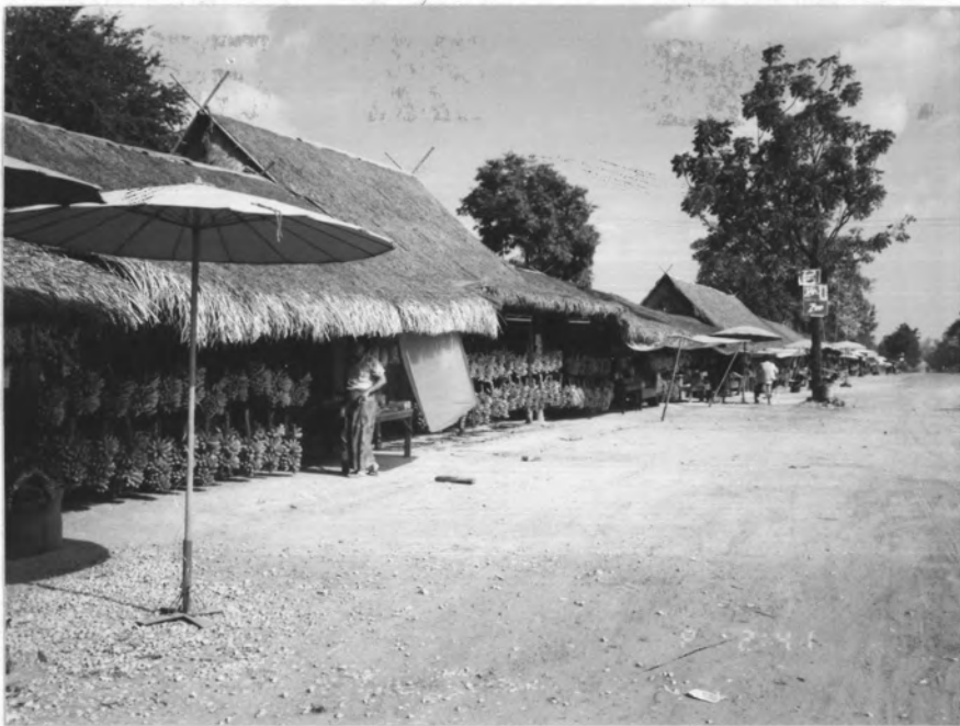
ภาพที่ 3.1 สภาตลาดกลางขายปลีบ้านปากอ่าง อำเภอเมือง จังหวัดกำแพงเพชร