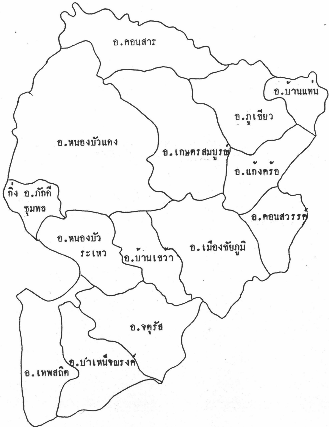
รูปที่ 1 แผนที่แสดงการแบ่งเขตอำเภอและกิ่งอำเภอของจังหวัดชัยภูมิ