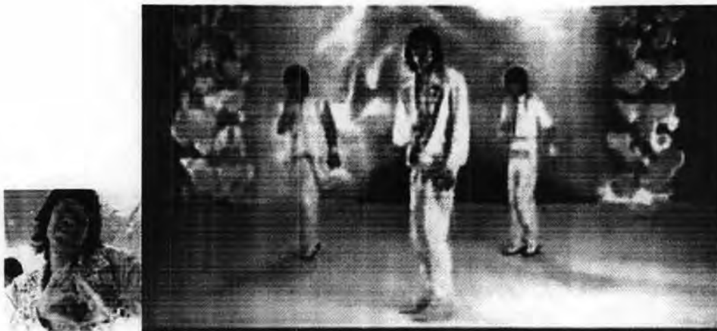
(รูป จ โฆษณาที่มีการล้อเลียน บี เดอะ สตาร์ 29 )