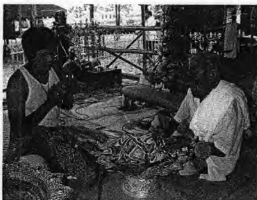
รูปที่ 49. ศิลปินโนราเข้าพิธีสวดเครื่องและสวดกำไร

มาจากไม้แตรที่ทำจากไม้ไผ่นำมาผ่าครึ่งซีก ปัจจุบันอาจเป็นเพียงการสวมกำไรให้เลยก็ได้ จากนั้นต่อด้วยการตัดจุก อาจทำโดยครูโนราหรือตายายโนราในร่างทรงก็ได้ ด้วยการตัดผมของผู้เข้าพิธีด้วยกริชพอเป็นพิธี เพื่อแสดงว่าได้เป็นผู้ใหญ่แล้วเพราะผู้ที่เข้าพิธีสวดเครื่องสวดกำไรและมักมีคุณสมบัติเหมาะสมที่จะสามารถเข้าพิธีครอบเทริดเป็นโนราใหญ่ได้เช่นกัน ดังนั้นในบางครั้งจึงเห็นว่ามีกรประกอบพิธีนี้ในวันเดียวกันกับพิธีครอบเทริด