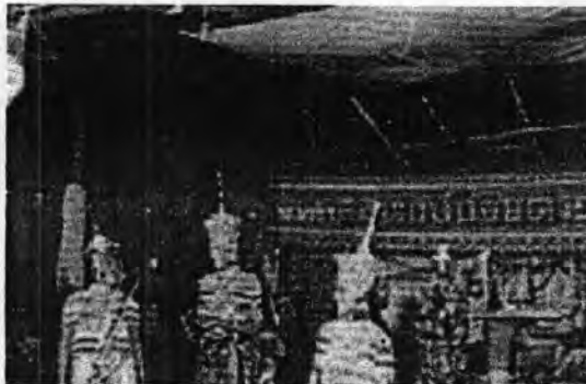
รูปที่ 59. พิธีโนราโรงครูท่าแค โดยคณะ สมพงษ์น้อย ดาวรุ่ง

โนราโรงครูหัตถ์ถ้อยรามหรือวัดแค ตำบลท่าแค จังหวัดพัทลุง เริ่มจัดมาตั้งแต่ปี พ.ศ. 2514 เมื่อพระเจ้าวรวงศ์เธอพระองค์เจ้าเฉลิมพลทิฆัมพรทรงสร้างรูปปั้นขุนศรีศรัทธาและพราณบุญขึ้นเพื่อเป็นที่เคารพบูชาของศิลปินโนราและชาวบ้านทั่วไป บวกกับความเชื่อเรื่องโนราที่มีอยู่แล้วจึงจัดให้มีโนราโรงครูขึ้น (พิทยา บุขรรัตน์, 2537: 142) มีความมุ่งหมายในการจัดเพื่อให้ครูหมอนโนรา หรือตายายโนราทั้งหมดมาร่วมชุมนุมกันโดยไม่มีข้อจำกัดเรื่องสายตระกูลมาเป็นตัวกำหนด เพราะชาวบ้านเชื่อว่า บ้านท่าแคเป็นแหล่งกำเนิดโนรา และเป็นแหล่งสถิตหรือพำนักของครูโนรา เชื่อมโยงมากับตำนานโนราในอดีตที่ว่าเมื่อขุนศรีศรัทธาได้รับยศจากพระยาสาयฟ้าพาดก็มาตั้งโรงโนราฝึกหัดคนอื่นให้รำโนรา ณ ที่แห่งนี้ และยังเชื่อว่าเป็นพื้นที่ซึ่งฝังกระดูกของท่านไว้หลังจากที่เสียชีวิตลงแล้ว มีการประดับประดับบริเวณพิธี ด้วยธงชาติและพระบรมฉายาลักษณ์ของพระบาทสมเด็จพระเจ้าอยู่หัว อันส่งผลต่อจิตใจของผู้มาร่วมพิธีกรรมในทางความเชื่อ ความขลังและศักดิ์สิทธิ์มากยิ่งขึ้นโดยพิธีโนราโรงครูท่าแคมีลำดับขั้นตอนและสัญลักษณ์ในพิธีกรรม มีดังนี้