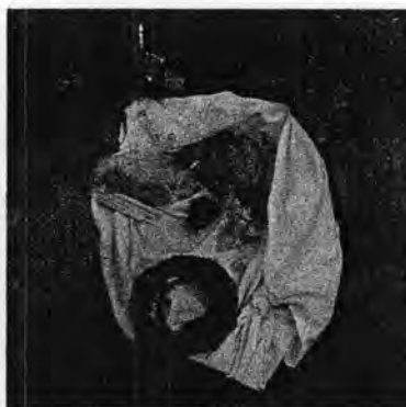
รูปที่ 52. ข้าวของในห่อผ้าของนายพรานตอนแสดงบทคล้องหงส์

การรำแทงเซ่ (จระเซ่) โดยจะรำหลังจาก คล้องหงส์แล้ว นับวันการรำชนิดนี้จะหาดูได้ยากและจะมีเฉพาะในการประกอบพิธีโนราโรงครูเท่านั้น ซึ่งจะมีเรื่องของพิธีกรรมและความศักดิ์สิทธิ์เข้ามาเกี่ยวข้อง มีผู้รำ 8 คน โนราใหญ่จะรำเป็น “นายไกร” ที่เหลืออีก 6 คน เป็นสหายของนายไกร และมีผู้รับบทชาละวันอีก 1 คน ก่อนการแสดงหัวหน้าคณะก็จะว่าคาถาให้สมาธิกับโนราคนอื่นๆ เพื่อเป็นการป้องกันตัว เพราะเชื่อกันว่าคนที่จะทำตัวจระเซ่นั้นจะต้องเป็นผู้มีความรู้ทางเวทย์มนตร์คาถา เพราะหลังจากทำตัวจระเซ่เสร็จแล้วจะต้องทำพิธีบรรจุธาตุ เรียกวิญญาณไปใส่ เบิกหูเบิกตาเรียกเจตภูติไปใส่ หากทำไม่ถูกต้อง ก็อาจเป็นเสนียดจัญไรแก่ตนเองได้ ก่อนทำพิธีจะต้องมีการสังเวยครูด้วยหมากพลู ดอกไม้ ธูปเทียน และเหล้าขาว (ประเสริฐ รักรวงษ์, สัมภาษณ์ : 6 เมษายน 2550)