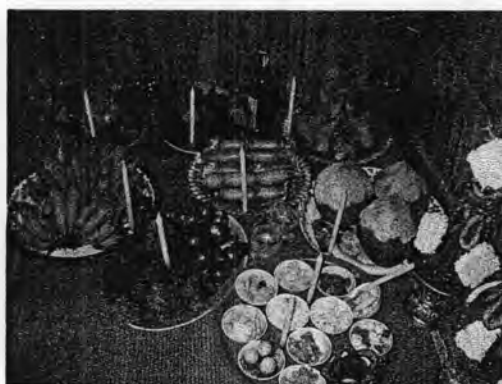
รูปที่ 40. เครื่องเซ่นไหว้บนพาไล

เครื่องเซ่นไหว้บนพาไล ประกอบด้วย กล้วย 3 หวี อ้อย 3 ท่อน มะพร้าวอ่อน 3 ลูก ขนมในพิธีวันสารทเดือนสิบ จำนวน 3 สำรับ (ประกอบด้วย ขนมพองแทนแพใช้เป็นพาหนะ, ขนมลาแทนเครื่องนุ่งห่ม, ขนมเบ้าแทนเงิน, ขนมไข่ปลาแทนเครื่องประดับ, เป็นต้น ทำนองเดียวกับการเผาเสื้อผ้า เงินกระดาษ หรือบ้านและรถให้บรรพบุรุษในธรรมเนียมคนไทยเชื้อสายจีน) นำข้าวสารหมากพลู เทียน และด้ายดิบจัดลงในภาชนะที่สานด้วยกระจูดหรือเตยขนาดเล็กเรียกว่า "สอบราด" 3 สำรับ เครื่องควาวหวาน 12 ชนิดหรือเรียกว่าที่สิบสอง (ได้แก่ ข้าว แกง ผลามี่หัวมีหาง ขนมขาว ขนมแดง ผลไม้ เป็นต้น) แล้วปักเทียนเอาไว้ทุกอย่าง