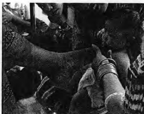
รูปที่ 51. พิธีเหยียบเสน

อยู่เสมอ ปัจจุบันก็ยังมิให้เห็นอยู่ โดยของที่ต้องเตรียมได้แก่ ถาดใส่น้ำ หมากพลู ฐูปเทียน ดอกไม้ มีดโกน หินลับมีด เงินเหรียญ เครื่องทอง เครื่องเงิน หล้าคา หล้าขีดหมอน รวงข้าว โดยโนราผู้ทำพิธีจะเอาน้ำใส่ถาด แล้วนำอุปกรณ์ทุกอย่างใส่ไว้รวมกัน เริ่มด้วยการจุดฐูปเทียน กล่าวคำชุมนุมเทวดา ชุมนุมครูโนรา ลงอักขระหัวแม่เท้าของโนราใหญ่ รำท่าเขียนพราย เอาหัวแม่เท้าไปแตะที่เป็นเสน ขณะที่เหยียบจะภาวนาคาถาไปด้วย ซึ่งโนราใหญ่แต่ละคนก็มีคาถาที่แตกต่างกันไป เช่นของชุนอุปถัมภ์รกรามีว่า “นะสุญ โมสุญ พุทธสุญ ธาสุญ ยะสุญ อุบาทว์ธรรมโมสุญด้วยนะโมพุทธายะ” (อุดม นนุทอง, 2547: 8680) แล้วเขาไปจุ่มน้ำในถาด ยกมารวมควันเทียน แล้วเหยียบเบาๆ ที่เป็นเสน โดยหันหลังให้ แล้วครูหมอนโนราในร่างทรงก็จะนำกรีขและพระขรรค์ ไปแตะตรงที่เป็นเสนพร้อมด้วยการบริกรรมคาถา ทำอย่างนี้ 3 ครั้ง แล้วจึงนำอุปกรณ์ในถาดไปแตะที่เสนจนครบ เป็นอันเสร็จพิธี และเชื่อว่าหลังจากทำพิธีแล้วเสนจะค่อยๆ หลุดและหายไปในที่สุด