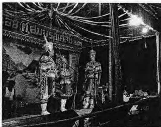
รูปที่ 44.โนราชน้อยเป็นโนรารับเชิญให้กับคณะสมพงษ์น้อย ศ.สมบุญศิลป์