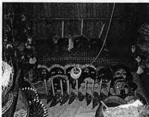
รูปที่ 39. เครื่องบูชาตายายโนราบนพาไล

ประกอบพิธีกรรมจนวันสุดท้ายก็จะนำมาใช้ เหมือนกับการใช้ข้าวสารเสก เพื่อปิดเป่าวิญญาณ หรือสิ่งชั่วร้ายให้ออกห่างจากบ้านเจ้าภาพ (อารี คงเพ็ง, สัมภาษณ์: 2 พฤษภาคม 2550) ในพิธีกรรมจึงเห็นการใช้ข้าวสารรองฐานในการปักเทียนชัย แทนการใช้ทรายเพราะการประกอบพิธีกรรมของทุกอย่างต้องเป็นสิริมงคลและบริสุทธิ์ ดังนั้นเมื่อโนราใหญ่ทำพิธีเชิญตายายโนราเข้ามายังโรงพิธี เครื่องบูชาที่มีเสื่อหมอนตรงนี้ก็จะเป็นการจำลองที่อยู่ของตายายโนราจากห้องบนบ้านนั่นเอง