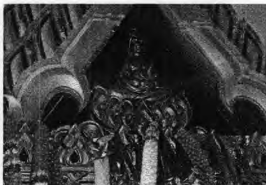
รูปที่ 57. เจ้าแม่อยู่หัว รูปเคารพสำคัญของลูกหลานตายายโนรา วัดท่ากระ อำเภอสทิงพระ สงขลา ต้นกำเนิดของงานประเพณีตายายย่าน

เจ้าแม่อยู่หัวหลังจากอัญเชิญเจ้าแม่อยู่หัวออกจากผอบที่ประดิษฐานมาสร่งน้ำ และชาวบ้านเชื่อว่าน้ำที่สร่งเจ้าแม่อยู่หัวแล้วเป็นน้ำศักดิ์สิทธิ์ หากนำไปผสมน้ำอาบหรือลูบหัวจะเป็นสิริมงคลและช่วยรักษาอาการเจ็บป่วยได้ ตกเย็นคณะโนราผู้ทำหน้าที่ในงานก็จะทำพิธีเบิกโรง กราบครู เหมือนกับโนราโรงครูชาวบ้านทั่วไป ตกค่ำมีโนราแสดงให้ชาวบ้านชม