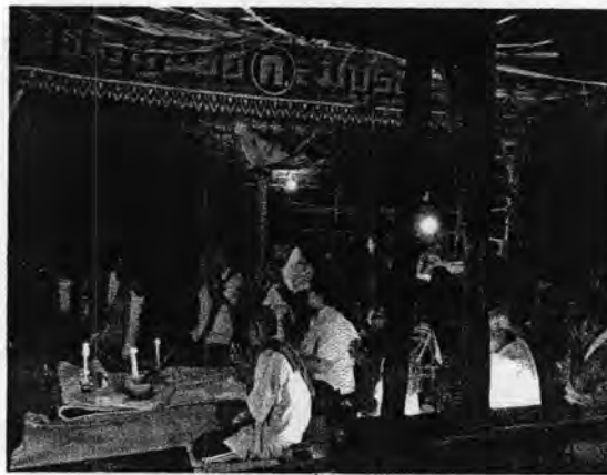
รูปที่ 43. ผู้ร่วมพิธีกราบครูต้องมีผ้าพาดบ่าเพื่อแสดงถึงการเคารพและความขลังของพิธีกรรม

ร่วมพิธีกรรมจะแต่งกายอย่างไรก็ได้แต่ต้องมีผ้าพาดบ่า โดยมากนิยมใช้ผ้าสีขาว ผ้าพาดบ่าจึงถือเป็นสัญลักษณ์ร่วมของผู้เข้าพิธี แสดงถึงความเคารพครูหมอและตายายโนรา และให้เกียรติกับสถานที่และถือเป็นช่วงเวลาศักดิ์สิทธิ์ที่จะต้อนรับตายายโนราที่อยู่ในโลกวิญญาณให้เข้ามายังโลกมนุษย์อย่างเป็นทางการ การกราบจะกราบทั้งหมด 9 ครั้ง ทั้งนี้จำนวน 9 ก็มีความหมายถึงความก้าวหน้าของลูกหลานนั่นเอง โดยตลอดการกราบครูก็จะมีเสียงดนตรีโนราบรรเลงควบคู่ไปด้วยตลอดจนเสร็จพิธีกรรม