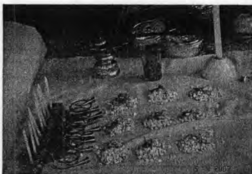
รูปที่ 41. เครื่องบูชาสำหรับพิธีกราบครู

เครื่องบูชาสำหรับพิธีกราบครู ประกอบด้วย ข้าวตอก ดอกไม้ หมากพลู กำไร เล็บ โนราอย่างละ 9 ทุกอย่างพร้อมจุดเทียน 9 เล่ม นอกจากนี้ยังมีเหล้าอีก 1 แก้ว วางของทุกอย่างไว้บนสาดหมอนกลางโรงพิธี โดยข้าวตอก มีความหมายเชื่อมโยงมาจากข้าวสารที่หมายถึงความอุดมสมบูรณ์ ดอกไม้สด ที่นิยมคือดอกดาวเรือง อันหมายถึงความเจริญรุ่งเรืองของผู้เข้าร่วมพิธีกรรม หรือดอกไม้สีขาวที่มีสื่อถึงความบริสุทธิ์ เช่น ดอกมะลิ เป็นต้น เหล้า จะใช้ประพรมข้าวตอกดอกไม้ก่อนที่จะไหว้ครู เพื่อเป็นการบอกกล่าวให้ครูโนราและตายายโนราได้รับทราบ เชื่อกันว่าเหล้ามีความพิเศษบางประการในการสามารถเชื่อมโยงระหว่างคนกับสิ่งเหนือธรรมชาติ หรือวิญญาณได้ ในอดีตก็มีการใช้เหล้าหรือน้ำเมาเพื่อบูชาผีสงมาช้านาน ทั้งนี้ก็เป็นความเชื่อและการให้คุณค่าแก่เหล้า จึงนิยมใช้เหล้าในการประกอบพิธีกรรมแทบทุกชนิด เหล้าจึงทำหน้าที่เป็นสื่อในการบอกให้บรรพบุรุษรู้ว่าลูกหลานได้ทำสิ่งใดให้บ้าง เช่น การใช้เหล้าประพรมข้าวตอกดอกไม้ในช่วงของการไหว้ครูโนรา หรือการประพรมเหล้าบนเครื่องเช่นไห้วเพื่อให้ตายายโนราได้มาเสวยของที่ลูกหลานนำมาให้ ทั้งนี้เพราะการประกอบพิธีกรรมโนราโรงครูไม่นิยมการจุดธูป มีแต่เทียน ธูปมีกลิ่นจึงมีลักษณะเดียวกับเหล้าที่มีกลิ่นเพื่อส่งไปถึงวิญญาณในอีกโลกหนึ่ง นอกจากนี้ ยังมี กำไรและเล็บโนรา เป็นตัวแทนของเครื่องแต่งกายของโนรา และหมากพลู เป็นเครื่องบูชาครูที่ขาดไม่ได้ในการประกอบพิธีกรรมเกือบทุกขั้นตอน