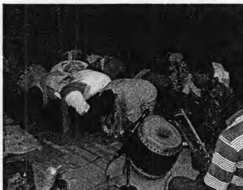
รูปที่ 47. พิธีไหว้ครูหรือกราบครู

โนราก็ต้องมีการมอบตัวต่อครูโนราเป็นพิเศษ นั่นคือ การนำขันหมากไปขอฝากตัวเป็นศิษย์แก่ครูโนราอย่างเป็นทางการ โดยหากครูรับคนผู้นั้นเป็นศิษย์ก็จะรับขันหมากนั้นไว้ เป็นอันเสร็จพิธี