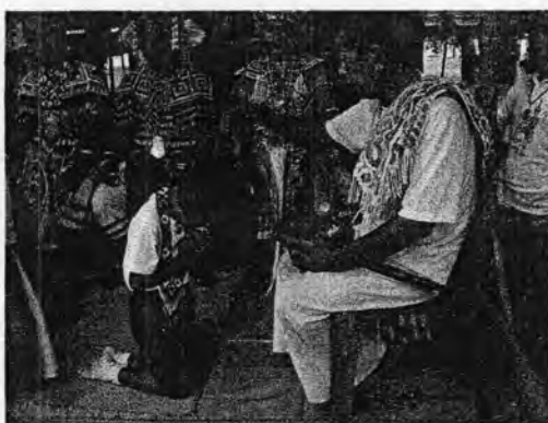
รูปที่ 48. พิธีพาดเครื่อง

2. พิธีพาดเครื่อง พิธีนี้สงวนไว้สำหรับผู้ที่รำโนราเท่านั้น โดยมากมักเป็นผู้ที่เพิ่งหัดรำโนราได้ระยะหนึ่งแล้ว โดยเครื่องแต่งกายโนราที่นิยมนำมาพาดก็คือสร้อยคอ โดยผู้ร่วมพิธีกรรมมักจะแต่งตัวตามลักษณะของการรำนาฏศิลป์ทั่วไป คือ ใส่เสื้อคอกลมสีขาวและผ้าถุงโจงกระเบนสีแดงหรือน้ำเงิน แล้วโนราใหญ่หรือครูโนราก็จะสวมซับทรงให้ แล้วประพรมน้ำมนต์ให้เป็นสิริมงคล พิธีพาดเครื่องจึงเป็นการแสดงให้เห็นว่าศิษย์หรือศิลปินโนราคนนั้นได้มีการพัฒนาฝีมือจนเป็นที่ยอมรับของครูโนราอีกระดับหนึ่งแล้ว