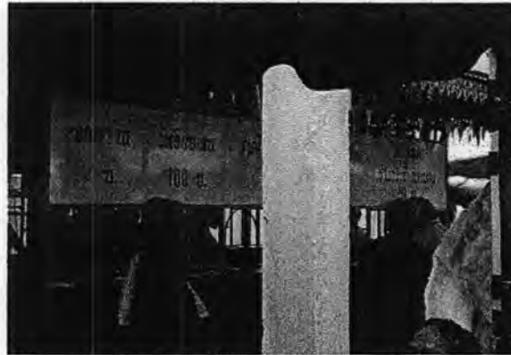
รูปที่ 58. ห้องจำหน่ายตัวแก้บนในงานโนราโรงครูท่าคุระ

และดอกไม้ไว้พร้อม ซึ่งก็จะมีการทำพิธีแก้บนไปจนช่วงเย็นและในตอนกลางคืนวันพฤหัสบดี ในราแสดงส่งครูอีกหนึ่งคืน จนกลายเป็นงานประเพณีประจำปีและเป็นที่ยึดมั่นกันไปจนได้รับการ รวมอยู่ในงานประเพณีที่การท่องเที่ยวแห่งประเทศไทยประชาสัมพันธ์เชิญชวนให้นักท่องเที่ยวที่รัก การท่องเที่ยวเชิงวัฒนธรรมได้เข้าไปสัมผัส