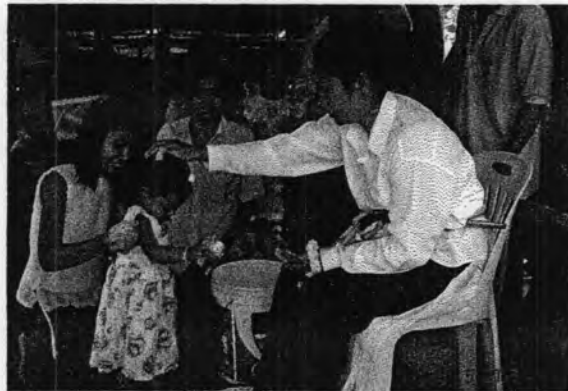
รูปที่ 54. การสร้งน้ำ (รดน้ำดำหัว) ตายายโนราเพื่อขอพร

ดอกไม้ เพื่อที่ตายายโนราในร่างทรงจะมอบสิ่งของเหล่านี้ให้กับลูกหลานไว้เป็นตัวแทนตายายโนรา เพื่อปกป้องคุ้มครองและเป็นสิริมงคลแก่ตัวเอง โดย ข้าวสาร หมายถึง ให้มีความบริสุทธิ์เหมือนอย่างเมล็ดข้าวที่ขาวนวล คือการสอนให้ทำความดีจึงจะเป็นผู้บริสุทธิ์ทั้งกายใจ ถั่วเขียว หมายถึง ความเจริญงอกงาม ให้มีการเติบโตเหมือนอย่างถั่วเขียวที่เกิดงายโตเร็ว ดอกไม้ แทนความหมายให้มีแต่คนรักคนชอบเหมือนความสวยงามและหอมหวานของดอกไม้ เงิน ให้บังเกิดความมั่งคั่ง ร่ำรวยแก่ลูกหลาน