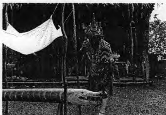
รูปที่ 53. โนราประยูรทำพิธีแทงเข้ (จระเข้)

การรำแทงเข้เป็นการแสดงเชิงพิธีกรรมอีกอย่างหนึ่งที่ชวนติดตามมาก อย่างการรำแทงเข้ของหัวหน้าคณะโนราชุกลิ่น นอกจากจะสามารถสะกดผู้ชมให้ดูตั้งแต่ต้นจนจบได้แล้ว ยังมีบรรยากาศที่เพิ่มความขลังของการรำแทงเข้ให้มีความศักดิ์สิทธิ์ยิ่งขึ้น คือเกิดฝนตกลงมาพอดีกับช่วงเวลาที่ไกรทองกำลังจะล่องแพเพื่อเข้ามาต่อสู้กับขาละวันในน้ำ แต่เมื่อการแสดงสิ้นสุดลงไม่นานเมฆฝนก็เริ่มสร้างซาและเหือดหายไปในช่วงระยะเวลาอันสั้นเท่านั้นเอง ทำให้ทั้งเจ้าภาพและชาวบ้านต่างพูดทำนองเดียวกันว่า “คณะนี้ทำรำแทงเข้ได้แน่จริงๆ” แสดงถึงความชื่นชมในการประกอบพิธีกรรมของนายโรงโนรานั้นเอง