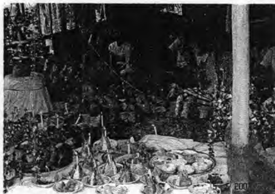
รูปที่ 45. การทำพิธีเซ่นไหว้ตายายโนราด้วยของแค้นและอาหารคาวหวาน