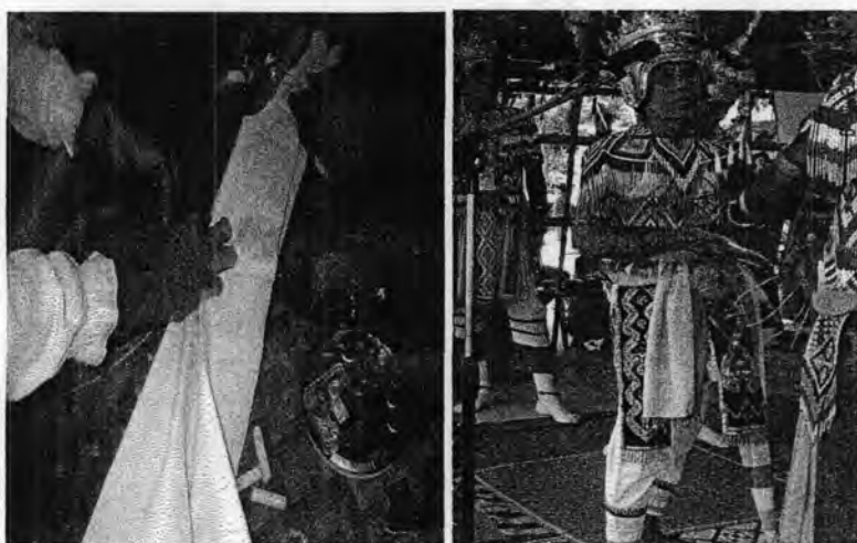
รูปที่ 46. การพับผ้าแต่งพอกและการแต่งกายในชุดแต่งพอก

2.2 พิธีครอบเทริด หากเป็นสายตระกูลที่มีเชื้อสายศิลปินโนรา แล้วลูกหลานต้องการที่จะเข้าพิธีครอบเทริดก็สามารถทำได้ในวันี่เช่นกัน โนราใหญ่และผู้ช่วยอีกสองคนจะแต่งตัวเป็นพิเศษ เรียกว่า “แต่งพอก” เพื่อทำพิธีครอบเทริดให้แก่โนราใหม่ การแต่งพอกคือการนุ่งสนับเพลาแล้วนุ่งผ้าลายตามแบบโนรา เอาผ้าขาวผืนหนึ่งมาพับเข้าเป็นชั้นๆ อย่างมีระเบียบ 9 ชั้น ผ้าขาวแต่ละชั้นจะต้องใส่หมาก 1 คำ เทียน 1 เล่ม เงิน 1 บาท และของที่พับใส่ไว้ในพอกแต่ละชั้นนั้นก็เพื่อเป็นเครื่องบูชา จากนั้นผูกพอกเป็นข้อไว้ 1 ครั้ง แล้วเอาปลายข้างหนึ่งมาแขวนไว้ข้างสะเอว ต่อจากนั้นจึงสวมเครื่องแต่งกายโนราปกติ โดยเชื่อกันว่าศิลปินโนราจะอัญเชิญครูหมอโนราและตายายโนราของเจ้าภาพมาให้มาอยู่ในพอกนี้เพื่อร่วมทำพิธีไปพร้อมๆ กัน