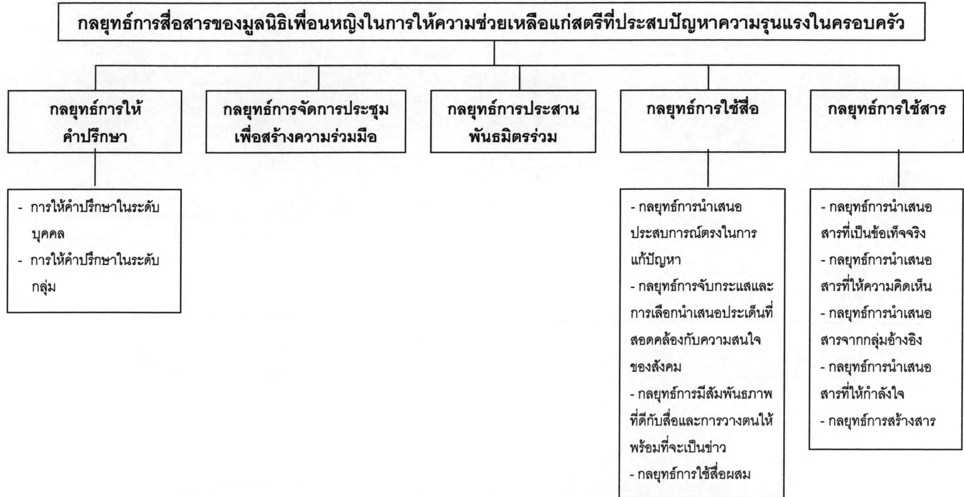
แผนภาพที่ 5 : กลยุทธ์การสื่อสารของมูลนิธิเพื่อนหญิงในการให้ความช่วยเหลือแก่สตรีที่ประสบปัญหาความรุนแรงในครอบครัว