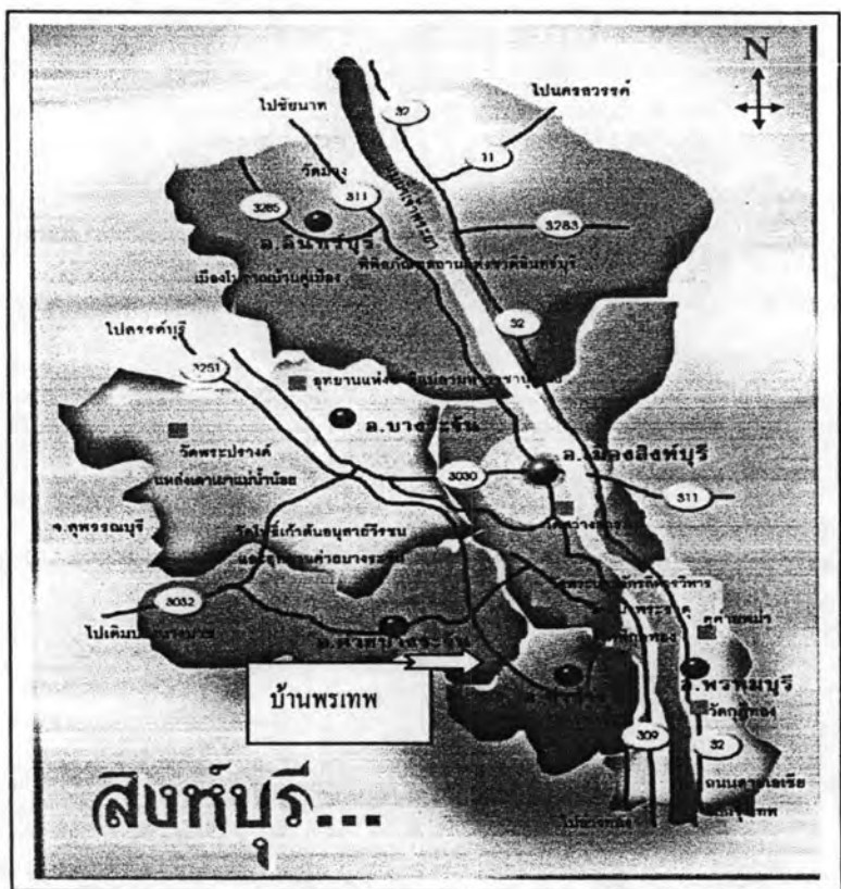
ภาพประกอบ 3 แผนที่แสดงการเดินทางไปบ้านพรเทพ พรทวิ