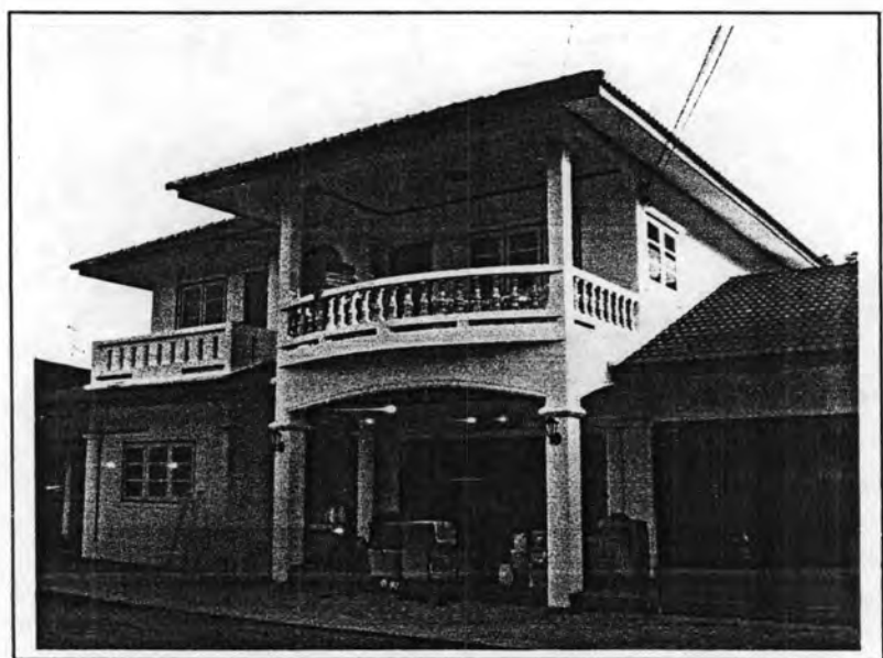
ภาพประกอบ 4 บ้านพรเทพ พรทวิ ในปัจจุบัน บันทึกภาพเมื่อวันที่ 29 ตุลาคม 2549