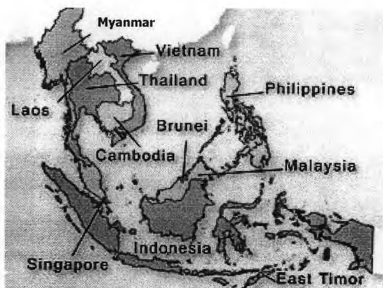
รูปที่ 3-2 แสดงประเทศสมาชิกในแถบภูมิภาคเอเชียตะวันออกเฉียงใต้