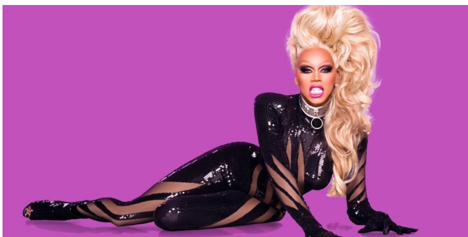
รูปภาพที่ 9 : RuPaul Andre Charles ผู้ก่อตั้งรายการ RuPaul กับการแต่งกายเป็น Drag Queen โปสท่าถ่ายภาพให้กับนิตยสาร Marie Claire โดยแต่งกายเป็นผู้หญิงแล้วแสดงท่าทางเป็นผู้หญิง