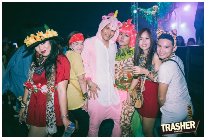
รูปภาพที่ 6 : สถานที่จัดงานในธีม “TRASHER X SHARK " INTO THE WILD” โดยตกแต่งสถานที่ให้บรรยากาศเหมือนป่า และนำเสนอให้ผู้เข้าร่วมงานแต่งตัวให้เข้ากับธีมป่า