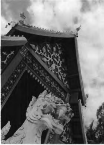
วัดหนองบัว