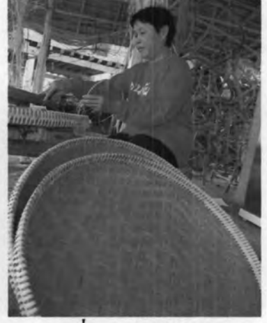
เครื่องหวายจักสาน