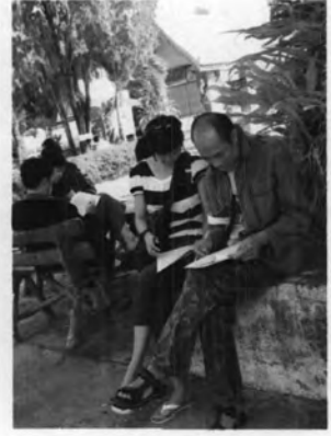
การเก็บข้อมูลจากแบบสอบถาม