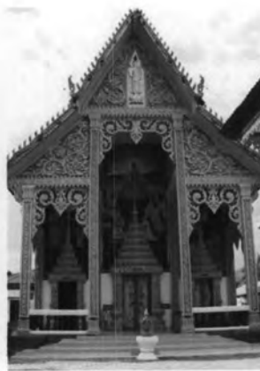
วัดคอนแก้ว