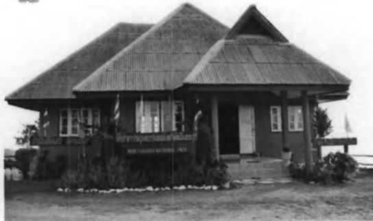
อุทยานแห่งชาตินันทบุรี