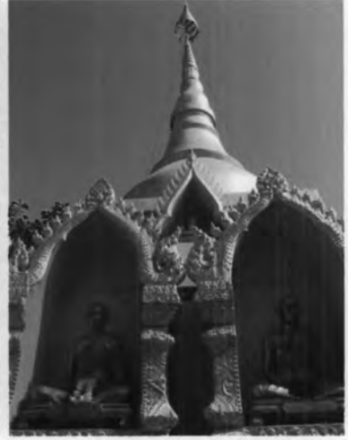
พระธาตุศรีฝายมูล