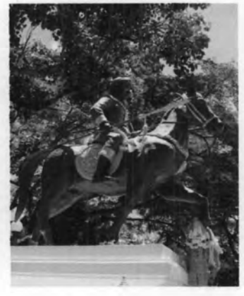
ศาลเจ้าหลวงเมืองลำ