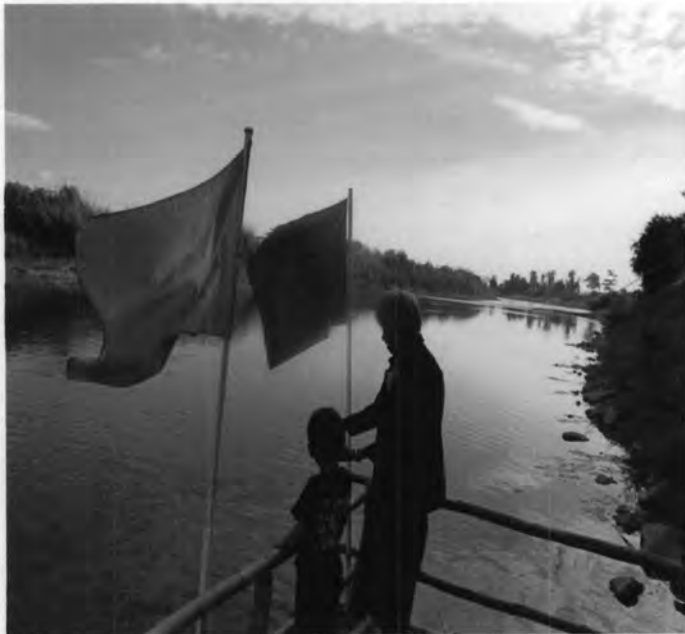
กิจกรรมให้อาหารปลา ณ อุทยานมัจฉา