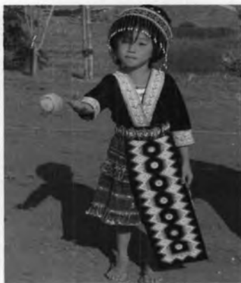
ปี่ไหม่ม้ง