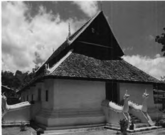
วัดคอนมูล