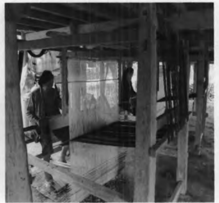
การทอผ้าพื้นเมือง