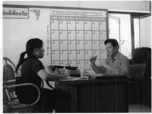
การเก็บข้อมูลจากการสัมภาษณ์