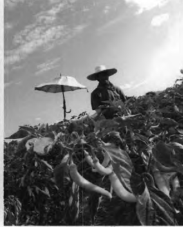
เกษตรกรรมพื้นบ้าน