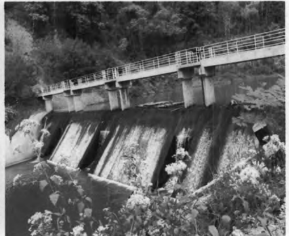
เหมืองมหัศจรรย์