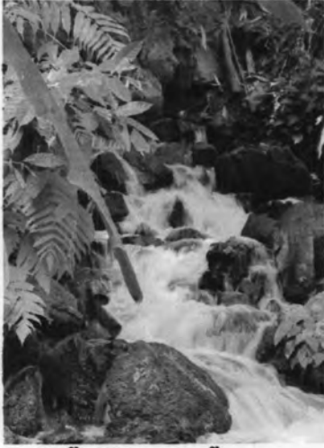
น้ำออกกรู (ธารน้ำลอด)