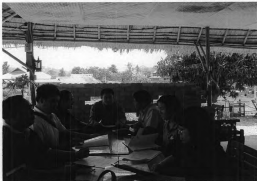
การเก็บข้อมูลจากการประชุมกลุ่ม