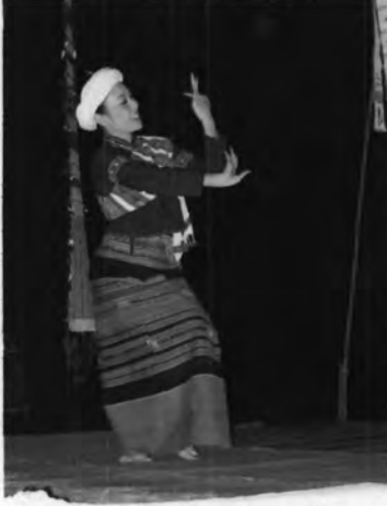
ฟ้อนสาวไหมชาวไทลื้อ