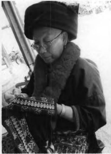
การปักผ้าของชาวเมี่ยน