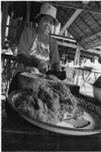
อาหารพื้นบ้านจากไถ (สาหร่ายน้ำจืด)