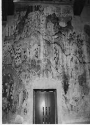
จิตรกรรมฝาผนังวัดหนองบัว