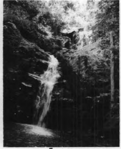
น้ำตกสันติสุข