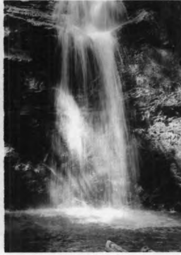
น้ำตกนันทบุรี