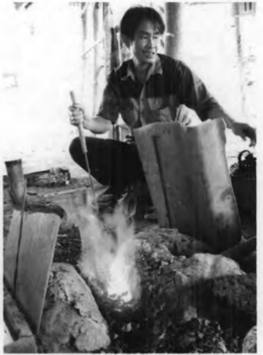
การตีมีดของชาวไทพวน