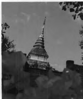
พระธาตุนองหยิบ