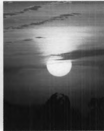
พระอาทิตย์ตกดินที่ดอยด้ว