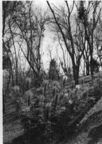
ทุ่งดอกไม้ดอยยาว