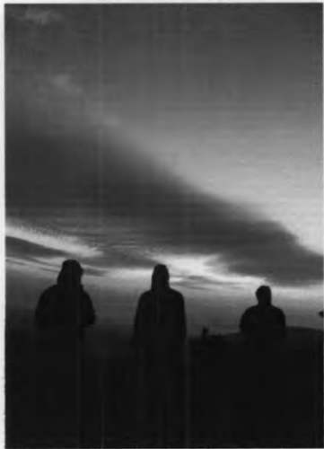
พระอาทิตย์ขึ้นที่ผาช้าง