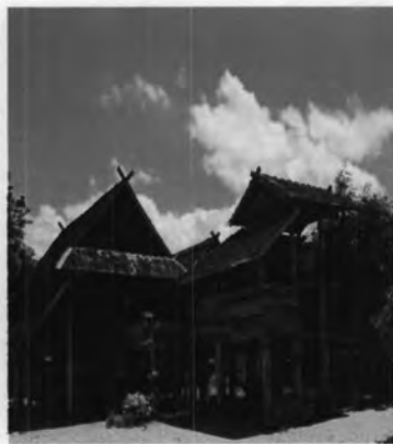
เรือนชาวไทลื้อ