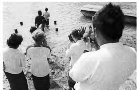
ภาพที่ 53-54 ผู้เข้าร่วมกิจกรรมลอยกระทงเพื่อขอขมาพระแม่คงคาในพิธีสืบชะตาแม่น้ำปี พ.ศ. 2551

จากข้อมูลการจัดพิธีสืบชะตาแม่น้ำของกลุ่มรักษ์ป่าสักในปี พ.ศ. 2544 พ.ศ. 2547 และ พ.ศ. 2548 เมื่อนำมารวมกับข้อมูลการจัดพิธีสืบชะตาแม่น้ำในปี พ.ศ. 2549 ซึ่งจัดโดยชุมชนบ้านต้นตาล ที่ได้รับการสนับสนุนจากโครงการสื่อพื้นบ้านสื่อสารสุข และการจัดพิธีสืบชะตาแม่น้ำในปี พ.ศ. 2551 ซึ่งจัดโดยความร่วมมือระหว่างสำนักงานวัฒนธรรมแห่งชาติและชุมชนบ้านต้นตาล สามารถแสดงเป็นตารางเปรียบเทียบการจัดพิธีสืบชะตาแม่น้ำ ดังนี้