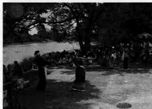
ภาพที่ 55-60 ภาพบรรยากาศตลาดทำน้าบ้านต้นตาล