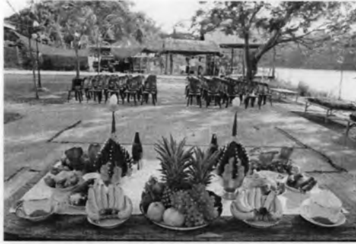
ภาพที่ 48 เครื่องเซ่นไหว้ในพิธีสืบชะตาแม่น้ำปี พ.ศ. 2551

2. จากนั้น อาจารย์พิเนตร น้อยพุทธา กล่าวอาราธนาพระพุทเจ้า 5 พระองค์ พระธรรม พระสงฆ์ คุณบิดามารดา คุณกษัตริย์ จากนั้นเชิญเทพยดาทุกชั้นฟ้าลงมาที่ประจำพิธี และกล่าวคำขอสืบชะตา บทเดียวกับที่ใช้ในพิธีสืบชะตาแม่น้ำในปี พ.ศ. 2549