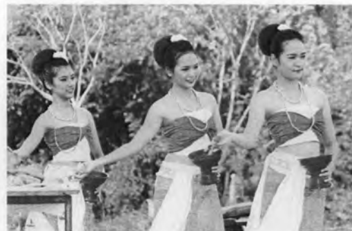
ภาพที่ 50-51 การพ้อนรำเพื่อบวงสรวงสิ่งศักดิ์สิทธิ์ในพิธีสืบชะตาแม่น้ำปี พ.ศ. 2551