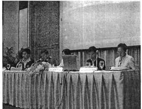
เหล่าวิทยากรที่ให้เกียรติมาร่วมบรรยายในหัวข้อ "การแก้ไขปัญหาคาความรุนแรงทางเพศแบบสหวิชาชีพ ในระดับนโยบาย"