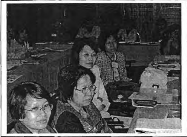
บรรยากาศการฟังบรรยายในช่วงเช้า