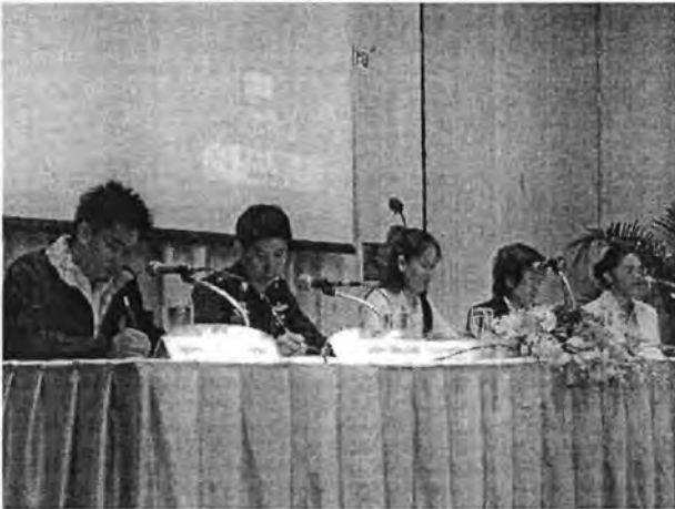
ตัวแทนสหวิชาชีพที่เข้ารับการอบรม ร่วมบรรยายใน หัวข้อ "รูปแบบการฝึกอบรมกับการนำไปใช้"