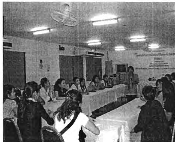
บรรยากาศในการแลกเปลี่ยนความคิดเห็น ระหว่างวิชาชีพ