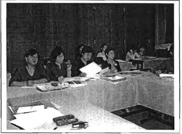
ผู้เข้าร่วมประชุมแบ่งกลุ่มระดมสมอง