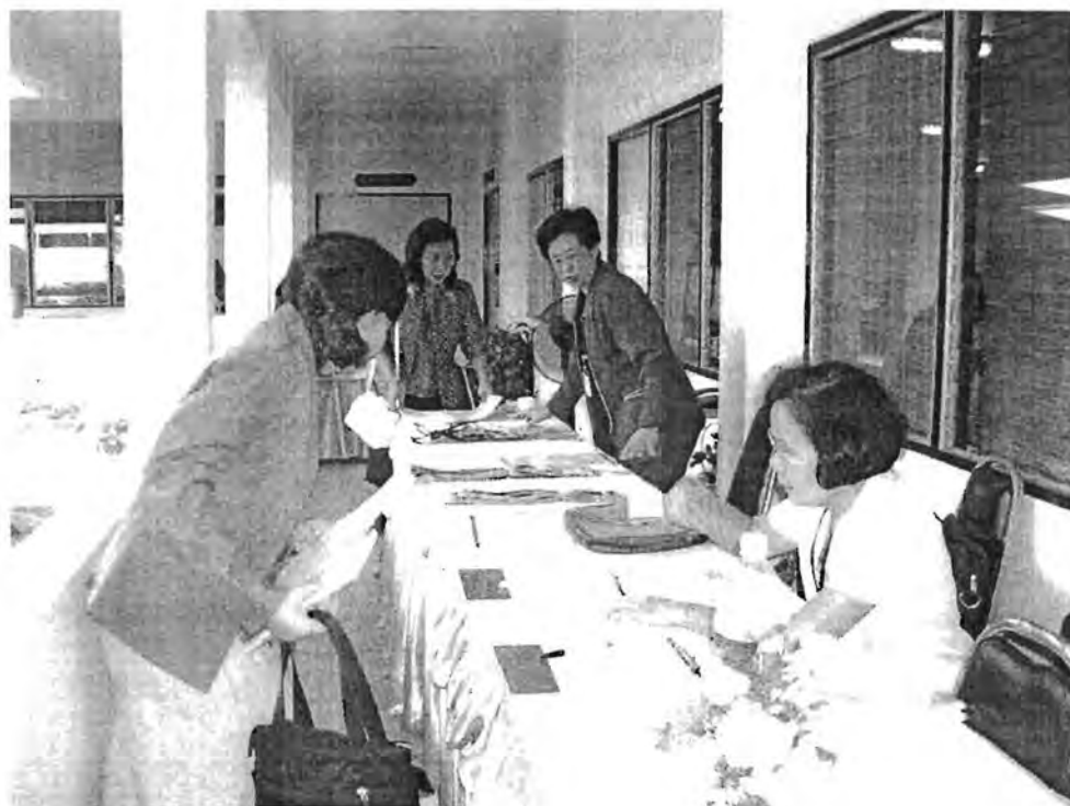
บรรยากาศการลงทะเบียนเข้าร่วมการอบรม

ณ We-Train International House สมาคมส่งเสริมสถานภาพสตรี ดอนเมือง กรุงเทพฯ