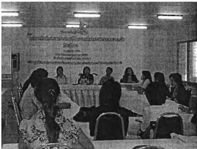
คณะวิทยากรจากมูลนิธิเพื่อนหญิง ร่วมกันบรรยายหัวข้อ “กระบวนการทางกฎหมาย และกระบวนการดูแล Case หลังจากการแจ้งความ” เมื่อวันที่ 3 กันยายน 2548