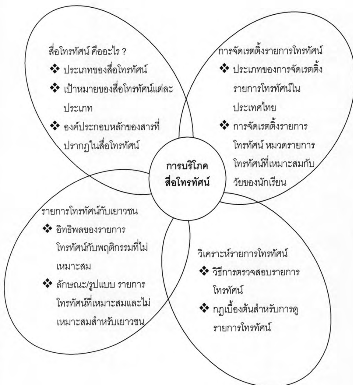
แผนภาพที่ 4 ขอบข่ายหัวข้อเรื่องที่ใช้ในการจัดกิจกรรมการเรียนรู้

5.2 ศึกษาเอกสารและงานวิจัยที่เกี่ยวข้องกับความรู้เรื่องสื่อโทรทัศน์ในประเทศไทย และผลกระทบของรายการโทรทัศน์ที่มีต่อเยาวชน เพื่อนำมาใช้เป็นเนื้อหา ความรู้ของโปรแกรม ส่งเสริมความรู้เรื่องการบริหารสื่อโทรทัศน์ จากนั้นกำหนดขอบข่ายหัวข้อเรื่องที่ใช้ในการจัดกิจกรรม การเรียนรู้ ดังแสดงในแผนภาพที่ 4