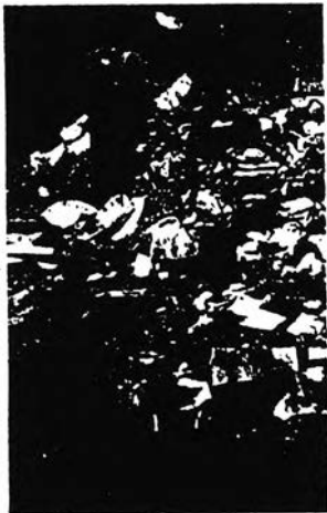
ชาติของมนุษย์ พุดอย่างที่พระท่านสอนก็คือ ฉันทะที่จะแยกขยะเป็นเรื่องสำคัญกว่าเทคนิคการแยกขยะ มีฉันทะแล้วก็สามารถรื้อฟื้นเทคนิคนั้นได้ไม่ยากและอันที่จริงแล้ว ในโลกนี้ก็ไม่มีเทคนิคการแยกขยะที่ตายตัว ขึ้นอยู่กับระดับของสังคมซึ่งไม่เหมือนกัน

และขึ้นอยู่ว่า สังคมนั้นๆ หนีบเอาอะไรไว้เรียนใช้ รีไซเคิลบ้างบ้างบ้าง