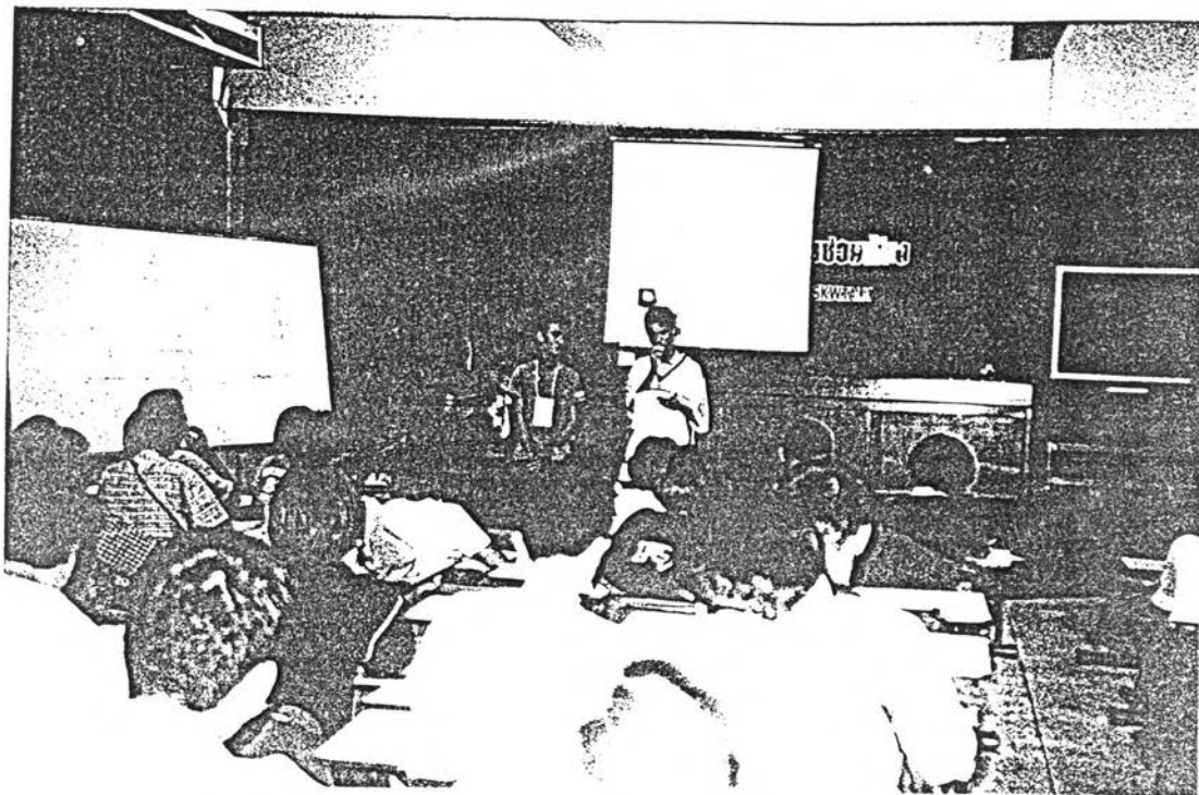
ภาพที่ 4 การประชุมรวมเยาวชนผู้เข้ารับการอบรม