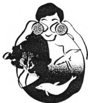
รูปที่ 3 ตราสัญลักษณ์ของปีท่องเที่ยวเชิงนิเวศนานาชาติ