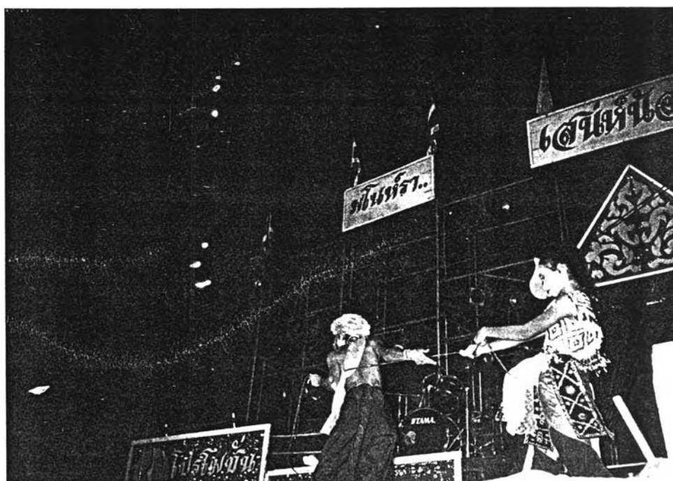
การแสดงเรื่องแบบโบราณเรื่องพระสุถนมนรินทร์รา ของโนราคณะเสนห์น้อย ดาวรุ่ง