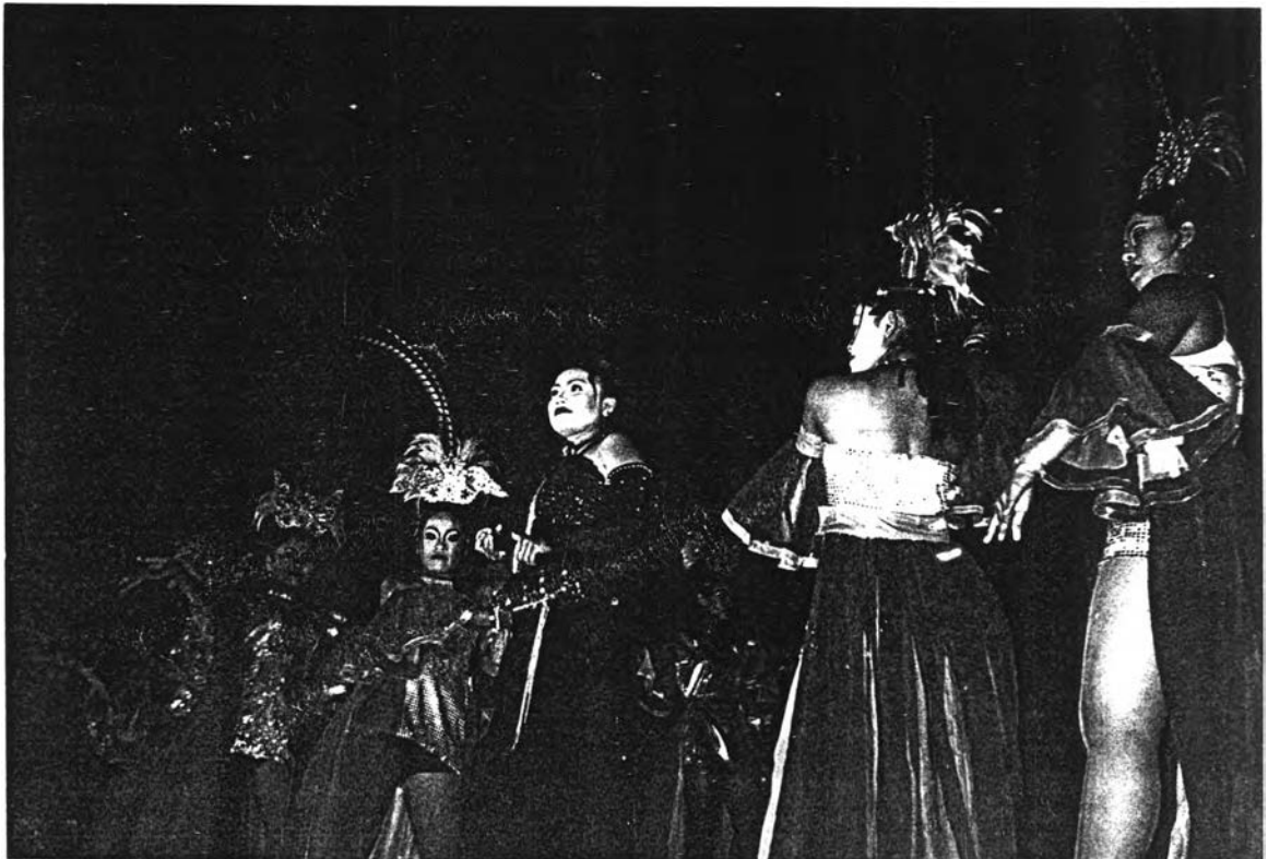
การแสดงดนตรีลูกทุ่งของโนราคณะสร้อยเพชร