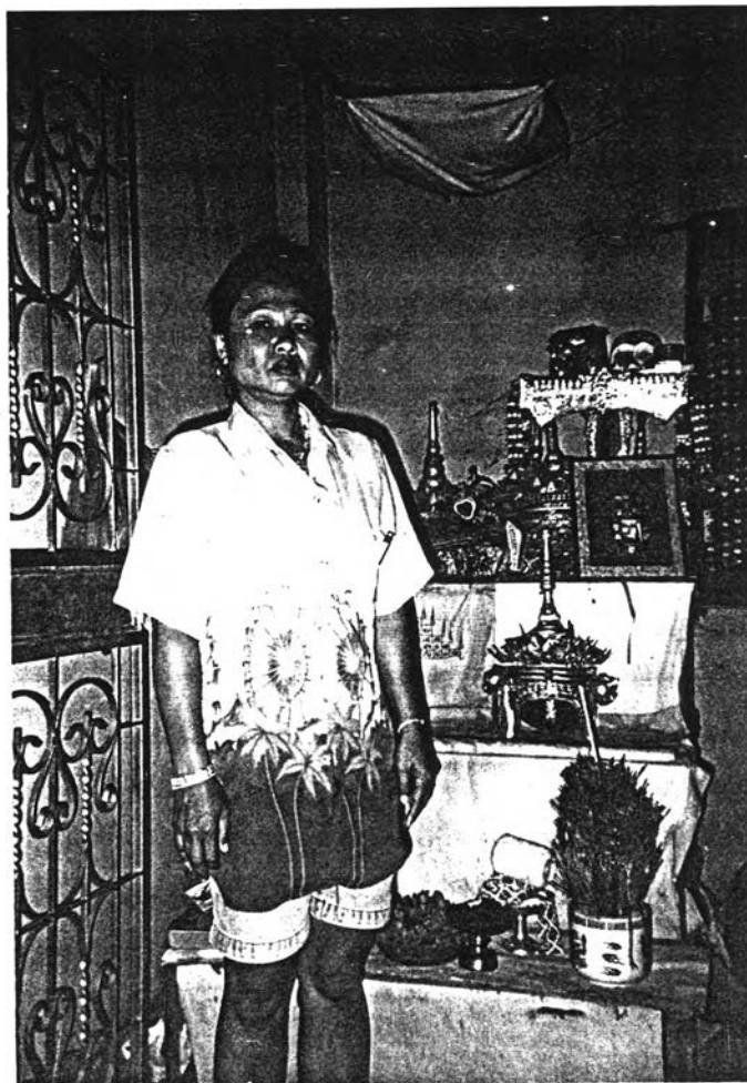
โนราน้ำอ้อย เสียงทอง และหิ้งบูชาครูหมอโนรา