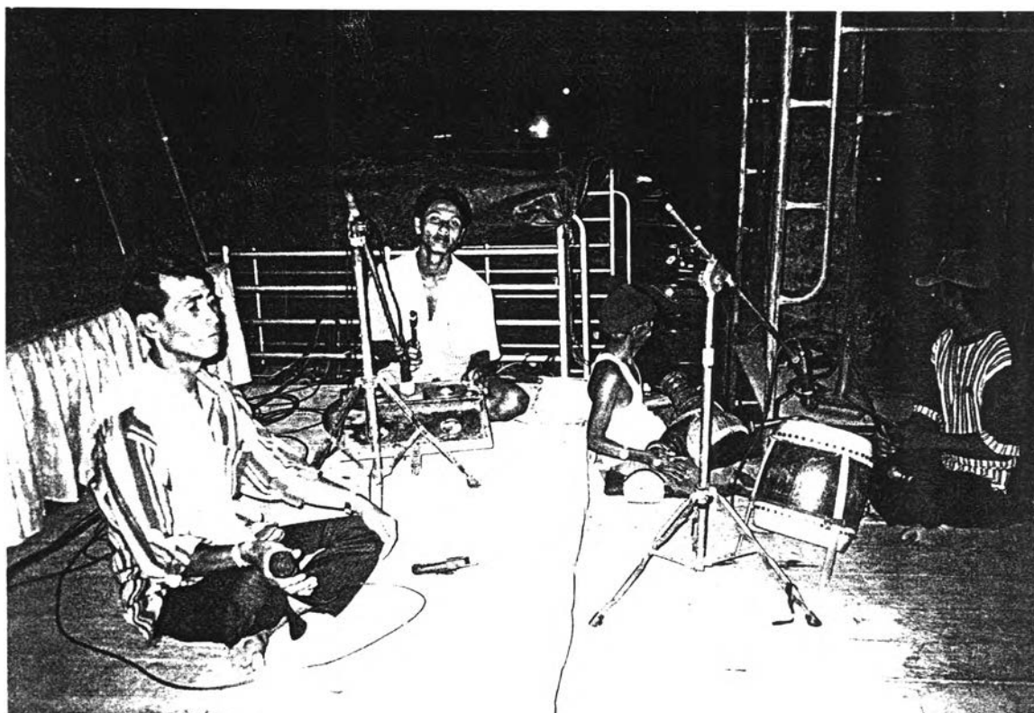
ลูกคู่ในขณะที่เครื่อง โหมโรงก่อนกาศครู