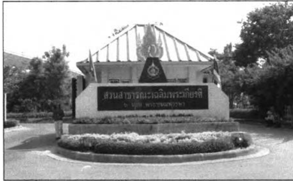
รูปที่ 6.2 แสดงป้ายชื่อเฉลิมพระเกียรติด้านถนนพระราม3