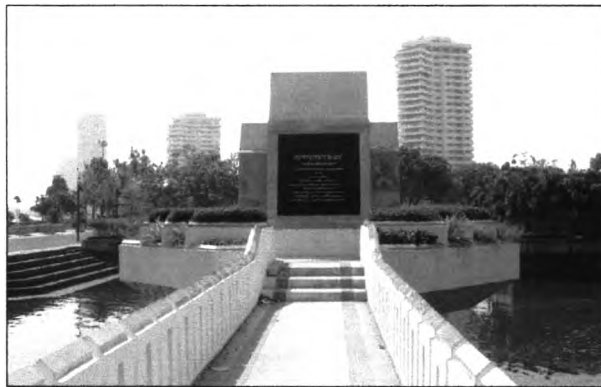
รูปที่ 6.3 แสดงป้ายชื่อเฉลิมพระเกียรติด้านสะพานแขวน

ซึ่งถือว่าการสร้างสวนเพื่อเฉลิมพระเกียรติ พระเจ้าอยู่หัวรัชกาลที่ 9 ประสบความสำเร็จเพราะผู้ใช้สวนส่วนมากทราบถึงจุดประสงค์หลักของโครงการ โดยประมาณถึงร้อยละ 60 ของผู้ใช้ทั้งหมด แต่ในการสร้างสัญลักษณ์เพื่อสื่อถึงนั้นยังไม่ประสบความสำเร็จเท่าที่ควร