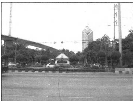
ภาพที่ 6.6 และ 6.7

2. การประชาสัมพันธ์สวนเพื่อช่วยให้คนรู้จักสวนมากขึ้นจากการเก็บข้อมูลกลุ่มผู้อาศัยในรัศมีบริการ 1 กิโลเมตร พบว่าผู้ที่ไม่มาใช้สวนเนื่องจากไม่รู้จักสวน คิดเป็นร้อยละโดยประมาณ 35 ของผู้ตอบว่าไม่ใช่ทั้งหมด ซึ่งเป็นที่น่าสังเกตว่าเพราะเหตุใดผู้ที่อยู่ในบริเวณใกล้สวนสาธารณะถึงไม่รู้จักสวน เมื่อพิจารณาถึงลักษณะสภาพแวดล้อมที่ตั้งของสวนและลักษณะรูปแบบของสวนสาธารณะ อาจเป็นไปได้ว่าสภาพการจราจรบริเวณถนนพระราม 3 ซึ่งเป็นถนนหน้าสวนสาธารณะมีสภาพการจราจรที่รถแล่นผ่านตลอดประกอบด้วยลักษณะทางเข้าของสวนสาธารณะไม่มีจุดเด่นที่สังเกตเห็นได้อย่างชัดเจน ลักษณะป้ายทางเข้าสวนอาจเล็กเกินไปหรือลักษณะป้ายอาจไม่สามารถสื่อได้ว่าเป็นสวนสาธารณะเนื่องจากลักษณะป้ายอาจดูเหมือนสถานที่ราชการทั่วไป และพื้นที่ติดถนนด้านหน้าของสวนอาจมีน้อยเกินไปเนื่องจากมีตึกแถวบังในบางส่วนทำให้ไม่สามารถเห็นสวนได้อย่างชัดเจน ดังรูป