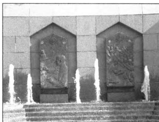
ภาพที่ 6.10 แสดงภาพรูปปั้นนูนต่ำ วันที่ 10 กุมภาพันธ์ 2546 เวลา 16:20

จากแบบสอบถามพบว่าผู้ใช้สามารถรับรู้ถึงจุดประสงค์ในการสร้างสวนสาธารณะเพื่อเฉลิมพระเกียรติ คิดเป็นร้อยละ 55.7 ของผู้ใช้บริการทั้งหมด ผู้สามารถรับรู้ว่าจะสร้างเพื่อเฉลิมพระเกียรติพระบาทสมเด็จพระเจ้าอยู่หัวรัชกาลที่ 9 คิดเป็นร้อยละ 62.3 ของผู้ตอบว่าทราบทั้งหมด จากข้อมูลที่ได้พบว่าผู้ที่ทราบถึงวัตถุประสงค์ของสวนจากป้ายชื่อสวน คิดเป็นร้อยละ 31.7 ของผู้ตอบว่าทราบทั้งหมด และทราบจากกำแพงสดุดี คิดเป็นร้อยละ 24.3 ของผู้ตอบว่าทราบทั้งหมด แสดงให้เห็นว่าผู้ใช้ส่วนใหญ่ทราบจากป้ายชื่อสวน จึงเป็นที่น่าสังเกตว่าเพราะสาเหตุใดผู้ใช้บริการสวนจึงทราบจากตัวกำแพงน้อยกว่า ทั้งที่ตัวกำแพงอยู่ในบริเวณที่สามารถมองเห็นได้อย่างชัดเจน ทั้งจากทางเข้า 2 ด้านเมื่อเข้ามาใช้สวนสาธารณะ ลักษณะของกำแพงใช้สีสันทันที่โดดเด่น รูปปั้นนูนต่ำแสดงพระราชกรณียกิจของ ร.9 เป็นพระบรมฉายาลักษณ์เหมือนจริง ดังรูป