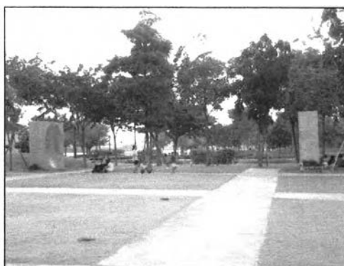
ภาพที่ 6.11 แสดงภาพกำแพงสะท้อนเสียง วันที่ 10 กุมภาพันธ์ 2546 เวลา 16:00

3. กำแพงสะท้อนเสียง ลักษณะตัวกำแพงเป็นคอนกรีตรูปพาราโบลา มี 2 ข้างใช้ในการเล่นเพื่อสะท้อนเสียง ดังรูป