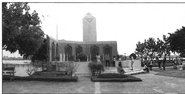
รูปที่ 6.1 แสดงกำแพงสดุดี

3. การเฉลิมพระเกียรติ จากข้อมูลที่ได้ พบว่ามีผู้ใช้สวนทราบว่าสวนนี้สร้างขึ้นเพื่อเฉลิมพระเกียรติร้อยละ 55.7 ของผู้ใช้ทั้งหมด โดยในจำนวนนี้ทราบจากป้ายคิดเป็นร้อยละ 31.3 ของผู้ตอบว่าทราบทั้งหมด ทราบจากรูปกำแพงสดุดีคิดเป็นร้อยละ 24.3 ของผู้ตอบว่าทราบทั้งหมด ซึ่งเป็นที่น่าสังเกตว่าเพราะเหตุใดการสื่อด้วยกำแพงสดุดีไม่ประสบความสำเร็จเท่าที่ควร ทั้งที่ตำแหน่งที่ตั้งอยู่กำแพงอยู่ในบริเวณที่เปิดโล่งสามารถมองเห็นตัวกำแพงได้อย่างชัดเจน ลักษณะกำแพงมีพระบรมฉายาลักษณ์พระบาทสมเด็จพระเจ้าอยู่หัวรัชกาลที่ 9 เป็นภาพนูนต่ำที่แสดงพระราชกรณียกิจ ซึ่งผู้พบเห็นสามารถเข้าใจได้ง่าย อยู่ตำแหน่งที่เหมาะสม และมีการเปิดน้ำพุในช่วงที่มีผู้ใช้สวนหนาแน่นซึ่งเป็นการเพิ่มความน่าสนใจให้แก่ตัวกำแพงได้ดี ผู้ใช้สวนส่วนหนึ่งก็ทำกิจกรรมบริเวณหน้ากำแพงสดุดีซึ่งเป็นลานโล่งมีผู้มาทำกิจกรรมมาก ดังรูป