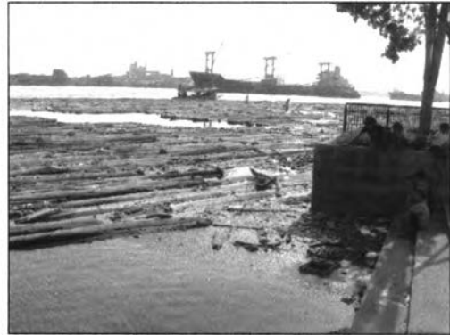
ภาพที่ 6.12 และ 6.13 แสดงภาพพื้นที่รึมน้ำภายในสวน วันที่ 10 กุมภาพันธ์ 2546 เวลา 15:20

จากการสัมภาษณ์เพิ่มเติมผู้ใช้บริการภายในสวน รู้สึกว่าสวนสกปรกเนื่องจากขยะที่ลอยอยู่ในน้ำและส่งกลิ่น และเมื่อน้ำลงทำให้เกิดภาพที่ไม่น่าดู ซึ่งจากการสัมภาษณ์ผู้ดูแลสวนไม่ได้ทำความสะอาดในบริเวณขยะที่อยู่ริมน้ำ และริมแม่น้ำเจ้าพระยาเนื่องจากทางเทศบาลจะมาเก็บขยะที่อยู่ริมน้ำ แนวทางการแก้ไขอาจทำได้โดยการตั้งถังขยะบริเวณริมน้ำเพิ่มขึ้นเพื่อให้ผู้ใช้ได้มีทางเลือกในการทิ้งขยะ และดูแลรักษาความสะอาดบริเวณริมน้ำมากขึ้น อาจหาแนวทางการแก้ไขไม้ที่ลอยอยู่ริมแม่น้ำ