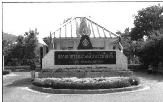
รูปที่ 6.4 แสดงทางเข้าสวนเฉลิมพระเกียรติด้านถนนพระราม3

อาจเห็นได้ว่าสวนสาธารณะขาดการประชาสัมพันธ์ การประชาสัมพันธ์หรือจัดกิจกรรมเพื่อกระตุ้นให้คนในพื้นที่เกิดความสนใจและรู้จักสวนนี้มากขึ้น อาจเป็นไปได้ว่าสวนแห่งนี้ยังมีการประชาสัมพันธ์ที่ไม่เพียงพอ