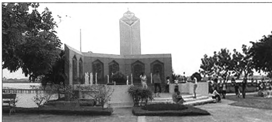
ภาพที่ 6.9 แสดงภาพกำแพงสดุดี วันที่ 10 กุมภาพันธ์ 2546 เวลา 16:20

1.2 บริเวณลานกำแพงสดุดีพระราชกรณียกิจ สื่อบริการทราบถึงจุดมุ่งหมายหลักในการสร้างสวนสาธารณะเพื่อเทิดพระเกียรติพระบาทสมเด็จพระเจ้าอยู่หัวรัชกาลที่ 9 ดังรูป