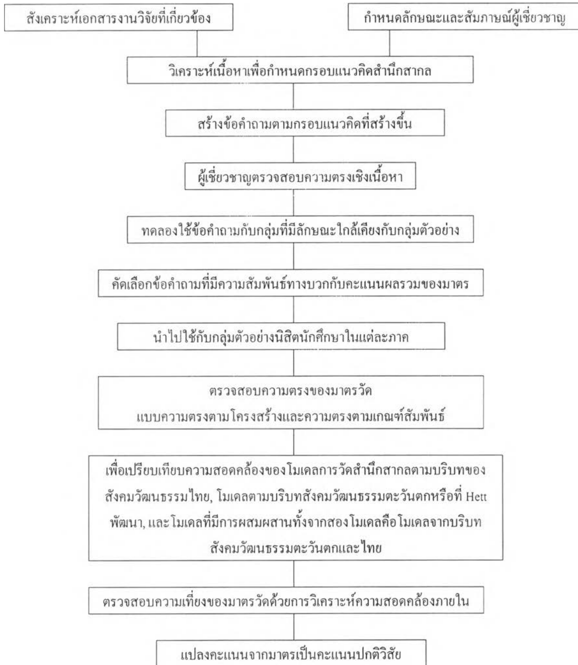
ภาพที่ 3.1 ขั้นตอนในการพัฒนามาตรสำนึกสากล

ขั้นตอนในการพัฒนามาตรสำนึกสากล แสดงจากแผนภาพ ต่อไปนี้