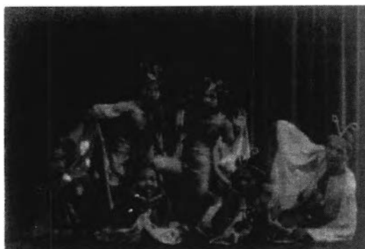
ภาพที่ 24 ระบายฝีเลือด

อธิบายภาพ : เครื่องแต่งกายที่นักแสดงสวมใส่ เลียนแบบลักษณะของฝีเลือด เลือดและทางแกงมีลักษณะเน้นรูปร่างของนักแสดง ใช้ผ้าทำเป็นปีก ตัดเย็บลวดลายของปีก และเครื่องประดับศีรษะใส่เพื่อความสมจริง