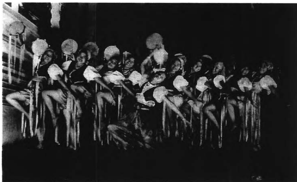
ภาพที่ 19 ระบายิปตี

อุปกรณ์ประกอบระบำ รำมะนา (Tamboorine) ใช้ผ้าผูกเป็นริ้ว ๆ รอบหน้ากลอง