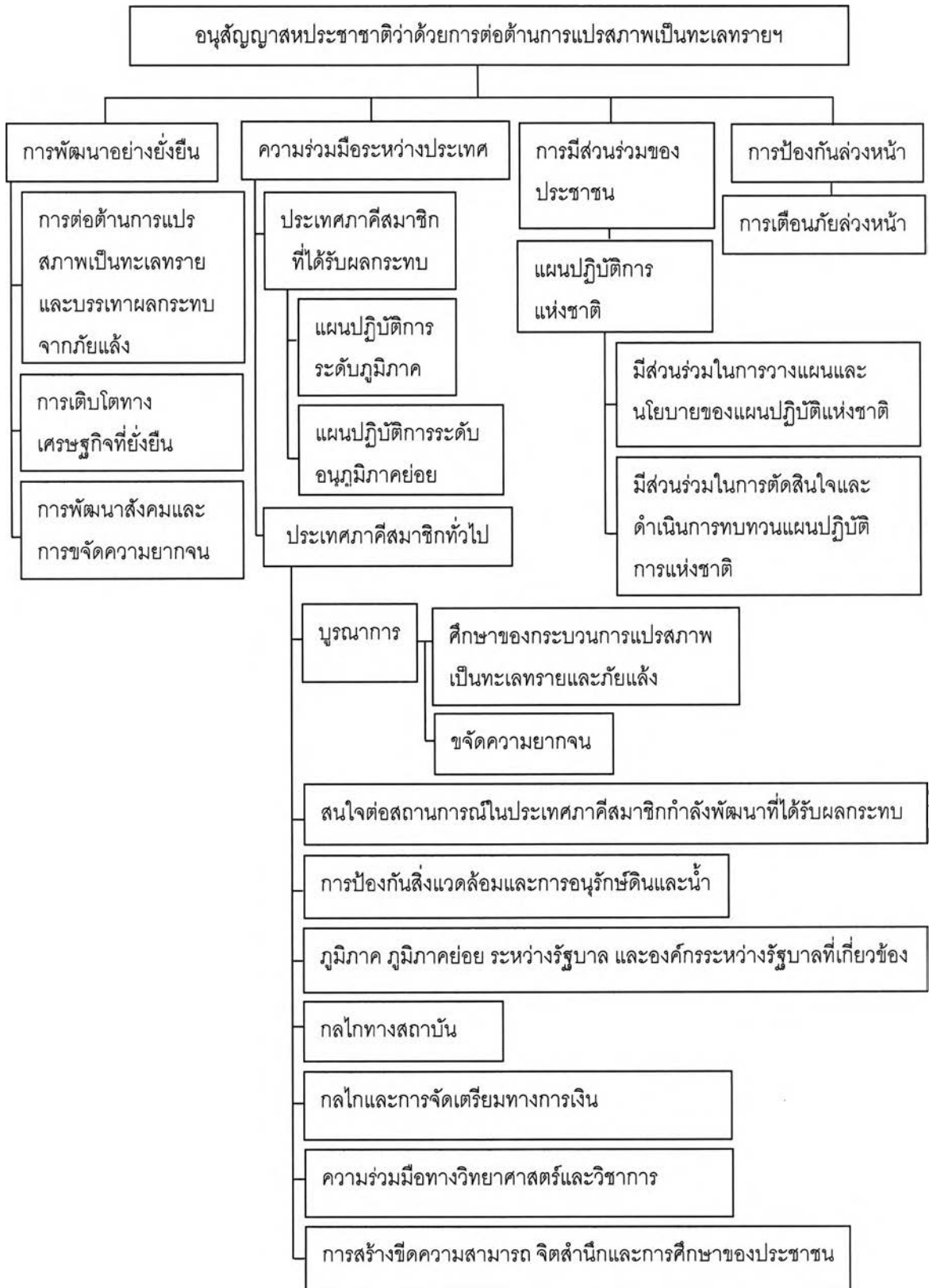
ภาพที่ 3.1 แสดงหลักการและหลักกฎหมายของอนุสัญญาสหประชาชาติว่าด้วยการต่อต้านการแปรสภาพเป็นทะเลทราย