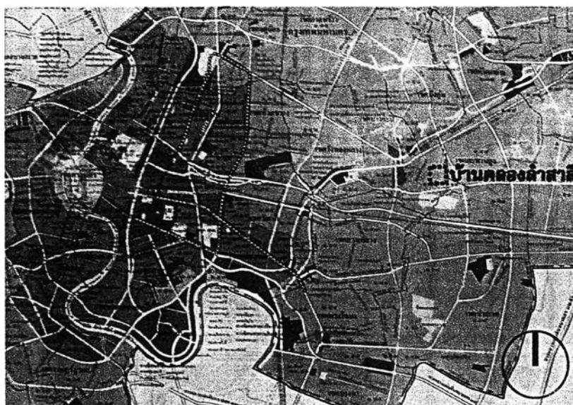
แผนที่ 1-1 แสดงตำแหน่งที่ตั้งโดยสังเขปของพื้นที่ศึกษา บ้านคลองลำสาลี