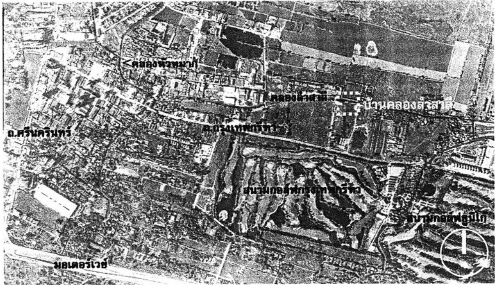
แผนที่ 1-2 แสดงลักษณะทางกายภาพของพื้นที่ศึกษา บ้านคลองลำสาละ