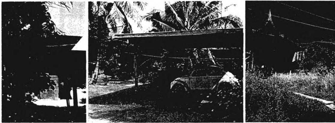
รูปที่ 1-2, 1-3, 1-4 เรือนของครอบครัววนำมาเรียม เรือนของครอบครัวป่าภูทาบ และเรือนของยายสนิ (ตามลำดับ)

อาณาบริเวณร่วม 3 ไร่ ของบ้านคลองลำสาลี เป็นที่ตั้งของหมู่เรือนไทยดั้งเดิมซึ่งผสมผสานกับเรือนไม้เป็นบ้านขยายแบบร่วมสมัยจำนวน 3 หลัง ได้แก่ เรือนของครอบครัววนำมาเรียม เรือนของครอบครัวป่าภูทาบ และเรือนยายสนิ รายรอบด้วยสภาพแวดล้อมอันอุดมสมบูรณ์ของ “ป่าอาหารขนาดย่อม” รวมถึงองค์ประกอบชีวิตอื่นๆ อาทิ บ่อน้ำ บ่อเลี้ยงปลา กระจับตอกปลา โรงเลี้ยงไก่ และคอกวัว ดินที่อาศัยพักพิงและดินทำมาหากินนี้ ได้เกื้อหนุนให้ครอบครัวใหญ่ทั้ง 3 ครอบครัว “อยู่+กิน” และ “ทำ+กิน” ได้อย่างพอเพียงและพึ่งพาตนเองได้ และด้วยสายสัมพันธ์อันแนบชิดของครอบครัวใหญ่ จึงก่อให้เกิดการพึ่งพาอาศัยกัน ช่วยเหลือเกื้อกูลกัน มีน้ำใจไมตรี สามัคคี สมานฉันท์ ดังปรากฏเป็นภาพให้เห็นได้ในเทศกาลชีวิตและงานบุญประเพณีต่างๆ ที่สานใจสมาชิกสู่ความเป็นอันหนึ่งอันเดียวกัน