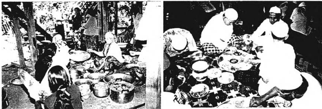
รูปที่ 1-5, 1-6 สายสัมพันธ์ชีวิตของครอบครัวใหญ่ในเทศกาลงานบุญ

ก่อนที่วิกฤตการณ์การอยู่อาศัยจะเข้ามารุกรานสมาชิกครอบครัวใหญ่แห่งบ้านคลองลำสาลี จากการเวนคืนที่ดินและกลุ่มเรือนไทยทั้งสาม สำหรับสร้างถนนกรุงเทพฯ-ร่มเกล้า อันเป็นเหตุผลักดันให้วิถีชีวิตความเป็นอยู่อันเป็นแบบอย่างที่ดีงามจักเลือนหายไปไม่ช้า การวิจัยนี้ มีความมุ่งหวังที่จะสืบสานภูมิปัญญาในแบบแผนการใช้สอยที่วางอย่างคุ้มค่า และวิถีชีวิตการเป็นอยู่อย่างพอเพียง จากกลุ่มเรือนไทย บ้านคลองลำสาลี เพื่อสร้างฐานความคิดที่มาจากท้องถิ่น ที่สามารถปรับ ประสาน ประยุกต์ใช้ ให้สอดคล้องและตอบรับกับบริบทที่เปลี่ยนแปลงไป เพื่อให้กำเนิดแห่งสถาปัตยกรรม บังเกิดเป็น “บ้านแห่งชีวิต” หรือ “ถิ่นแห่งชีวิต” อำนวยให้ชีวิตได้อยู่ดีมีสุขสืบต่อไป