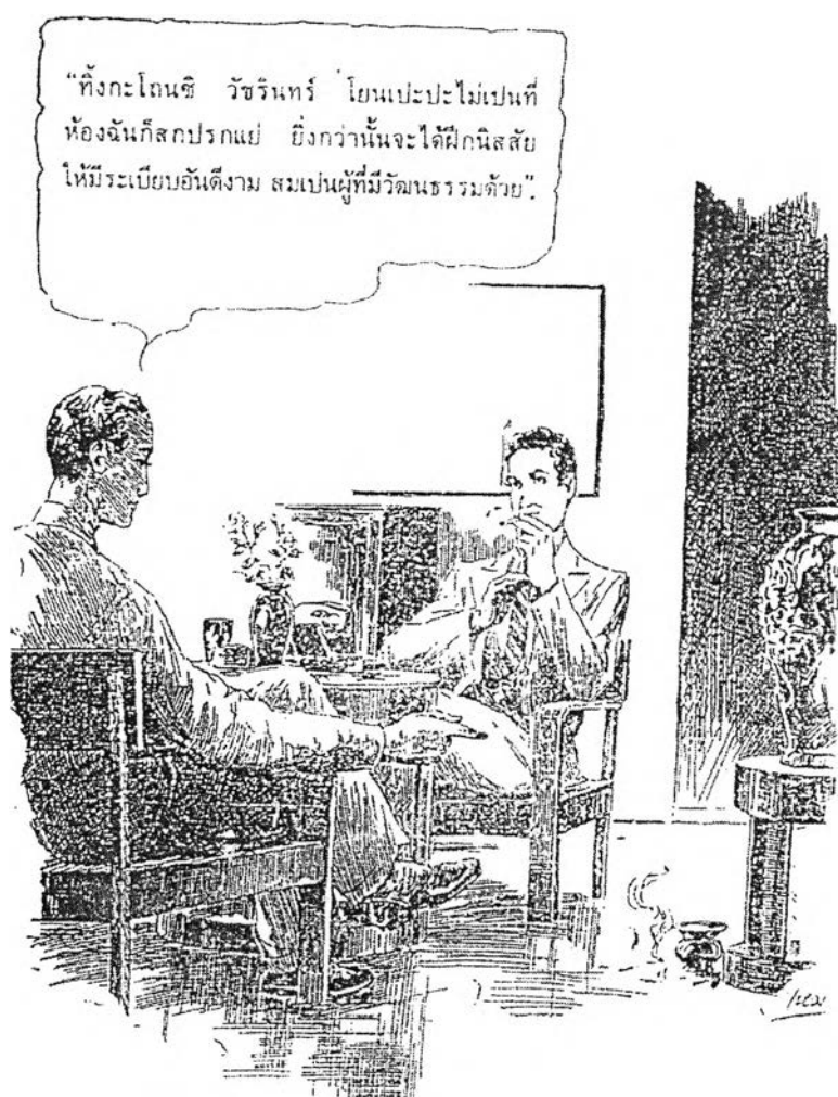
รูปที่ 1 ภาพวาดโฆษณาในการรณรงค์เรื่องวัฒนธรรม

(อนุสรณ์ครบรอบ 100 ปีจอมพล ป. พิบูลสงคราม, 2540:358)