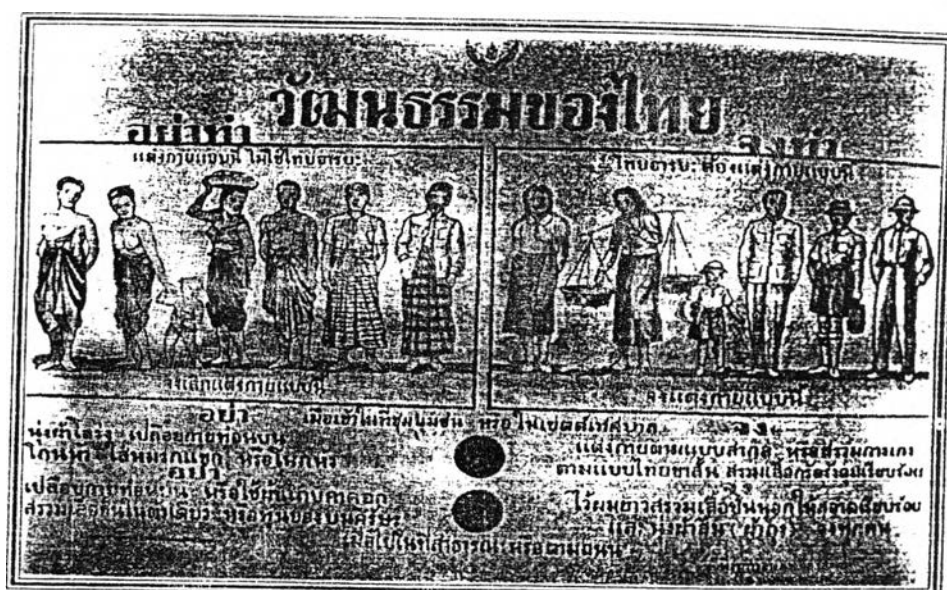
ภาพโปสเตอร์ของที่ว่าการอำเภอเมืองสงขลา เมื่อวันที่ ๑ เมษายน ๒๔๘๔ "เรื่องวัฒนธรรมแสดงภาพการแต่งกายที่เหมาะสมและไม่เหมาะสม"

(คำวิงวอนเรื่องการสวมหมวก พ.ศ. 2484 หน้า 6-7)