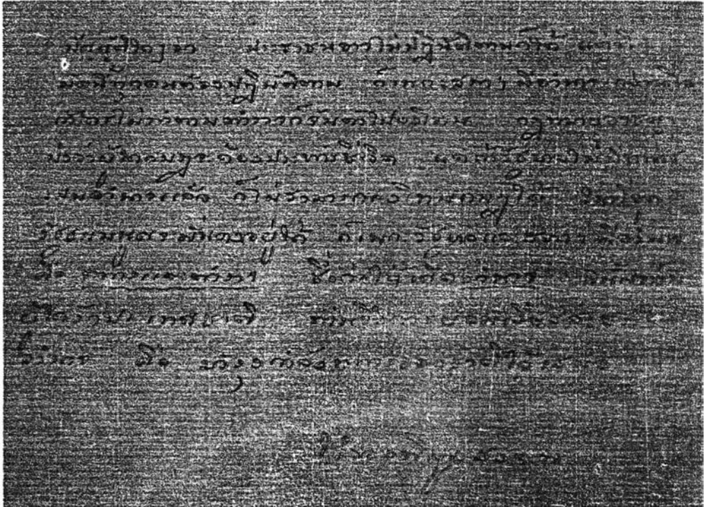
รูปที่ 4 อักษรลายมือของจอมพล ป. พิบูลสงคราม ชื่อ “ประเทศจะเจริญต้องมีอำนาจ”

จากความตามภาพที่ปรากฏในข้างต้น แสดงเจตนาของจอมพล ป. พิบูลสงครามที่ให้ความสำคัญต่อกำลังทหารและตำรวจในการควบคุมบ้านเมือง ดูได้จากความตอนท้ายที่ว่า