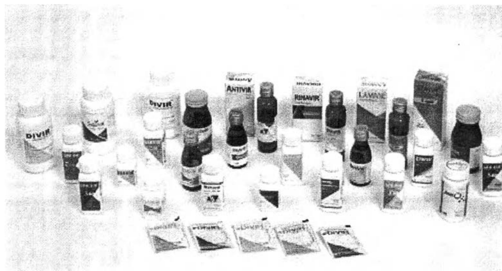
รูปที่ 3.1 ตัวอย่างผลิตภัณฑ์ขององค์การเภสัชกรรม