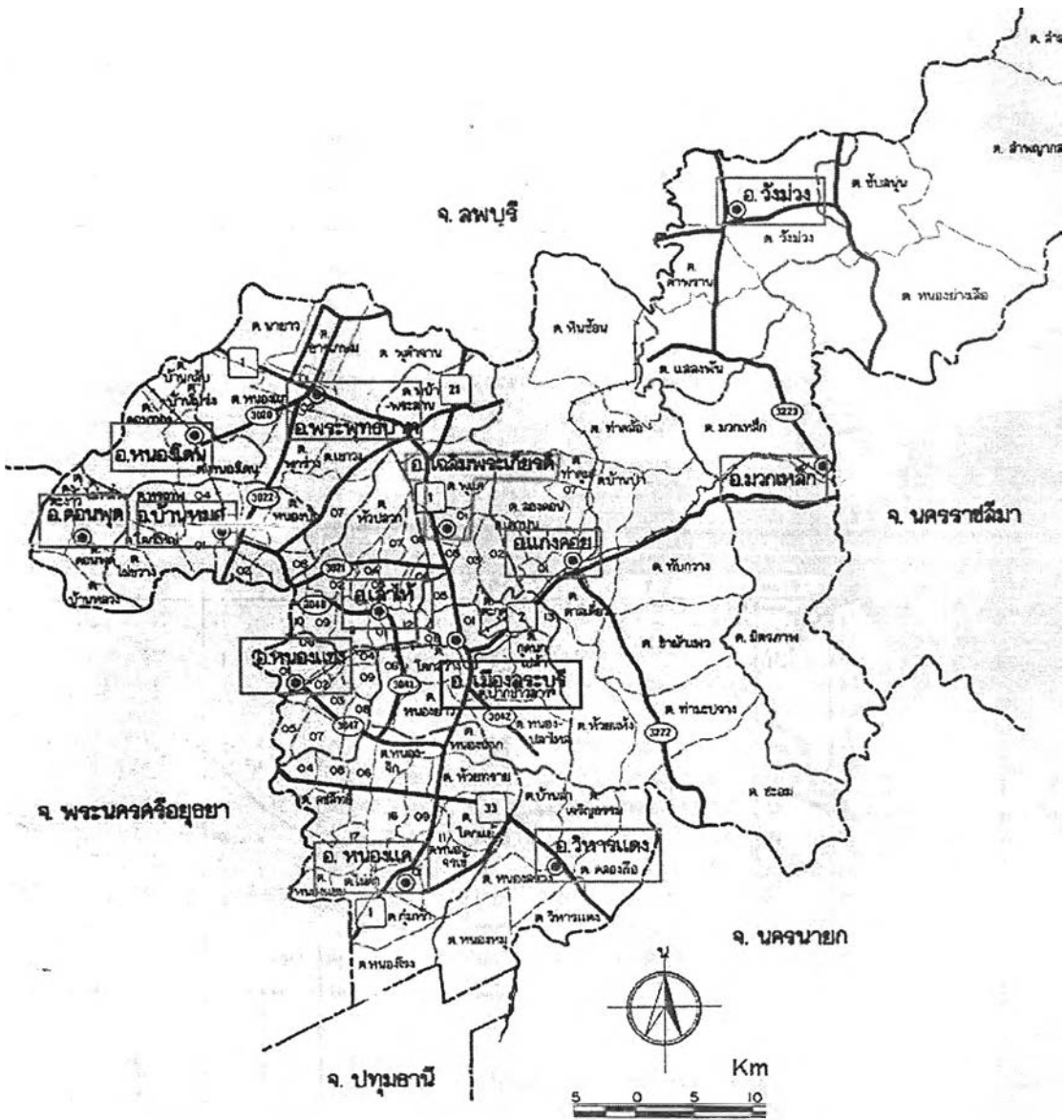
แผนภาพที่ 4.2 พื้นที่จังหวัดสระบุรี

ลักษณะอากาศของจังหวัดสระบุรีเป็นแบบฝนเมืองร้อนเฉพาะฤดู คือ จะมีฝั่นน้อยแห้งแล้งในฤดูหนาว อุณหภูมิค่อนข้างสูงในฤดูร้อน ค่อนข้างหนาวเย็นในฤดูหนาว และมีฝนตกชุกในเดือนพฤษภาคมถึงเดือนตุลาคม