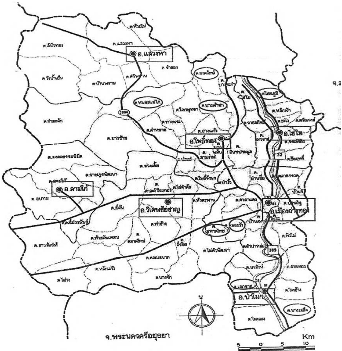
แผนภาพที่ 4.1 พื้นที่จังหวัดอ่างทอง

สภาพอากาศ ของจังหวัดอ่างทองแบ่งได้เป็น 3 ฤดู คือ ฤดูร้อน เริ่มตั้งแต่เดือนมีนาคม ถึงเดือนพฤษภาคม ฤดูฝน เริ่มตั้งแต่เดือนมิถุนายน ถึงเดือนตุลาคม ฤดูหนาว เริ่มตั้งแต่เดือนพฤศจิกายน ถึงเดือนกุมภาพันธ์