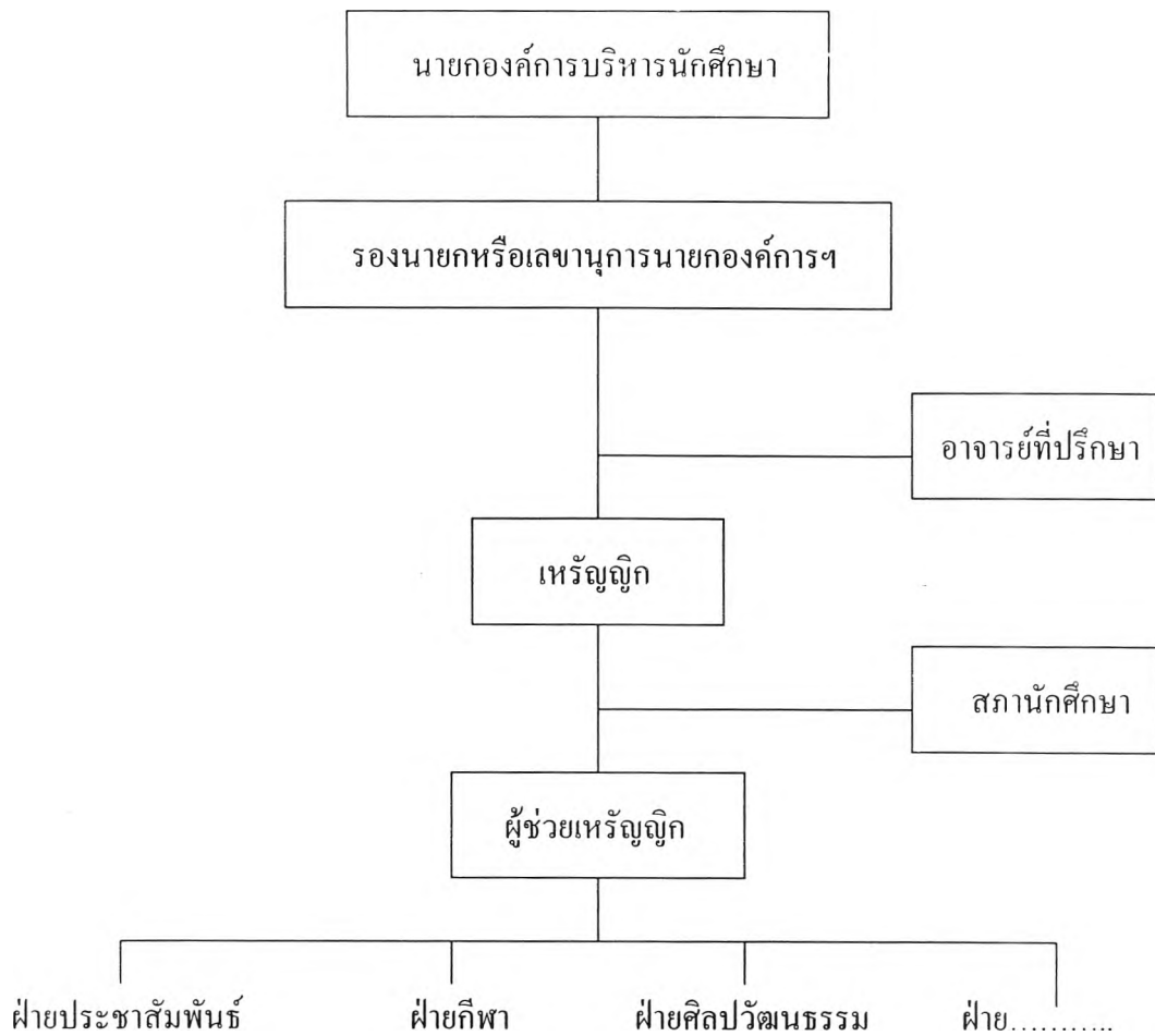
แผนภูมิที่ 7 โครงสร้างการบริหารการเงินกิจกรรมนักศึกษาระดับองค์การบริหารนักศึกษา