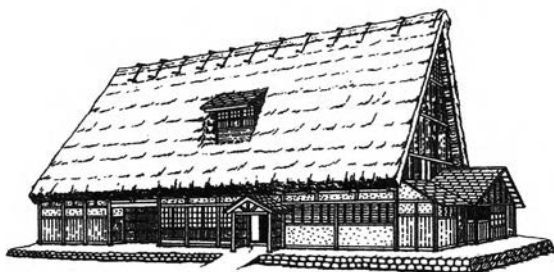
1-1. The Gassho-style house in Shirakawa-go. A hira-iri type house (entrance on long side).