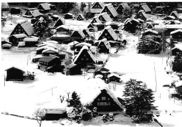
หมู่บ้านโอคิเมะจิ ในเขตชิระกะวะ ประเทศญี่ปุ่น

ระบบท่อน้ำ พื้นที่เพาะปลูกที่ไม่ต้องการน้ำมาก ถนนในหมู่บ้าน และป่าภูเขาในพื้นที่ สิ่งเหล่านี้สมควร จะต้องได้รับการสงวนรักษาไว้ด้วยจุดประสงค์ที่จะช่วยปรับปรุงสภาพแวดล้อม และคุณภาพชีวิตของผู้ อยู่อาศัยในหมู่บ้านให้ดียิ่งขึ้น ยิ่งไปกว่านั้นประเพณีบางอย่าง การเฉลิมฉลองแบบดั้งเดิม เช่น ระบบ การช่วยเหลือซึ่งกันและกันของชุมชน ตลอดจนสมบัติทางวัฒนธรรมพื้นบ้าน เช่น เครื่องมือในการทำ เกษตรกรรมต่างๆ และสภาพแวดล้อมโดยรวม ไม่ว่าจะป็นป่าไม้หรือพื้นที่เพาะปลูกซึ่งอยู่รายรอบ พื้นที่สงวนรักษาสมควรจะได้รับการสงวนรักษาไว้ด้วยเหตุผลดังกล่าวทั้งสิ้น ซึ่งต้องระวังมิให้เข้าใจผิด ว่าเป้าหมายเป็นไปเพื่อการท่องเที่ยวเพียงอย่างเดียว