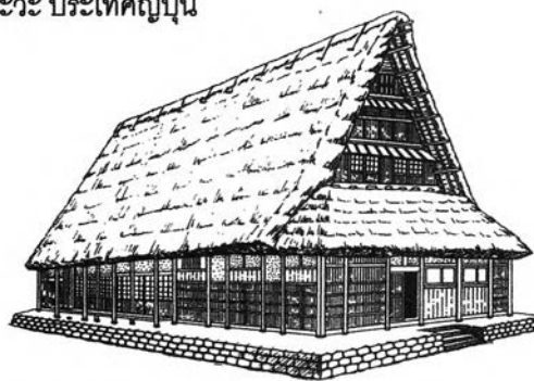
1-2. The Gassho-style house in Gokayama. A tsuna-iri type house (entrance on gable side) with a projection on the gable end, giving the appearance of a hipped-gable roof.