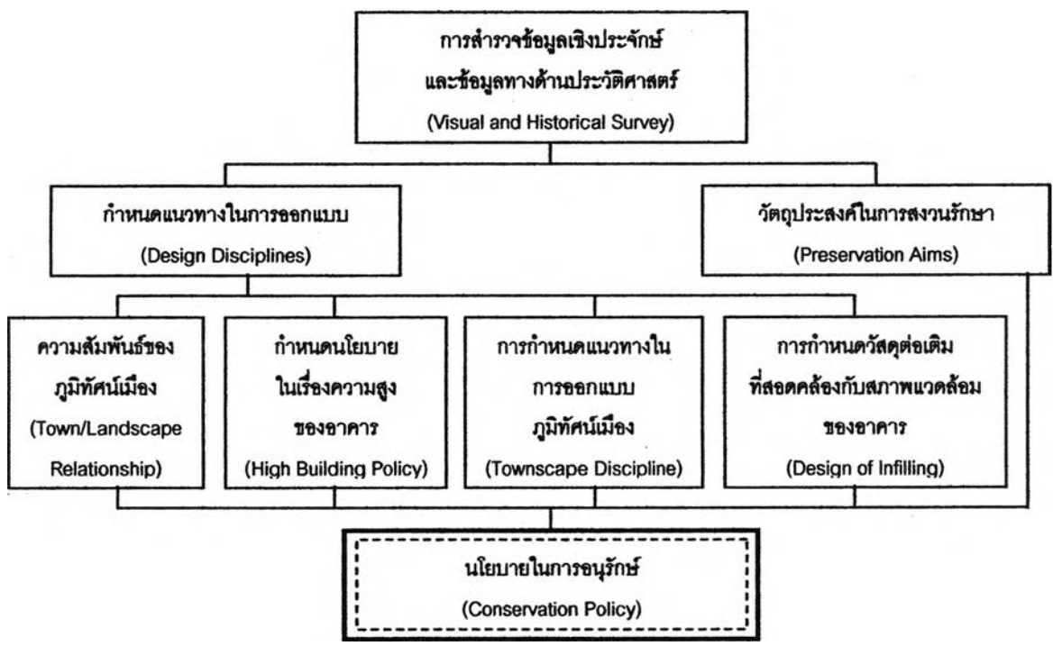
แผนภูมิที่ 2.1 แนวทางในการกำหนดการพัฒนาการใช้พื้นที่ที่มีคุณค่า และเป็นเอกลักษณ์ของเมือง

อนุรักษ์แต่แนวโน้มมักจะให้ความสำคัญกับการนำอาคารต่างๆ กลับมาใช้ใหม่ในวิถีชีวิตปัจจุบันของประชาชนเมืองมากขึ้น ทำให้เกิดผลกระทบโดยตรงต่ออาคาร กลุ่มอาคารที่มีคุณค่าทางประวัติศาสตร์จากการพัฒนาพื้นที่และกลุ่มอาคารสถาปัตยกรรมที่เกิดขึ้นใหม่โดยในการออกแบบลักษณะทางกายภาพของอาคารจะต้องไม่ไปทำลายระบบถนนโบราณ หรืออาคารประวัติศาสตร์ การสร้างอาคารใดๆ จะต้องให้เกิดความกลมกลืนกับอาคารเก่าที่ปรากฏอยู่แล้วภายในย่านนั้นๆ สิ่งสำคัญที่สุดในการสร้างอาคารขึ้นใหม่ คือ จะต้องสร้างให้กลมกลืนหรือเป็นแบบแผนเดียวกันกับกลุ่มอาคารที่มีคุณค่าในการอนุรักษ์ นอกจากนี้การสร้างอาคารขึ้นใหม่จะต้องพยายามรักษาเส้นขอบฟ้าเดิมของเมือง (Skylines) และด้านหน้าของอาคาร (Facade) ให้อยู่ในรูปแบบและยุคสมัยเดียวกันกับอาคารเก่า (Same Style, Same Period) อีกด้วย