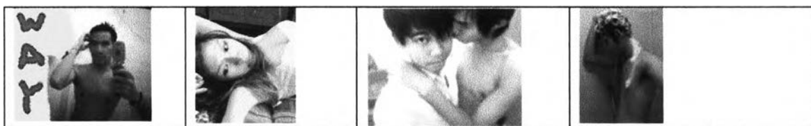
ภาพที่ 5.1: แสดงภาพถ่ายที่ถ่ายในพื้นที่ส่วนตัว

อยู่ในภาพพบว่า ในหลายๆ ภาพเป็นฉากห้องนอน หรือแม้แต่กระทั่งห้องน้ำ และส่วนหนึ่งเทคโนโลยีในปัจจุบันเป็นเทคโนโลยีพกพาซึ่งจะติดไปกับมนุษย์ทั้งในพื้นที่สาธารณะ และพื้นที่ส่วนตัว และบางเทคโนโลยีอย่างเว็บแคมเมรัวซึ่งติดอยู่กับคอมพิวเตอร์ก็มักอยู่ในบริเวณห้องนอนด้วย เทคโนโลยีดังกล่าวได้เข้าไปสู่พื้นที่ส่วนตัวของเจ้าของอัลบั้มภาพออนไลน์ และสามารถทำให้เจ้าของอัลบั้มภาพออนไลน์สามารถเปิดเผยอัตลักษณ์ของตนเองในความเป็นส่วนตัวได้มากยิ่งขึ้น ไม่ว่าจะเป็นภาพอาบน้ำในห้องน้ำของตนเอง ภาพถ่ายนอนบนเตียงของตนเอง เห็นได้ว่าเทคโนโลยีหรือ อุปกรณ์การถ่ายภาพในปัจจุบันส่งผลต่อการเปิดเผยอัตลักษณ์หรือตัวตนได้