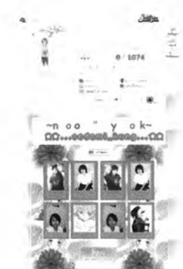
ภาพที่ 5.3 : แสดงอัลบั้มภาพออนไลน์ที่มีสีสันทัน ตัวหนังสือเคลื่อนไหว เรียกร้องความสนใจ

การเรียกร้องความสนใจก็เป็นอีกระดับหนึ่งที่สูงขึ้นกว่าการแสดงออกเท่านั้น เพราะไม่เพียงแต่นำตนเองเข้าสู่พื้นที่สาธารณะเพื่อแสดงตน แต่พบว่าอัลบั้มภาพออนไลน์ต่างๆ ตกแต่งไปด้วยสีสันทัน การทำตัวอักษรกระปรึกระปรอย การใช้ภาพเคลื่อนไหวต่างๆเป็นการดึงดูดใจรูปแบบหนึ่ง