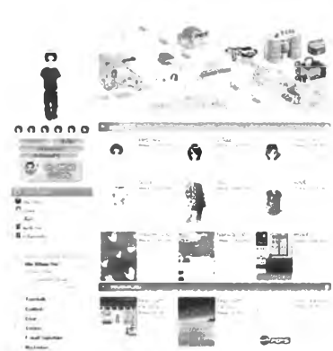
ภาพที่ 5.2 แสดงการสร้างภาพแทนตนของเว็บไซต์ http://www.jorjae.com

ในการตกแต่งภาพแทนตนนั้นเจ้าของอัลบั้มภาพออนไลน์ตกแต่งตามความพอใจของตน และไม่จำเป็นต้องเหมือนกับรูปแบบการแต่งกายในชีวิตจริง