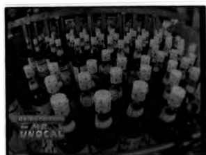
น้ำปลาแท้ ตรา หอยนางรม ตอน “น้ำปลาถ้วยเล็ก”

อย่างไรก็ตาม ในกรณีที่ผู้ผลิตรายการจำเป็นต้องถ่ายทำกระบวนการผลิตในโรงงานอุตสาหกรรมนั้น ผู้ผลิตรายการจะนำเสนอสินค้าหรือเครื่องหมายการค้าของผู้ที่ถือเพื่อสิทธิในการถ่ายทำ ตัวอย่างเช่น ตอน “น้ำปลาถ้วยเล็ก” ที่มีการถ่ายทำขั้นตอนการผลิตน้ำปลาในโรงงานของบริษัท น้ำปลาพิไชย จำกัด จะนำเสนอภาพสินค้าและเครื่องหมายการค้าของบริษัทฯ คือ น้ำปลาแท้ตราหอยนางรม หรือตอน “สับประรดกระป๋องคลายร้อน” ที่มีการถ่ายทำขั้นตอนการผลิตสับประรดกระป๋องในโรงงานของบริษัท โรงงานมาลีสามพราน จำกัด (มหาชน) จะนำเสนอภาพสินค้าและเครื่องหมายการค้าของบริษัทฯ คือผลไม้กระป๋องตรามาลี