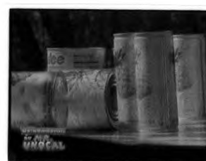
ผลไม้กระป๋อง ตรา มาลี ตอน “สับประรดกระป๋องคลายร้อน”