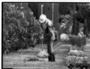
การสร้างภาพความจริงเกี่ยวกับสภาพแวดล้อมในบริเวณ ศูนย์บริการกำจัดกากอุตสาหกรรม แสมดำ

นอกจากนั้น ผู้ผลิตรายการยังจำเป็นต้องสร้างภาพความจริงเกี่ยวกับประสิทธิภาพและความปลอดภัยให้กับศูนย์บริการกำจัดกากอุตสาหกรรมแสมดำด้วยการเลือกใช้ภาพที่สะท้อนให้เห็นถึงการเอาใจใส่ดูแลสภาพแวดล้อม อาทิ คนงานกำลังทำกวาดใบไม้ ต้นไม้ใหญ่ สวนดอกไม้ สระน้ำที่ใสสะอาด