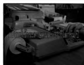
ข้อมูลเกี่ยวกับปริมาณการใช้กระดาษในประเทศไทย ตอน “กระดาษหน้าเดียว”