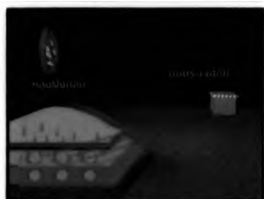
บ่อบาดาลสังเกตการณ์ตามหลักวิชาการ

ในสภาพความเป็นจริง สภาพน้ำในบ่อบาดาลสังเกตการณ์ของศูนย์ฝังกลบ จ.ราชบุรี นั้น มีสภาพเน่าเสียและส่งกลิ่นเหม็นรุนแรง ซึ่งเจ้าหน้าที่ศูนย์ฯ ได้ชี้แจงกับผู้ผลิตรายการว่าปัญหาการปนเปื้อนจะได้รับการจัดการต่อไป หลังจากการใช้ภาพจากสถานที่จริงประกอบเนื้อหาในบางตอน ผู้ผลิตรายการจำเป็นต้องสร้างความจริงขึ้นอีกครั้งอย่างไม่ตรงตามสภาพความเป็นจริงด้วยการทำกราฟฟิกภาพเคลื่อนไหวจากคอมพิวเตอร์ 3 มิติบ่อบาดาลสังเกตการณ์ในตอน "ศูนย์ฝังกลบต้นแบบ" ที่นำเสนอเนื้อหาเกี่ยวกับบ่อบาดาลสังเกตการณ์ของศูนย์ฝังกลบ จ.ราชบุรีโดยตรง