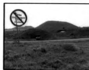
หลุมฝังกลบนิรภัย ของ ศูนย์ฝังกลบ จ.ราชบุรี

หลุมฝังกลบนิรภัยสำหรับฝังกลบของเสียอันตรายมีมาตรการในการตรวจสอบกากสารพิษรั่วซึมออกมาสู่สภาพแวดล้อมภายนอกและแพร่กระจายไปตามทางน้ำใต้ดินด้วยการขุดบ่อบาดาลสังเกตการณ์เหนือทางน้ำใต้ดินในบริเวณศูนย์ฝังกลบนิรภัย และนำตัวอย่างน้ำบาดาลมาวิเคราะห์การปนเปื้อนของกากสารพิษเป็นระยะ