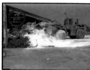
การคลุกของเสียอันตรายที่มีฤทธิ์เป็นกรดเข้ากับปูนขาว ของ ศูนย์บริการกำจัดกากอุตสาหกรรม แสมดำ

การสร้างความจริงขึ้นอีกครั้ง หรือขั้นตอนการผลิตรายการ (production) “เปิดโลกทัศน์กรอ.รักษ์สิ่งแวดล้อม” นั้น ผู้ผลิตรายการจะเขียนบท ถ่ายทำ และตัดต่อ ภายใต้การกำกับดูแลของที่ปรึกษารายการ และคณะกรรมการโครงการแผนการประชาสัมพันธ์จัดตั้งศูนย์บริหารจัดการวัสดุเหลือใช้จากอุตสาหกรรมผู้อุปถัมภ์รายการผ่านทางกรตรวจพบรายการก่อนการถ่ายทำ และการตรวจเทปวิดีโอทัศน์ก่อนการออกอากาศ ผู้ผลิตรายการจึงมีการสร้างความจริงขึ้นอีกครั้งอย่างไม่ตรงตามสภาพความเป็นจริงบางส่วน โดยเฉพาะส่วนที่เกี่ยวข้องกับ “ประสิทธิภาพและความปลอดภัยของศูนย์บริการกำจัดกากอุตสาหกรรม แสมดำ และศูนย์ฝังกลบ จ.ราชบุรี” ในความรับผิดชอบของกรมโรงงานอุตสาหกรรม ซึ่งได้ว่าจ้างให้บริษัทบริหารและพัฒนาเพื่อการอนุรักษ์สิ่งแวดล้อม จำกัด (GENCO : General Environmental Conservation Co.,Ltd.) ดำเนินการตัวอย่างเช่น ศูนย์บริการกำจัดกากอุตสาหกรรมแสมดำ เป็นสถานที่บำบัดของเสียอันตรายให้มีสภาพเป็นกลาง วิธีการหนึ่งในการบำบัดกากอุตสาหกรรมที่มีค่าความเป็นกรดก็คือ การคลุกปูนขาวที่มีค่าความเป็นด่างสูงนั่นเอง ตามหลักวิชาการและจากการให้ข้อมูลของที่ปรึกษารายการ การคลุกของเสียอันตรายเข้ากับปูนขาวจำเป็นต้องทำในสถานที่มิดชิด เพื่อป้องกันไม่ให้ของเสียอันตรายเกิดปฏิกิริยากับความร้อน ถูกกระแสลมฟุ้งกระจายหรือถูกน้ำฝนชะล้าง แต่ในสภาพความเป็นจริง ศูนย์บริการกำจัดกากอุตสาหกรรมแสมดำทำการคลุกของเสีย อันตรายบนลานกลางแจ้ง ผู้ผลิตรายการจึงจำเป็นต้องสร้างความจริงขึ้นอีกครั้งอย่างไม่ตรงตามสภาพความเป็นจริงด้วยการเขียนบทโดยละเว้นการกล่าวถึงสถานที่คลุกปูนขาวที่ปลอดภัยไป