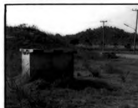
บ่อบาดาลสังเกตการณ์ ของ ศูนย์ฝังกลบ จ.ราชบุรี

นอกจากนั้น ผู้ผลิตรายการยังจำเป็นต้องสร้างภาพความจริงเกี่ยวกับเรื่องประสิทธิภาพและความปลอดภัยให้กับศูนย์ฝังกลบ จ.ราชบุรี ด้วยการเลือกใช้ภาพที่สะท้อนให้เห็นถึงความปลอดภัยของมนุษย์และสิ่งแวดล้อม ตัวอย่างเช่น ภายในศูนย์ฝังกลบ จ.ราชบุรี นั้น เต็มไปด้วยกากสารพิษรอการฝังกลบที่เป็นอันตรายต่อสุขภาพและส่งกลิ่นเหม็นรบกวนอย่างรุนแรง กรณีนี้ เจ้าหน้าที่ศูนย์ฯ ชี้แจงกับผู้ผลิตรายการว่าคนงานจะได้รับผ้าปิดจมูก ถุงมือ และรองเท้าน้ำบู๊ต ตั้งแต่แรกเข้าทำงานและจะได้รับการตรวจสอบสุขภาพจากทางศูนย์ฯ ปีละ 1 ครั้ง ซึ่งผู้ผลิตรายการพบว่า