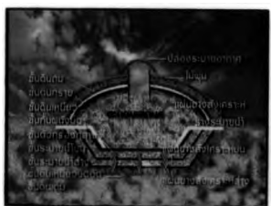
หลุมฝังกลบนิรภัยตามหลักวิชาการ