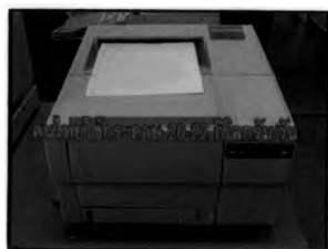
ข้อมูลเกี่ยวกับปริมาณการใช้กระดาษในประเทศไทย ตอน “กระดาษรีไซเคิล”

อย่างไรก็ตาม การทำงานของผู้ผลิตรายการสารคดีโทรทัศน์ยังขาดการตรวจสอบข้อมูลที่แสวงหามาได้ ส่งผลให้ข้อมูลที่นำเสนอในรายการมีความขัดแย้งกัน ตัวอย่างเช่น ตอน “กระดาษรีไซเคิล” นำเสนอข้อมูลเกี่ยวกับปริมาณการใช้กระดาษในประเทศไทยด้วยการช้อนตัวอักษร “คนไทย ใช้กระดาษ 20 – 22 กิโลกรัม/วัน” ในขณะที่ตอน “กระดาษหน้าเดียว” นำเสนอข้อมูลเกี่ยวกับปริมาณการใช้กระดาษในประเทศไทยด้วยการช้อนตัวอักษร “คนไทยใช้กระดาษคนละ 37 กิโลกรัม/ปี”