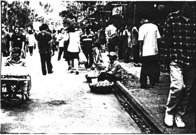
ทาบเร่ : รูปแบบและลักษณะการค้าแบบดั้งเดิมในอดีต ที่ยังคงหลงเหลือให้เห็นในปัจจุบัน