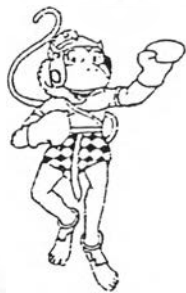
ภาพสัญลักษณ์ประกอบการแข่งขันมวยสากลสมัครเล่น