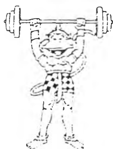
ภาพสัญลักษณ์ประกอบการแข่งขันยกน้ำหนัก

การถ่ายทอดการแข่งขันกีฬายกน้ำหนัก โทรทัศน์รวมการเฉพาะกิจแห่งประเทศไทยได้ทำการถ่ายทอดเป็นประเภทแรก ซึ่งมีการแข่งขันกันตั้งแต่วันที่ 12 ตุลาคม 2540 โดยกีฬายกน้ำหนักนั้นนักกีฬาของไทยก็ได้เข้าร่วมการแข่งขัน ซึ่งจัดอยู่ในระดับแนวหน้า เมื่อเทียบกับนักกีฬาชาติอื่น ๆ การแข่งขันยกน้ำหนักได้แบ่งเป็นการแข่งขันทีมชายและทีมหญิง ซึ่งมีรายการแข่งขันดังนี้