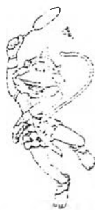
ภาพสัญลักษณ์ประกอบการแข่งขันแบดมินตัน

เมื่อเปรียบเทียบการแข่งขันกีฬาแบดมินตันกับกีฬาประเภทอื่น ๆ แล้ว จะพบว่ากีฬาแบดมินตันนั้นได้รับความสนใจน้อยที่สุด จากการถ่ายทอดการแข่งขัน เนื่องจากการถ่ายทอดโดยโทรทัศน์รวมการเฉพาะกิจแห่งประเทศไทย ไม่ได้ทำการติดตามการถ่ายทอดเหตุการณ์การแข่งขันกีฬาแบดมินตันเลย และเมื่อได้มีการถ่ายทอดการแข่งขันนั้นก็ทำการถ่ายทอดในช่วงระยะเวลาสั้น ๆ แล้วก็ตัดภาพไปยังการแข่งขันกีฬานิกิตอื่น ๆ และการถ่ายทอดนั้นก็ได้ออกการถ่ายทอดรายการชายเดี่ยว รองรองชนะเลิศ ระหว่างทีม อินโดนีเซีย กับ มาเลเซีย ซึ่งนี่อาจเป็นเพราะว่านักกีฬาไทย ยังไม่ค่อยเป็นที่รู้จัก และไม่ได้เป็นที่นิยมเหมือนกับการแข่งขันกีฬาประเภทอื่น ๆ ที่ได้มีการถ่ายทอด โดยกีฬาแบดมินตันนั้นผู้บรรยายก็ได้ บรรยายในระหว่างที่ถ่ายทอดว่า