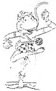
ภาพสัญลักษณ์ประกอบการแข่งขันเซปักตระกร้อ

การแข่งขันเซปักตระกร้อในการแข่งขันกีฬาซีเกมส์นั้น ทีมตระกร้อของไทยนั้นมีโอกาสได้เข้าชิงชนะเลิศ และได้เป็นแชมป์อยู่เสมอ ฝีมือลายมือของนักตระกร้อไทยนั้นจัดว่าหาคู่แข่งได้ยาก นอกจากนักตระกร้อจากมาเลเซีย ซึ่งการแข่งขันตระกร้อของ 2 ชาตินี้ นับว่าดุเดือดเผ็ดมัน ค่อสู้ด้วยฝีมือที่สูสีกันมาตลอด ทักษะและลีลาของนักกีฬาไทยและมาเลเซีย นั้นนับว่าอยู่เหนือคู่แข่งชาติอื่น ๆ อยู่มาก ในการแข่งขันแต่ละครั้งผู้ชมจะมีโอกาสได้ลุ้นอยู่ตลอดการแข่งขัน ซึ่งนอกจากเกมส์การแข่งขันที่สนุกสนานตื่นเต้นแล้วการบรรยายการแข่งขันของผู้บรรยายก็นับว่ามีส่วนช่วยให้การชมการแข่งขันนั้นสนุกสนานยิ่งขึ้น ในการแข่งขันกีฬาซีเกมส์ครั้งที่ 19 นี้เจ้าภาพอินโดนีเซียได้จัดให้มีการแข่งขันเซปักตระกร้อทั้งหมด 4 รายการ ดังนี้