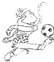
ภาพสัญลักษณ์ประกอบการแข่งขันฟุตบอล

การแข่งขันกีฬาฟุตบอล เป็นการแข่งขันรายการหนึ่งที่ผู้ชมต่างให้ความสนใจเป็นอย่างมาก นักกีฬาฟุตบอลของทีมชาติไทยนั้นก็ได้สร้างชื่อเสียงและความภาคภูมิใจให้แก่ผู้ชมชาวไทย โดยเมื่อการแข่งขันซีเกมส์ครั้งที่ 18 ที่จังหวัดเชียงใหม่ นั้น ทีมชาติไทยก็สามารถฝ่าฟันเข้าสู่รอบชิงชนะเลิศ และสามารถคว้าชัยชนะได้เหรียญทองให้แก่ประเทศไทยได้ในการแข่งขันกีฬาซีเกมส์ครั้งที่ 19 นี้ สื่อมวลชนต่าง ๆ ก็ได้ให้ความสนใจในการติดตามความเคลื่อนไหวต่าง ๆ ของทีมชาติไทย ตลอดระยะเวลาในการแข่งขันนั้น ผู้ชมจะได้รับทราบข้อมูลเหตุการณ์ต่าง ๆ ของนักกีฬาทีมชาติไทย ที่เกี่ยวข้องกับอุปสรรค การเตรียมพร้อม เป้าหมายที่วางไว้ ซึ่งนักกีฬาของไทยทุกคนต่างก็มีความมั่นใจที่จะคว้าชัยชนะมาให้ได้