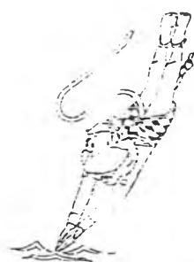
ภาพสัญลักษณ์ประกอบการแข่งขันกีฬาว่ายน้ำ

การแข่งขันว่ายน้ำเป็นกีฬาที่ได้รับความสนใจจากผู้ชมในการแข่งขันนั้นได้แบ่งออกเป็น การแข่งขันกระโดดน้ำ และการแข่งขันว่ายน้ำ ซึ่งกีฬากระโดดน้ำนั้นนักกีฬาของไทยก็สามารถคว้า เหรียญทองสร้างชื่อเสียงให้กับประเทศไม่แพ้การแข่งขันว่ายน้ำ แต่ด้วยความที่กีฬากระโดดน้ำยังไม่ค่อยเป็นที่น่าสนใจ ความสนใจของผู้ชมทั่วไปจะมุ่งไปที่การแข่งขันว่ายน้ำมากกว่า ทำให้การถ่ายทอดการแข่งขันกีฬากระโดดน้ำนั้น มีช่วงเวลาในการถ่ายทอดน้อยโดยที่โทรทัศน์รวมการเฉพาะกิจแห่งประเทศไทยจะทำการถ่ายทอดในช่วงที่นักกีฬาของไทยกำลังทำการแข่งขันอยู่ ซึ่งก็ถ่ายทอด