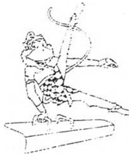
ภาพสัญลักษณ์ประกอบการแข่งขันยิมนาสติก

การถ่ายทอดการแข่งขันกีฬายิมนาสติกในการแข่งขันกีฬาซีเกมส์ครั้งที่ 19 นี้ โทรทัศน์รวมการเฉพาะกิจแห่งประเทศไทยได้ทำการถ่ายทอดการแข่งขันในรายการสุดท้ายของการแข่งขัน ซึ่งการถ่ายทอดนั้นก็ไม่ได้เป็นการถ่ายทอดโดยติดตามการแข่งขันมาตั้งแต่ต้นและในช่วงที่มีการถ่ายทอดการแข่งขันยิมนาสติกนั้น ก็ยังได้มีการตัดภาพไปยังการแข่งขันกีฬาประเภทอื่น ซึ่งดูเหมือนกับการแข่งขันกีฬายิมนาสติกนี้ ยังไม่ค่อยได้รับความสนใจเท่าใดนัก การถ่ายทอดนั้นจะเป็นการถ่ายทอด คั่นรายการ การแข่งขันกีฬาประเภทอื่น ๆ มากกว่า ทำให้การชมการถ่ายทอดเป็นไปอย่างไม่ต่อเนื่อง ระหว่างที่ทำการถ่ายทอดการแข่งขันนั้นผู้บรรยายก็ได้กล่าวถึงเรื่องราวของยิมนาสติก อย่าง