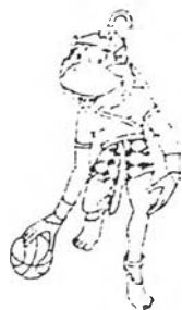
ภาพสัญลักษณ์ประกอบการแข่งขันบาสเกตบอล

กีฬามวยสากลเป็นกีฬาที่เป็นการแข่งขันระหว่างทีม 2 ทีม ในการพยายามที่จะชิงลูกให้ลงตะกร้าของฝ่ายตรงข้ามเพื่อทำคะแนนให้ได้มากที่สุด จากลักษณะของการแข่งขันดังกล่าวทำให้การบรรยายของผู้บรรยายนั้นมีความสนุกสนานโดยการบรรยายถึงลีลาของผู้แข่งขันโดยการบรรยายและการถ่ายทอดนั้นก็ได้นำมาสู่การแข่งขันของทีมชาติไทยทั้งทีมชายและทีมหญิง ซึ่งการถ่ายทอดกีฬามวยสากลนี้ โทรทัศน์รวมการเฉพาะกิจแห่งประเทศไทยได้เลือกทำการถ่ายทอดจากการแข่งขันไม่กีฬารายการเท่านี้ ได้แก่ การแข่งขันระหว่างทีมหญิงไทยกับมาเลเซีย การแข่งขันระหว่างทีมหญิงไทยกับเวียดนาม , การแข่งขันระหว่างทีมหญิงไทยกับอินโดนีเซีย และทีมชายฟิลิปปินส์กับมาเลเซีย การถ่ายทอดการแข่งขันบาสเกตบอลแต่ละครั้งนั้นจะถูกตัดภาพไปยังการแข่งขันกีฬาประเภทอื่น ๆ โดยเฉพาะในการถ่ายทอดการแข่งขันระหว่างทีมฟิลิปปินส์กับมาเลเซีย นั้นเป็นการถ่ายทอดเพื่อค้นรายการแข่งขันฟุตบอลชิงชนะเลิศระหว่างไทยกับอินโดนีเซีย ซึ่งได้เกิดเหตุการณ์จลาจลจากกองเชียร์ของอินโดนีเซีย ทำให้ไม่สามารถถ่ายทอดการแข่งขันได้