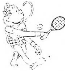
ภาพสัญลักษณ์ประกอบการแข่งขันเทนนิส

การแข่งขันกีฬาเทนนิส เจ้าภาพอินโดนีเซียได้จัดให้มีการแข่งขันทั้งหมด 7 รายการดังนี้