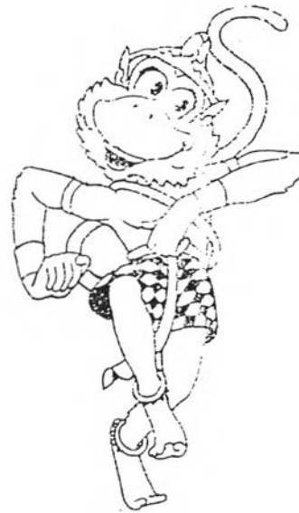
หนุมาน สัตว์สัญลักษณ์ในซีเกมส์ครั้งที่ 19

เรื่องราวของรามเกียรติ์นั้นมิได้มีปรากฏแต่เพียงการบอกเล่า หรือการบันทึกเป็นหนังสือ แต่ยังได้ถูกนำเสนอในรูปแบบต่าง ๆ เช่น การแสดงทางศิลปวัฒนธรรมของชาติต่าง ๆ ในเอเชียตะวันออกเฉียงใต้หรือการที่ถูกนำไปประยุกต์กับงานศิลปะด้านอื่น ๆ เช่น รูปปั้น ภาพวาด และงานเขียน เป็นต้น