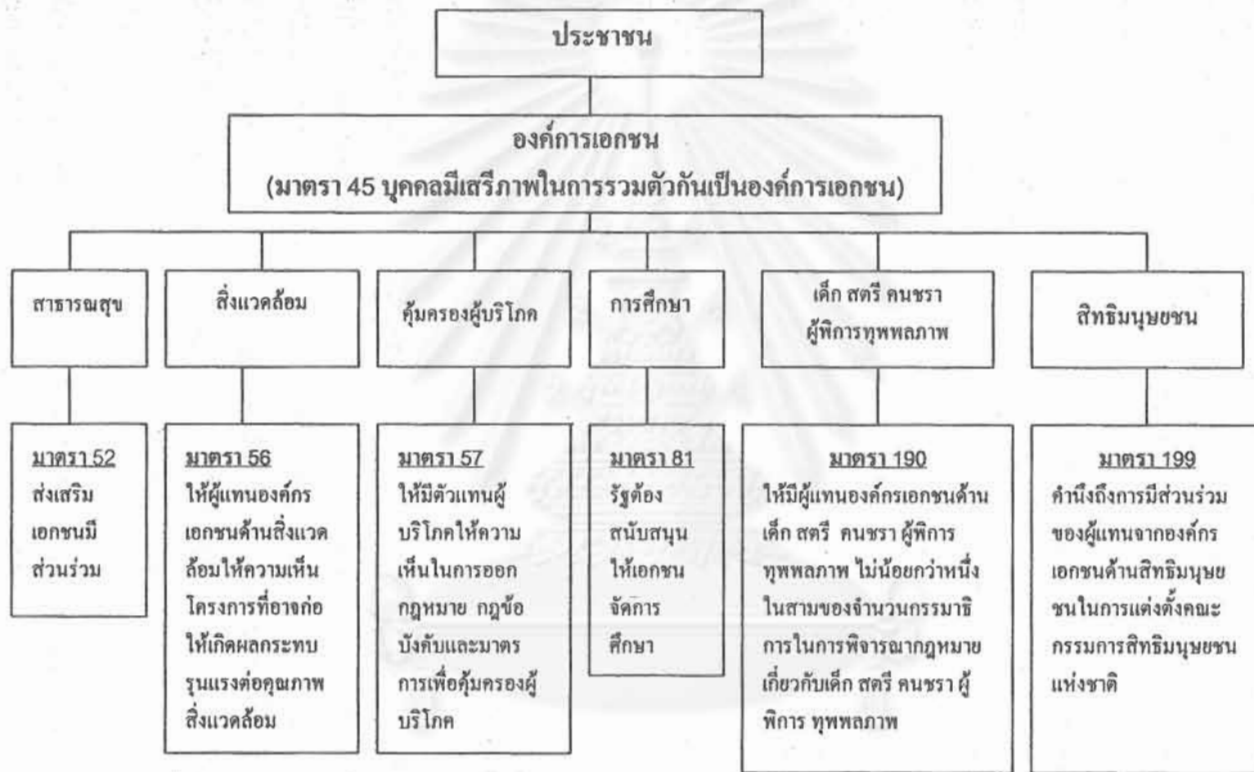
รูปที่ 3-1 บทบาทขององค์การเอกชนตามรัฐธรรมนูญ