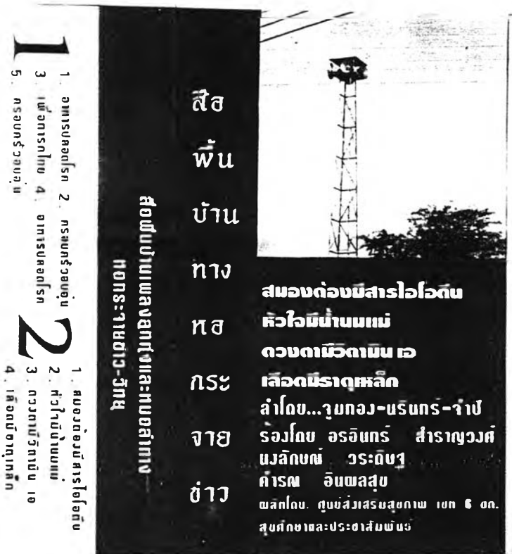
ชุดที่ 9 “สมองต้องมีสารไอโอดีน หัวใจมีน้ำมันแม่ ดวงตาวิตามินเอ เลือดมีธาตุเหล็ก”